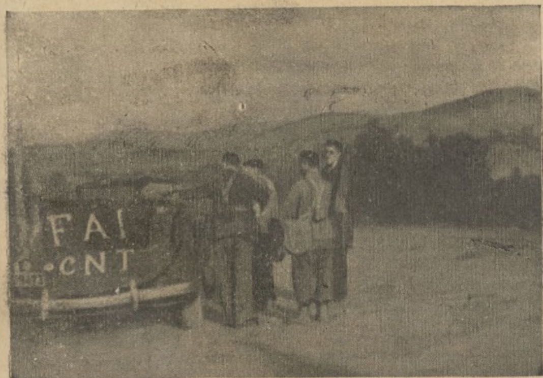
El trabajo en los frentes...