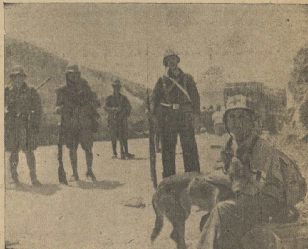
Crea asimismo, aunque con diferente misión, la cruz roja leal...