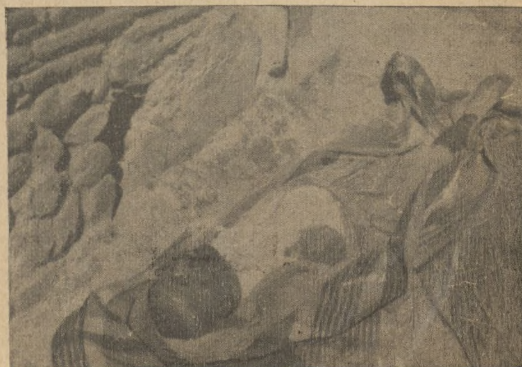
Que evita denodadamente, este espectáculo ofrecido por el campo enemigo, después de la huida...