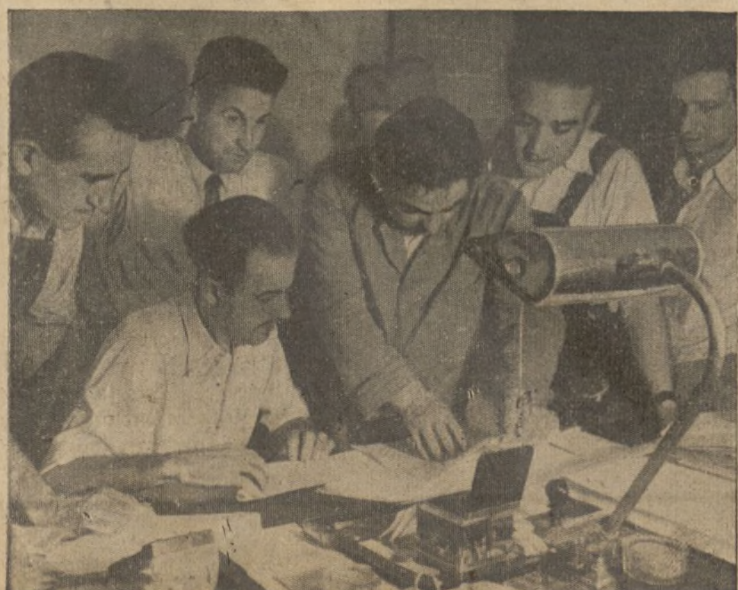
... y en la retaguardia...