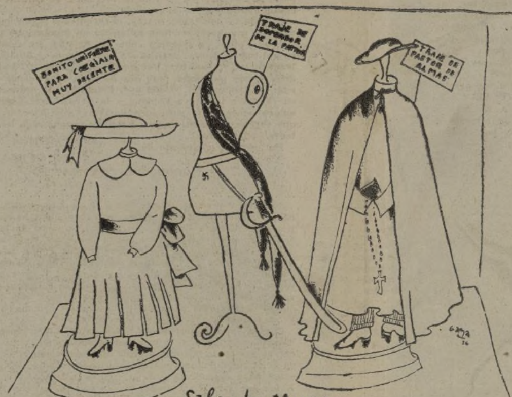
Sala de Museo

Y en el palomar, insomne, el ave amorosa, arrulla por recobrar de su nido la cálida compostura.