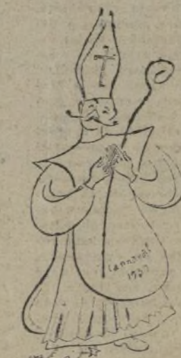
Infante titulado Destrozo.