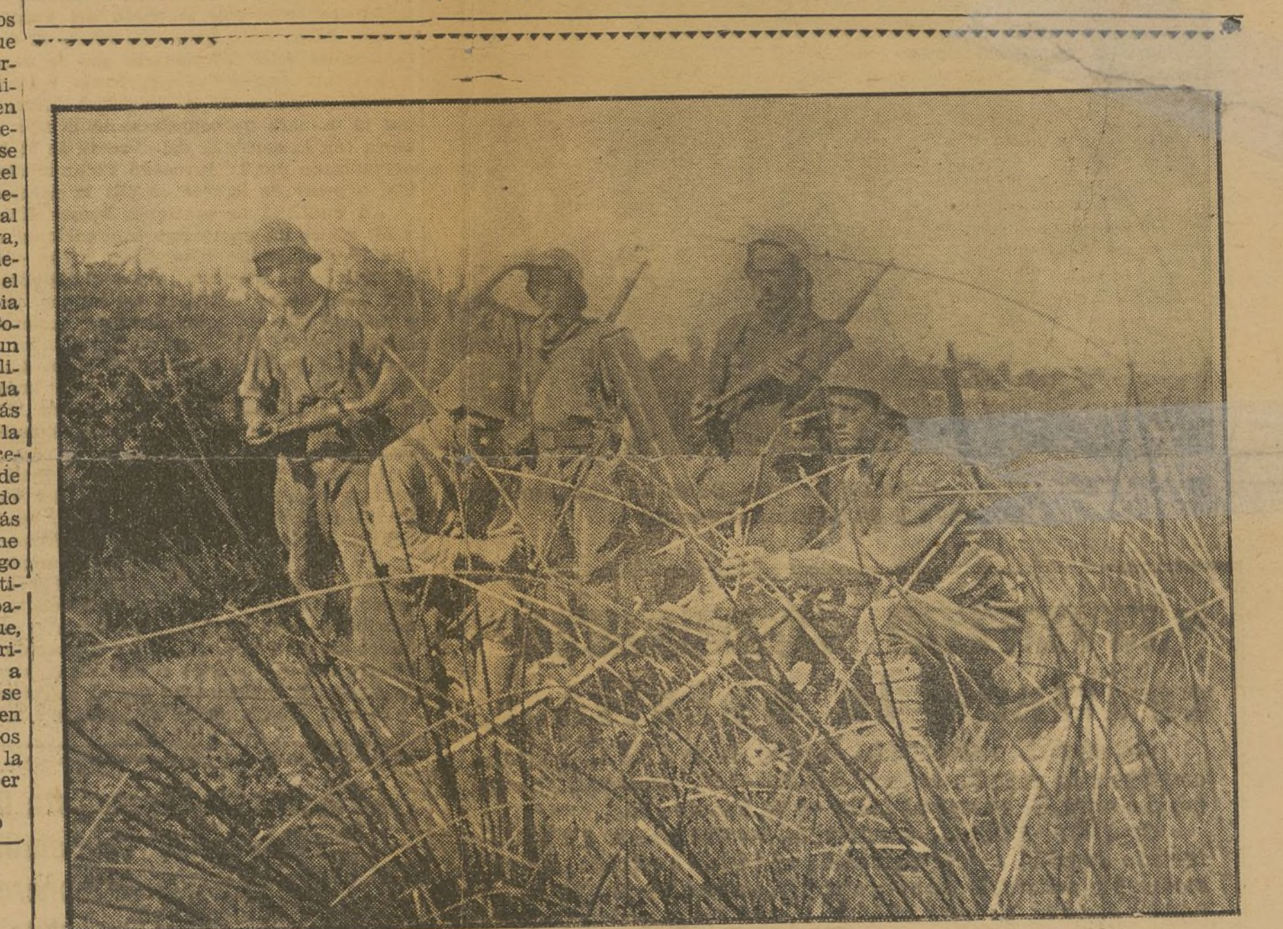
Emplazamiento de un mortero, disimulado entre la maleza, con el cual nuestros compañeros castigan al enemigo

Pero, ahora, lo sabrá toda la juventud trabajadora «Preferimos la unión con los jóvenes católicos que mueren en las trincheras de Euzkadi con la sonrisa en los labios, que con los que se llaman revolucionarios y caen en las calles de Barcelona». (De «Ahorá», órgano de las J.S.U.)