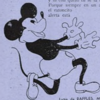
Letra de RAFFLES. Música de GRACIA.

Yo soy el Mickey de tanta fama, el ratoncito de la pantalla, muevo los ojos, muevo los brazos, las orejitas y el espinazo. Van las ratitas en Hollywood por mis hechuras haciendo el bu. Pero yo tan solo doy saltitos por los ricitos de Bety Boop