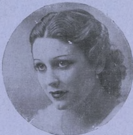
ISA DEL MAR

Fábrica de CORSÉS FAJAS Y CAUCHOUT. Gran surtido en TUBULARES. Magdalena, 27.-Tlf. 12672