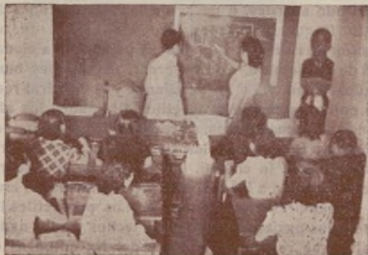
Clase de cultura general del Club LINA ODENA.

En algunos clubs se dice que esto ocurre porque los camaradas están en el frente y que son pocos los jóvenes que hay en la retaguardia. Todos olvidan que en los clubs de nues-