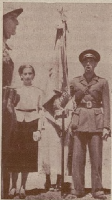
El comandante del batallón pronunciando su discurso al recibir la bandera.

Torrejón de Ardoz, Alcalá de Henares, Guadalajara... El sol caliente de esta mañana de junio se abre paso entre el ramaje verde subido de los árboles que bordean la carretera. Parece como si temiera dejar de alumbrar el paso de estos coches cargados de canciones po-