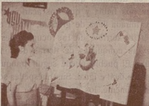
Periódico mural del Club LINA ODENA.

Algunos clubs ven la forma de atracción mediante bailes que, si se dan de vez en cuando,