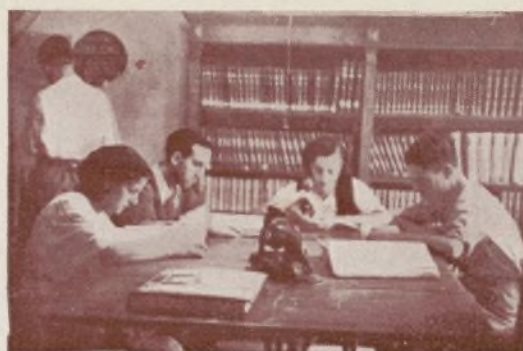
Biblioteca del Club ANTONIO CÉSPEDES.

Pero si en vez de hacer esto se les dice que hay que traer tal cosa, sin darle una explicación y escurriendo el bulto, estos camaradas no realizan estos trabajos ni ninguno que se les mande. Nuestros dirigentes tienen que ser los primeros en todo, y dando ejemplo, con la abnegación y sacrificio, en la realización de las tareas que tiene planteadas nuestra Organización; tareas que nos plantea la guerra, que