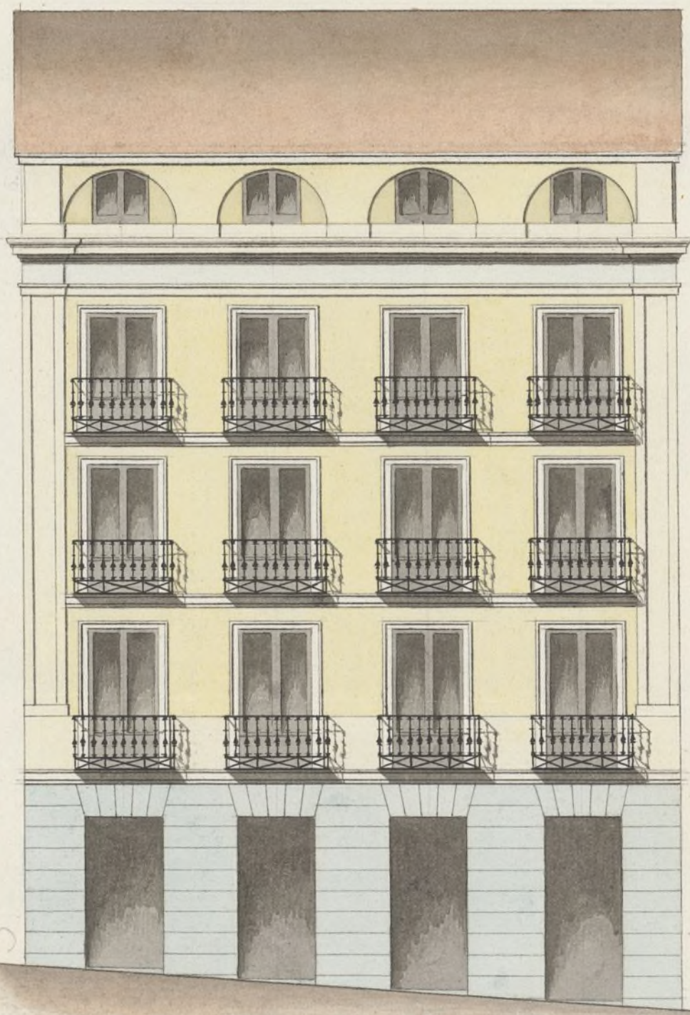
Fachada a' la Corredera.