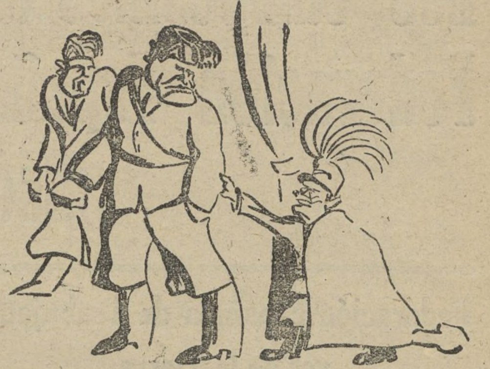
Victor Manuel a Mussolini: ¿Bueno, querido Benito! ¿Supongo que cuando tomemos Madrid será rey de Italia, emperador de Abisinia y de España, ¿verdad?*

En los círculos alemanes de Londres se dejaba hoy suponer una próxima entrevista de von Ribentrop con Lord Halifax, momentáneo sustituto de Eden, e indicaban que el embajador podría recordar la cuestión colonial bajo el aspecto de una cuestión de principio, y quizá pensar en la reanudación de un cambio de puntos de vista sobre el problema tocami-