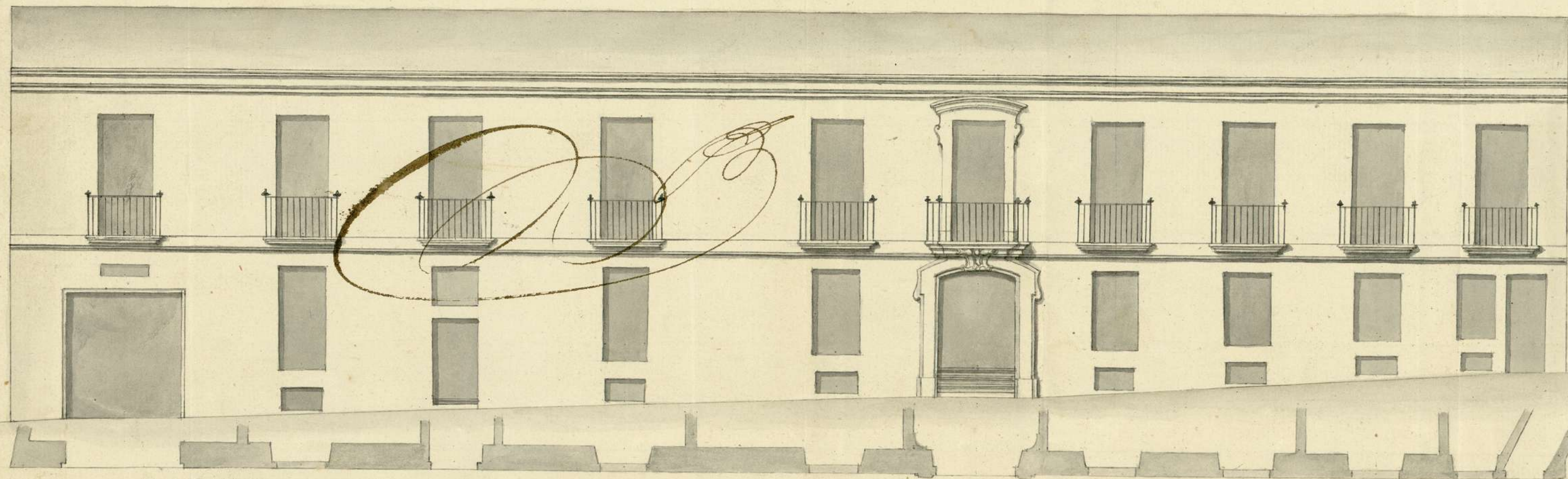
Fachada de la Calle Amaniel Ayuntamiento de Madrid