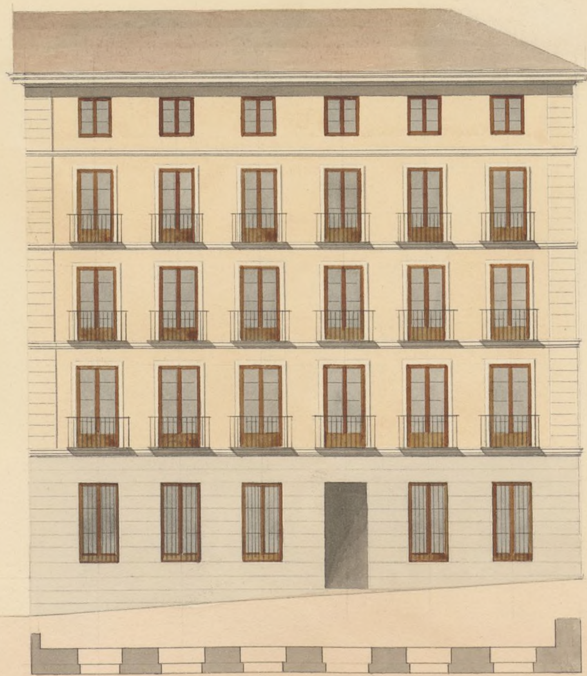
Calle ancha de S ta Bernardo.