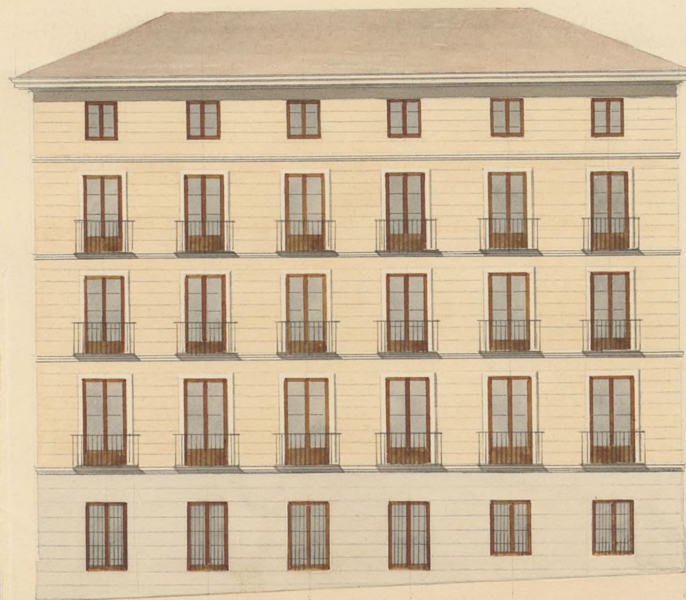
Calle de Puñeros.