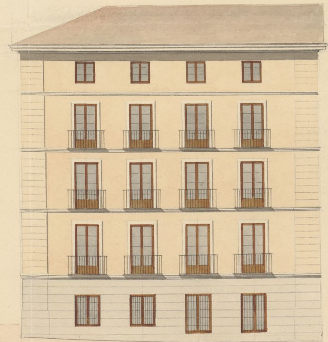
Calle del Norte.