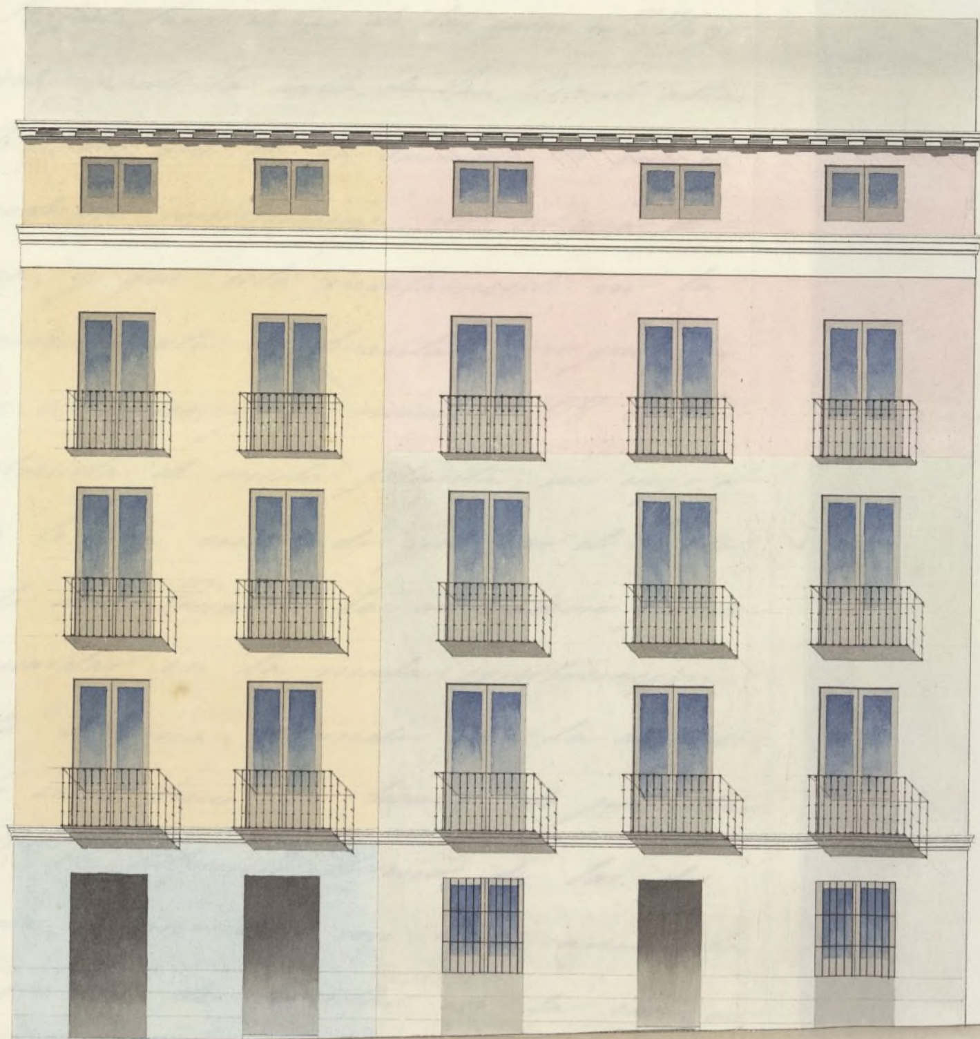
Fachada de la casa n.º 36.