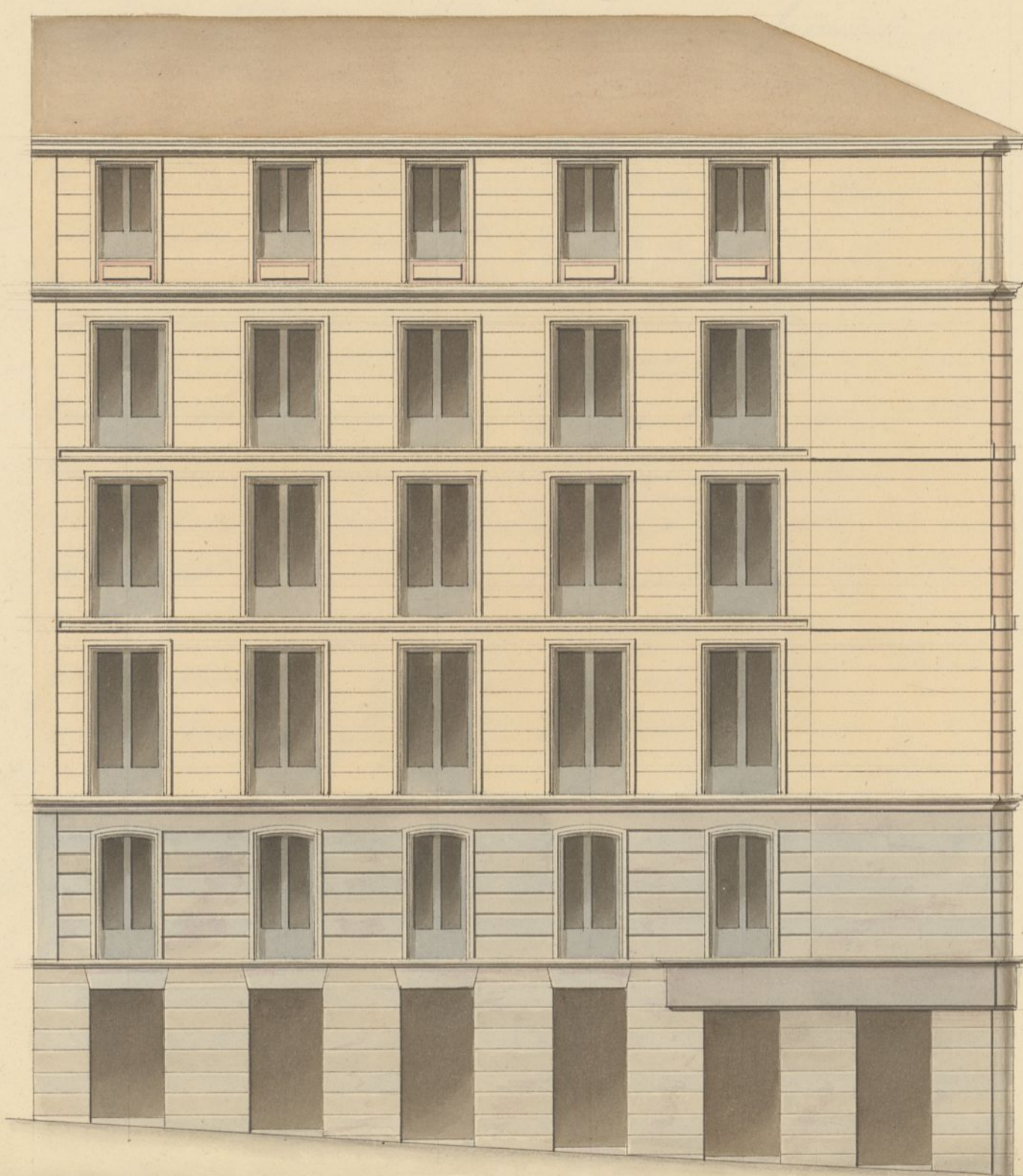
Fachada Calle del Olivar N.º 49.