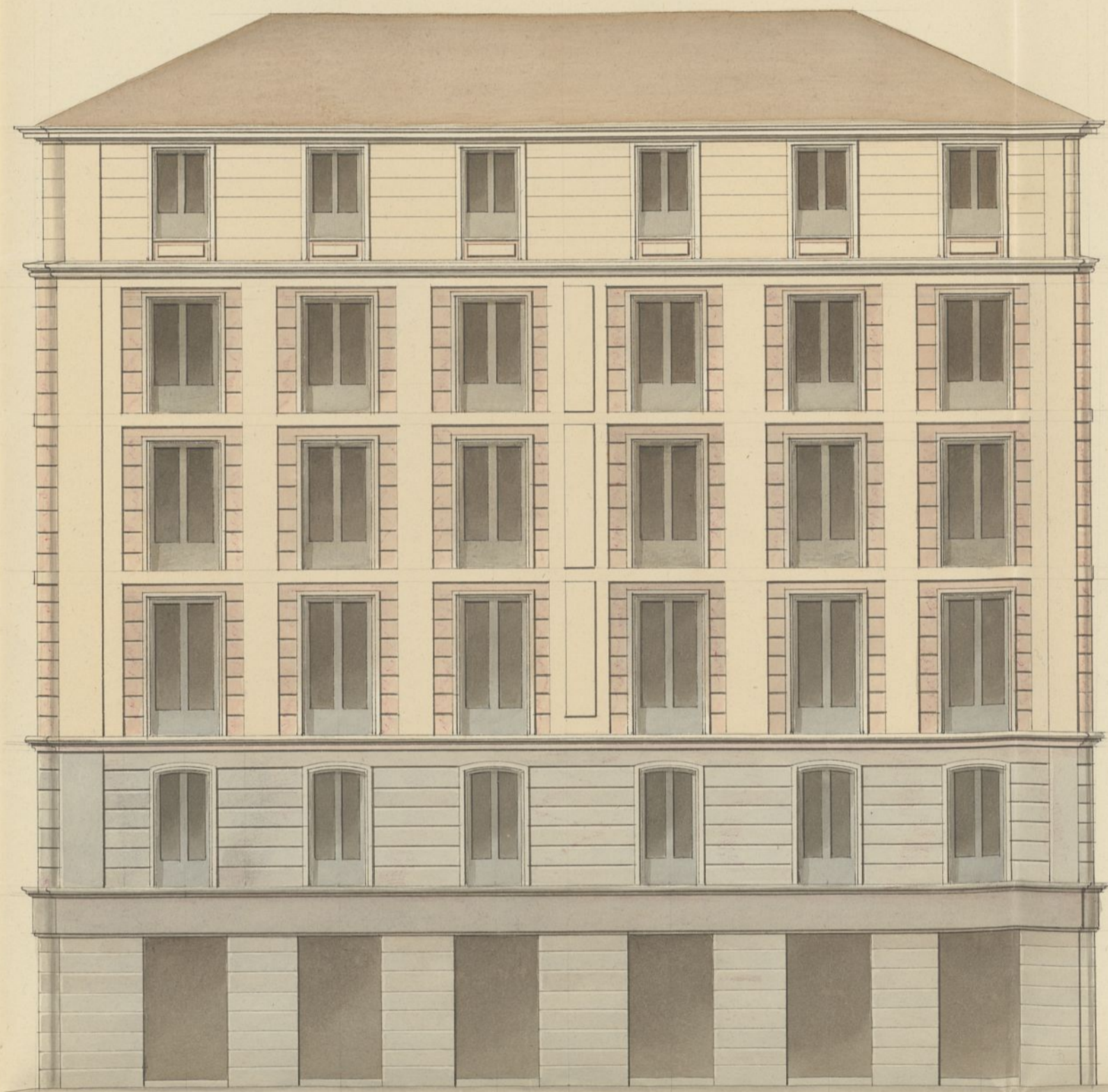
Fachada Plaza del Avapiés N.º 1.