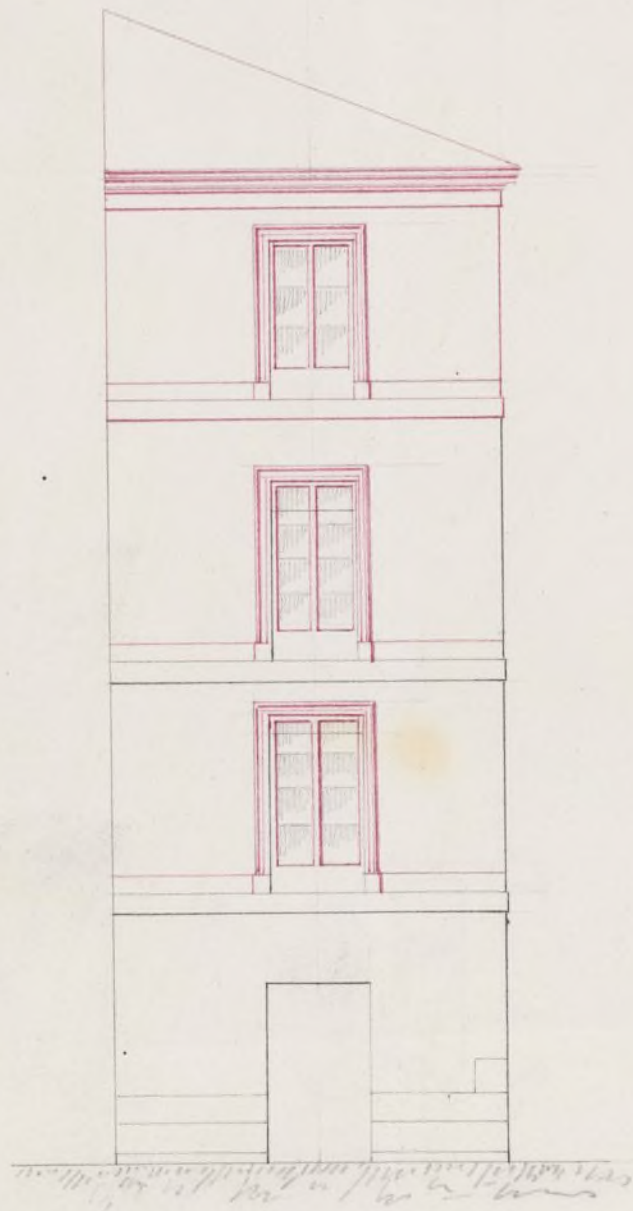
Fachada c. a del Humilladero.