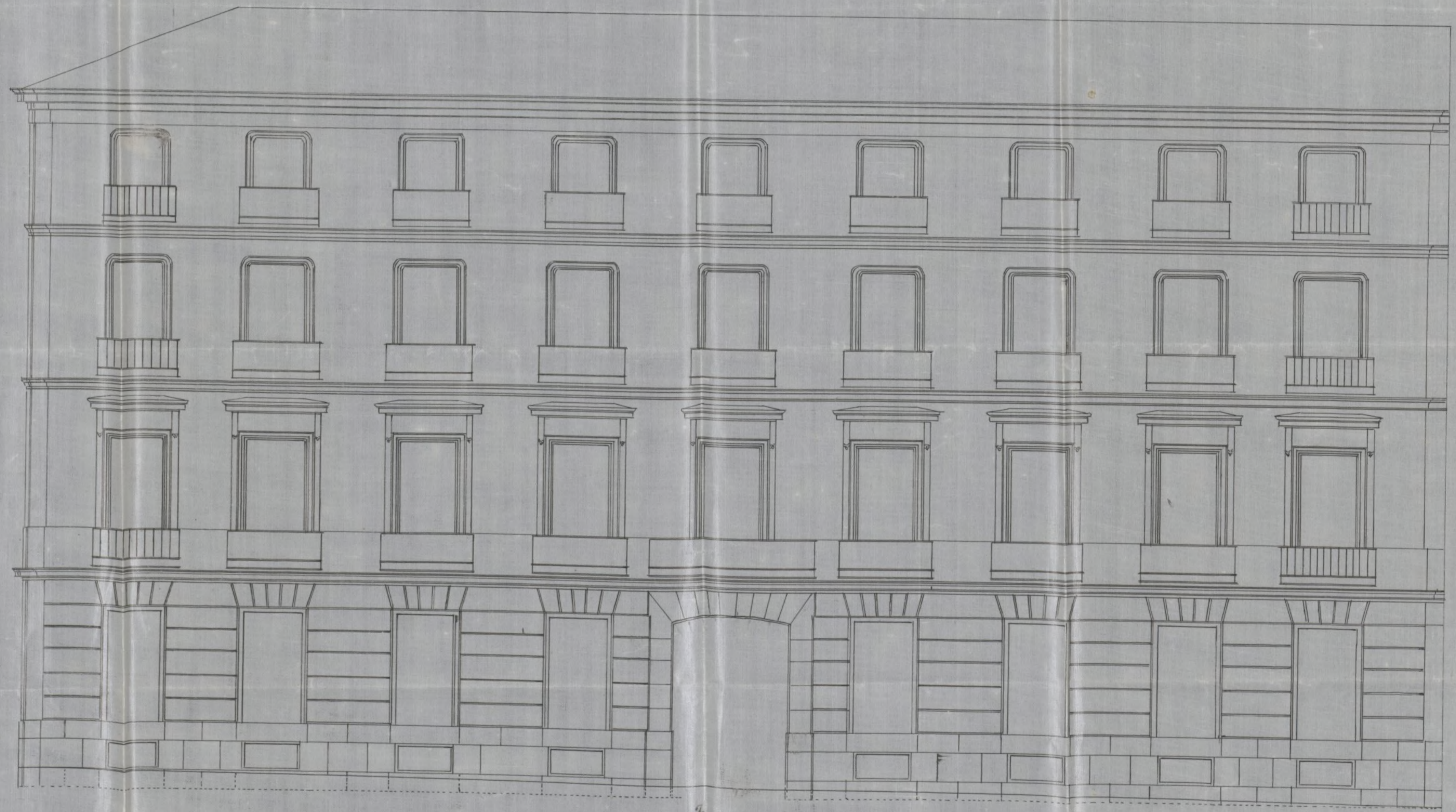
Fachada a la c. del Per.

1 2 3 4 5 6 7 8 9 10 20 30 40 50 60 varas.