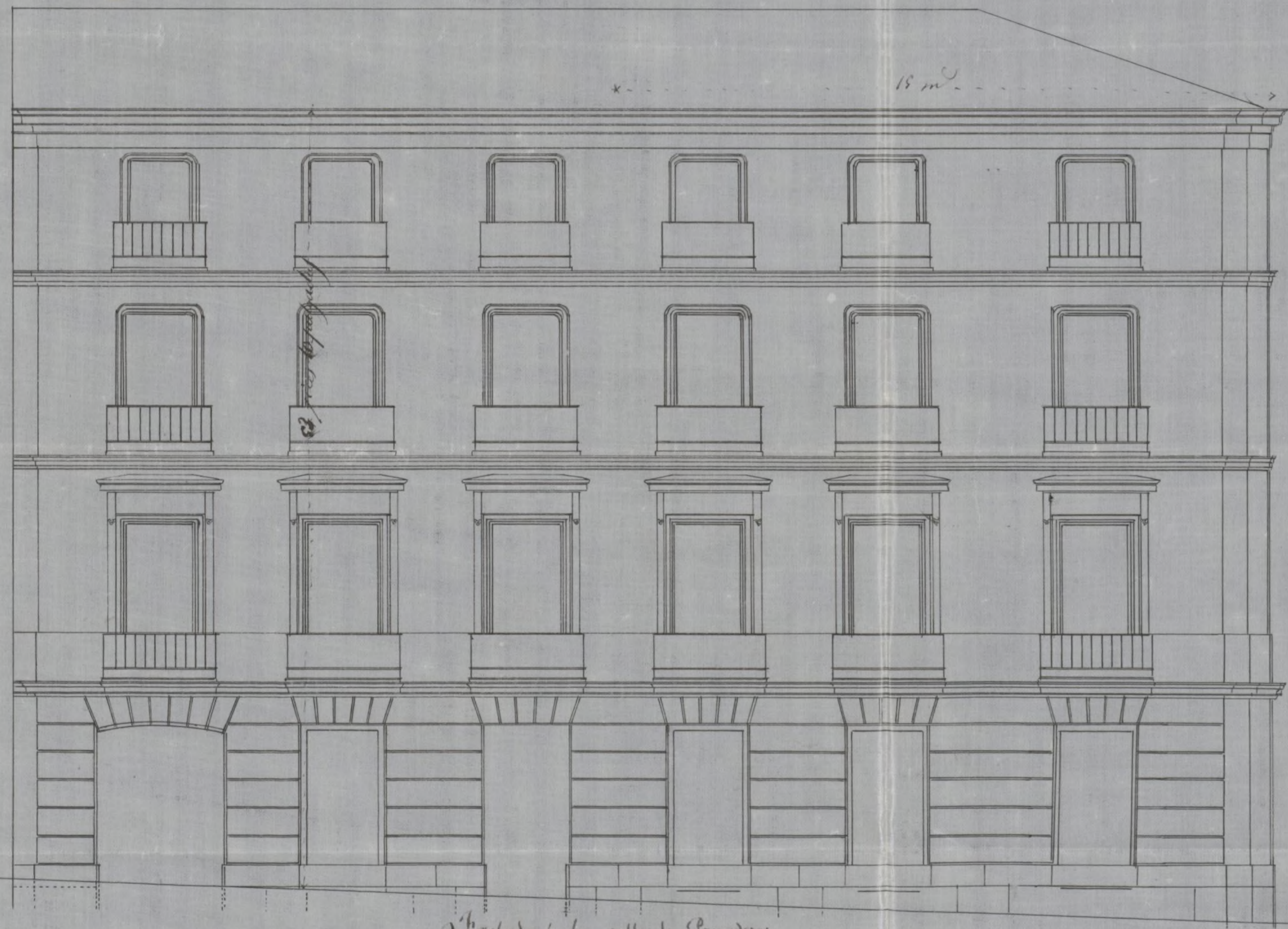
Fachada a la calle de Panaderos.

Proyecto de fachadas para la casa N.º 23 moderno de la calle del Per con vuelta a la de Panaderos, N.º 4 antiguo de la N.º 181 propiedad del Sr. Marques de Fátima.