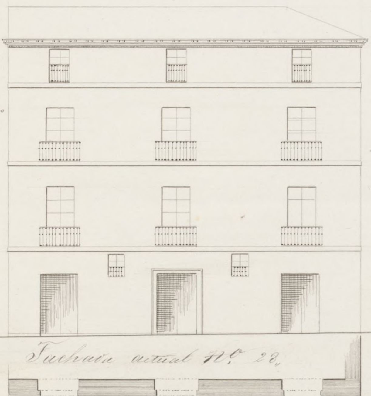
Fachada actual N.º 28,

Planta y fachada por la calle de Atocha N.º 28 mod.º Manz.º 158, con vuelta á la de Canizares.