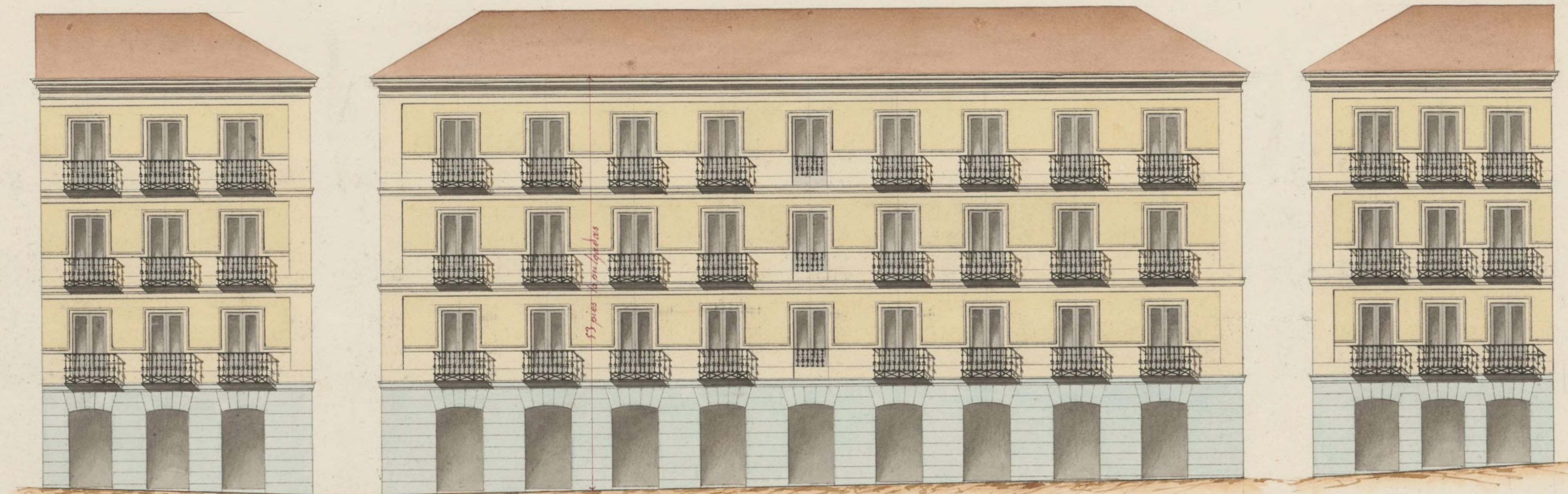
Fachada á la C.ª de la Encomienda.