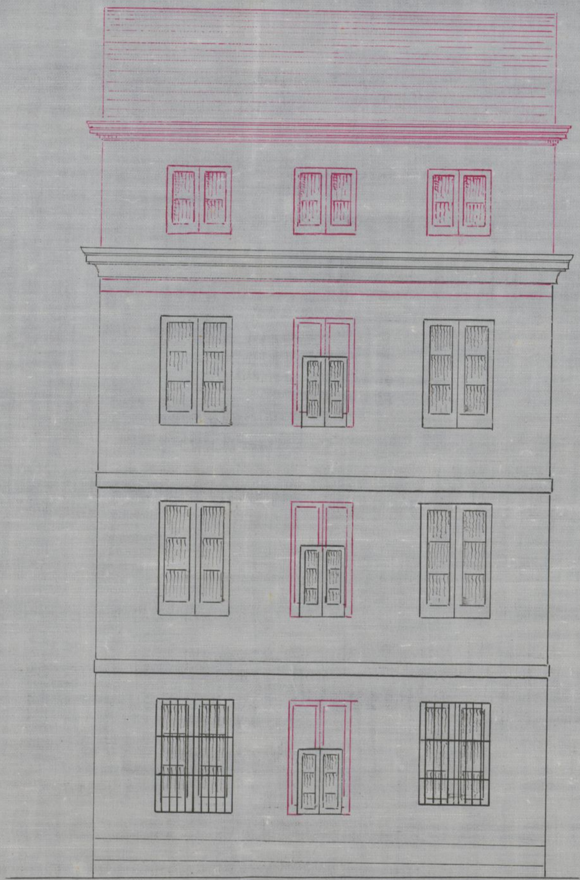
Travesía del Desengaño