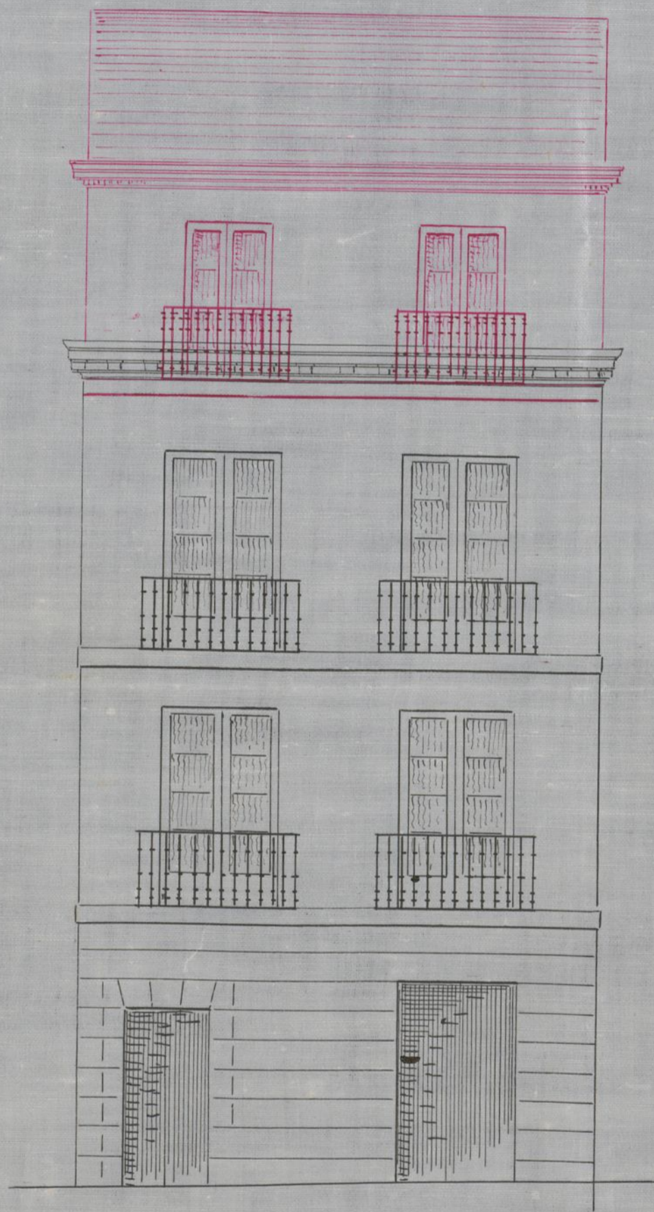
Calle de los Leones num.º 10.