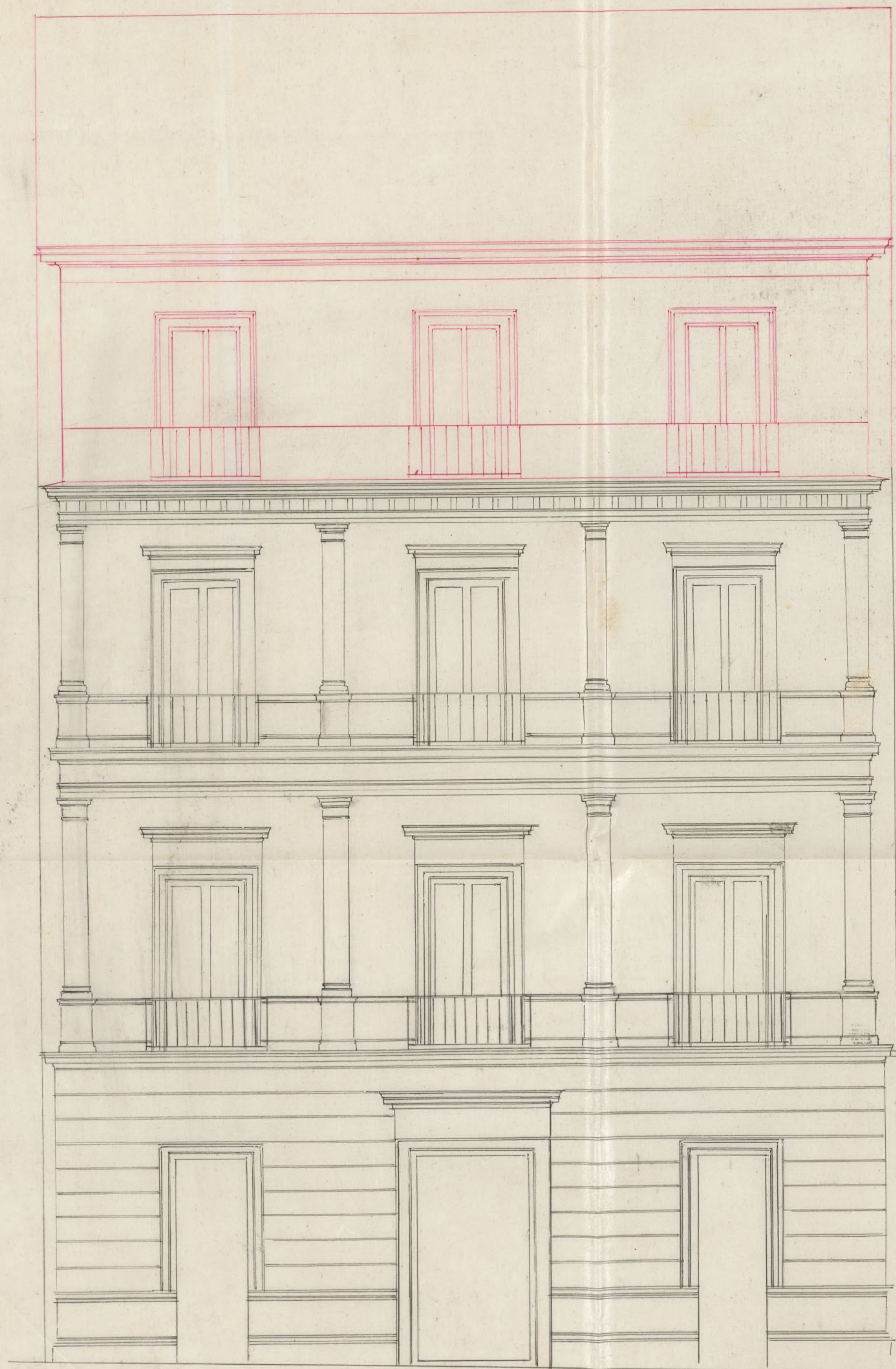
Fachada de la casa N.º 17 de la calle de Alcalá en Madrid.

ARCHIVO DE VILLA Secc. Leg. N.º Orden 4 249 16 Inventario n.º