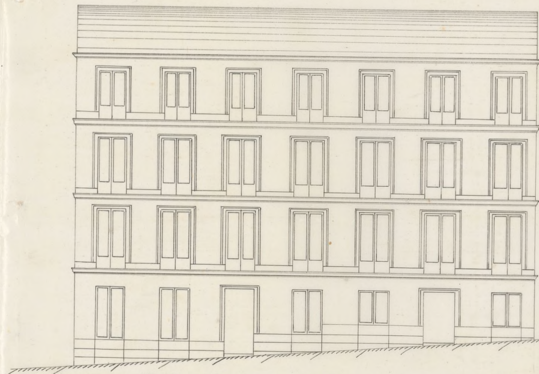
Fachada de la Calle de Jesus-del Valle Nº 15 Moderno.

Diseño de las Fachadas que se han de construir en la Calle de Jesus-del Valle Nº 15. Moderno.