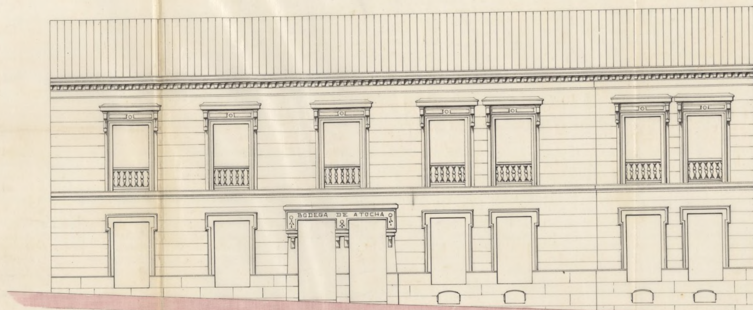
Fachada Actual .