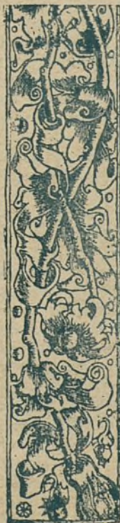
Estampa. LA CATALAN.

Repartir lo sagrat pá, y guardar los sants tresors foren los cárrechs y honors que Sant Sixt vos confiá, volgué robals lo tirá mes restá del tot burlat.