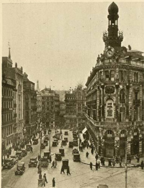
CALLE DE SEVILLA Y PLAZA DE CANALEJAS (Madrid)

Una de las primeras transformaciones modernas que se han verificado en el centro de Madrid corresponde a la calle de Sevilla, que todavía avanzada la segunda mitad del siglo XIX, era un abigarramiento de vallas y de ruinas de la antigua calle Ancha de los Peligros y de la de Hita o de los Bodegonos. De la vía primitiva es la acera de la izquierda entrando por la calle de Alcalá, y aun se conserva alguna estrecha casa de la parte vieja.