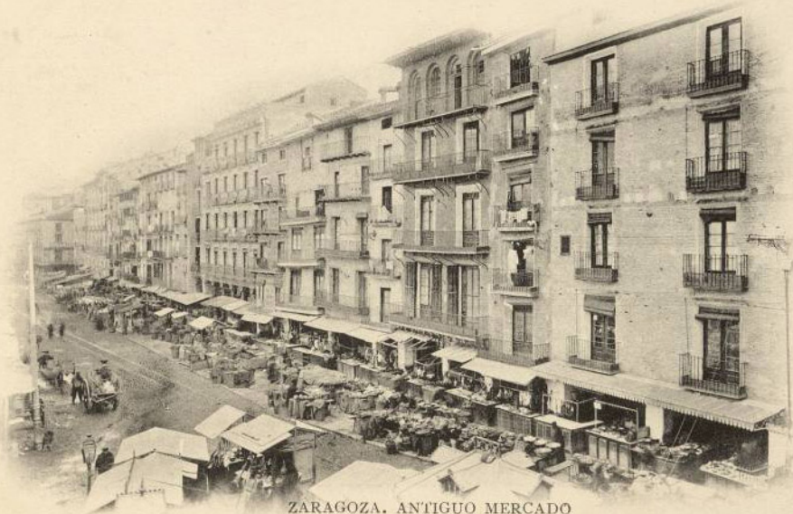
ZARAGOZA. ANTIGUO MERCADO