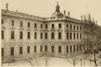
PALACIO DE JUSTICIA (Madrid)

Hecha ya en la postal correspondiente la referencia a la iglesia de las Salesas Reales, actualmente parroquia de Santa Bárbara, hemos de circunscribimos en la presente al edificio que fué monasterio y hoy es Palacio de Justicia.