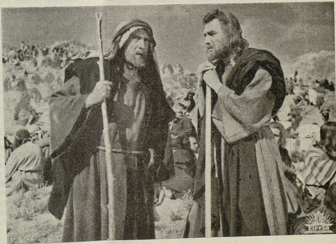
(Fotograma de la película)