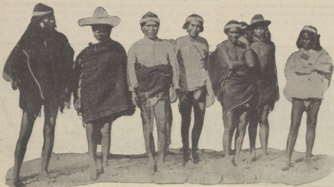
Las hordas salvajes de Pancho Villa, que en la toma de Torreón han demostrado odio implacable y ferocidad contra los españoles.

La revolución maderista fué deshonrada ya por los feroces, por los sanguinarios Zapata y Villa.