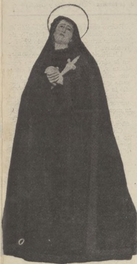
Imagen de la Virgen de los Dolores, regalada á Málaga por el senador D. José Álvarez Nef

UNA ceremonia patética y conmovedora se verificó hace varios días en Tarragona. Por primera vez el palacio arzobispal vióse invadido por numerosas personas que no vestían el traje eclesiástico. Eran el coronel del 14.º tercio de la Guardia civil, que en compañía de otros comisionados iba á visitar al arzobispo.