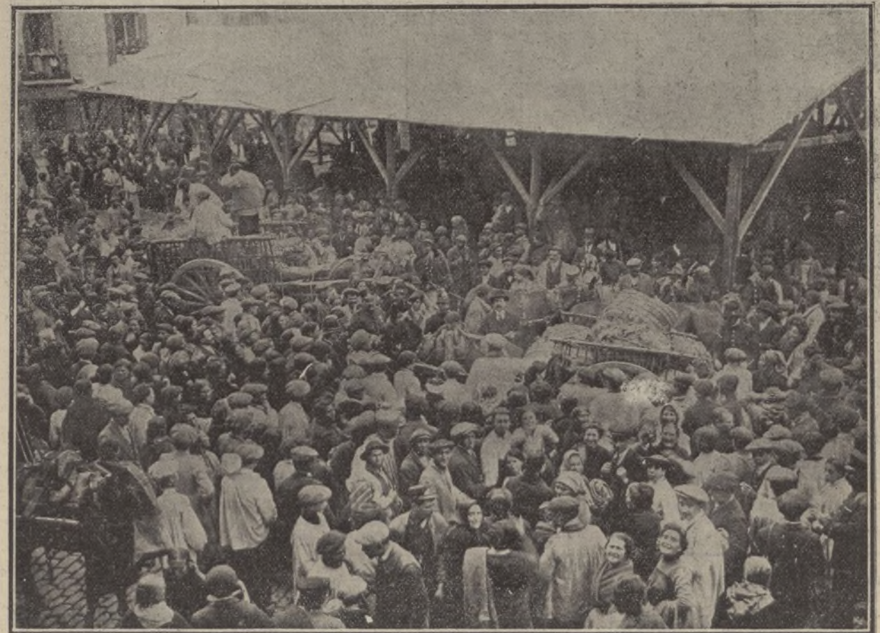
Las verduleras en el mercado de la Plaza de la Cebada, impidiendo que los carros descargaran las verduras

El alcalde, en su conferencia con los hortelanos, recabó que éstos enajenaran directamente sus géneros á las verduleras, prescindiendo de los intermediarios, que son los que, actuando así, encarecen los artículos.