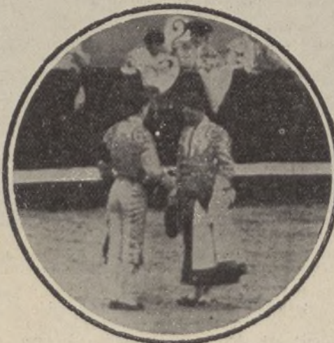
El diestro Posada en el momento de tomar la alternativa de manos de Cocherito

Bombita estuvo desgraciado; Paco Madrid no hizo nada de particular; Cocherito no consiguió vencer el aburrimiento de los aficionados, y Posada no se distinguió como se esperaba.