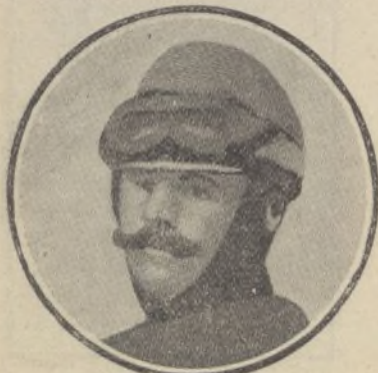
El capitán Herve, aviador francés, asesinado por los moros

Créese que el preso será muy pronto trasladado á cumplir pena á un presidio, que seguramente será el de Figueras.