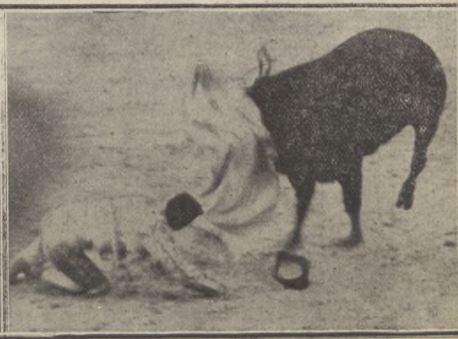
Bombita III. al ser trompado por el toro, sin consecuencias