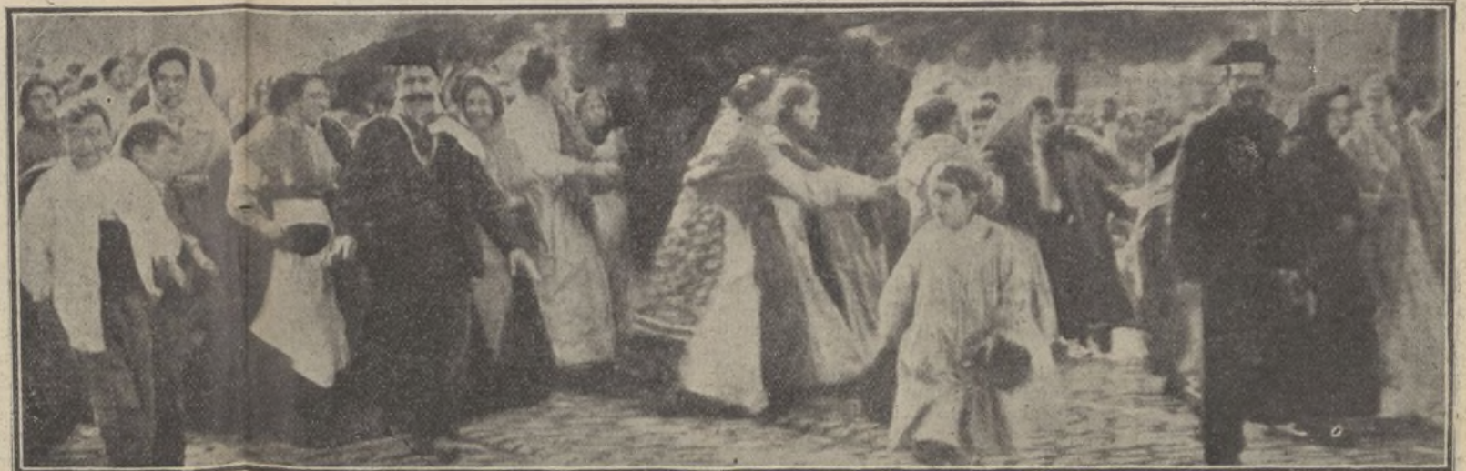
Grupos de verduleras amotinadas recorriendo los mercados para evitar la venta de hortalizas y unirse todas en la protesta

«LOS SUCEOS» ES EL PERIODICO ILUSTRADO MAS POPULAR Y DE MAYOR CIRCULACION DE ESPAÑA