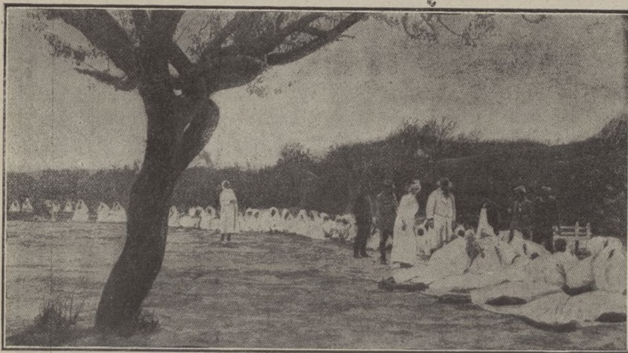
A pesar de las negativas oficiosas, es lo cierto que el temible azote de la peste se encuentra muy cerca de España. Esta fotografía lo demuestra. Figura en ella Mme. Lyautey, esposa del residente general de Francia, acompañada del Dr. Pean, en su reciente visita al lazareto de Rabat, donde se cuida a los moros atacados de peste bubónica y de tifus.