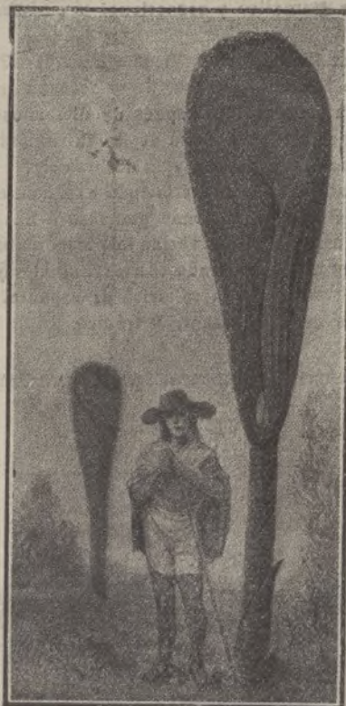
Una planta gigantesca de Nicaragua, como no hay otra en el mundo

¿Cómo pueden hacerse esos records? Sencillamente, conservando en buen estado las ca-