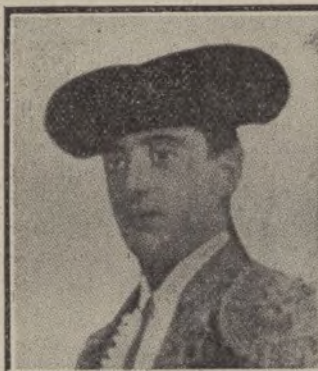
Cocherito de Bilbao