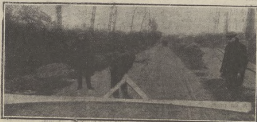
Comprobando la perfecta igualdad del piso de una carretera, para una carrera de automóviles

El terreno, apisonado con perfecta igualdad, no presenta el menor declive, y la grava se mantiene pulida como el asfalto. Para más seguridad en el recorrido, se comprueba el piso con una especie de enorme cartabón de madera, que lleva unido una plomada. De