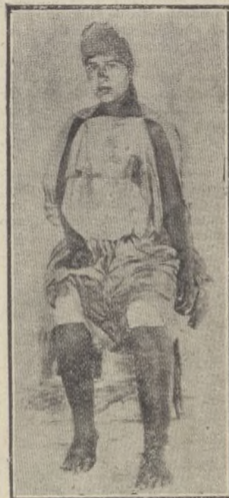
Hermosa mora de Alhucemas, atacada de elefantiasis, á la que están curando los médicos españoles

recibía con el homenaje de la benemérita. El coronel le contestó con frases laudatorias, revelando que era aquel un acto merecido, pues lo menos que podía hacer la Guardia civil era demostrar su agradecimiento á su defensor.