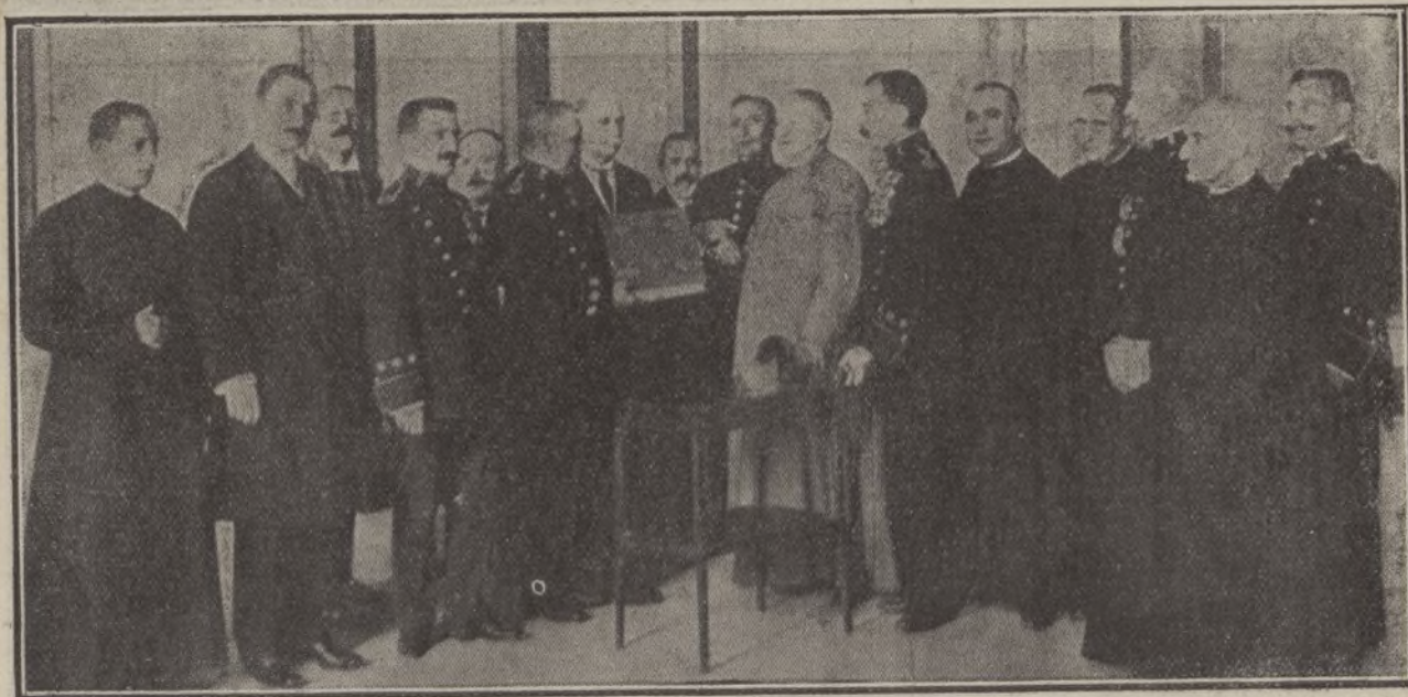
El coronel de 14.º Tercio de la Guardia civil, entregando al arzobispo D. Antolín López-Peláez, el precioso album que le regala el Instituto, como homenaje á sus campañas en pro de la Benemérita