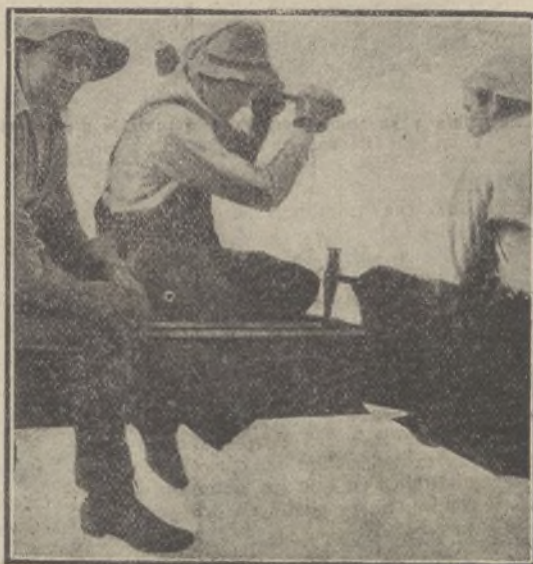
Trabajando en los techos de Nueva York.

nuevos reglamentos referentes á la educación de los soldados, que son dignos de imitación. Según las nuevas disposiciones, los soldados tienen que aprender la taquigrafía, el manejo de la máquina de escribir, redacción de cartas, trazado de mapas y lectura de los mismos.