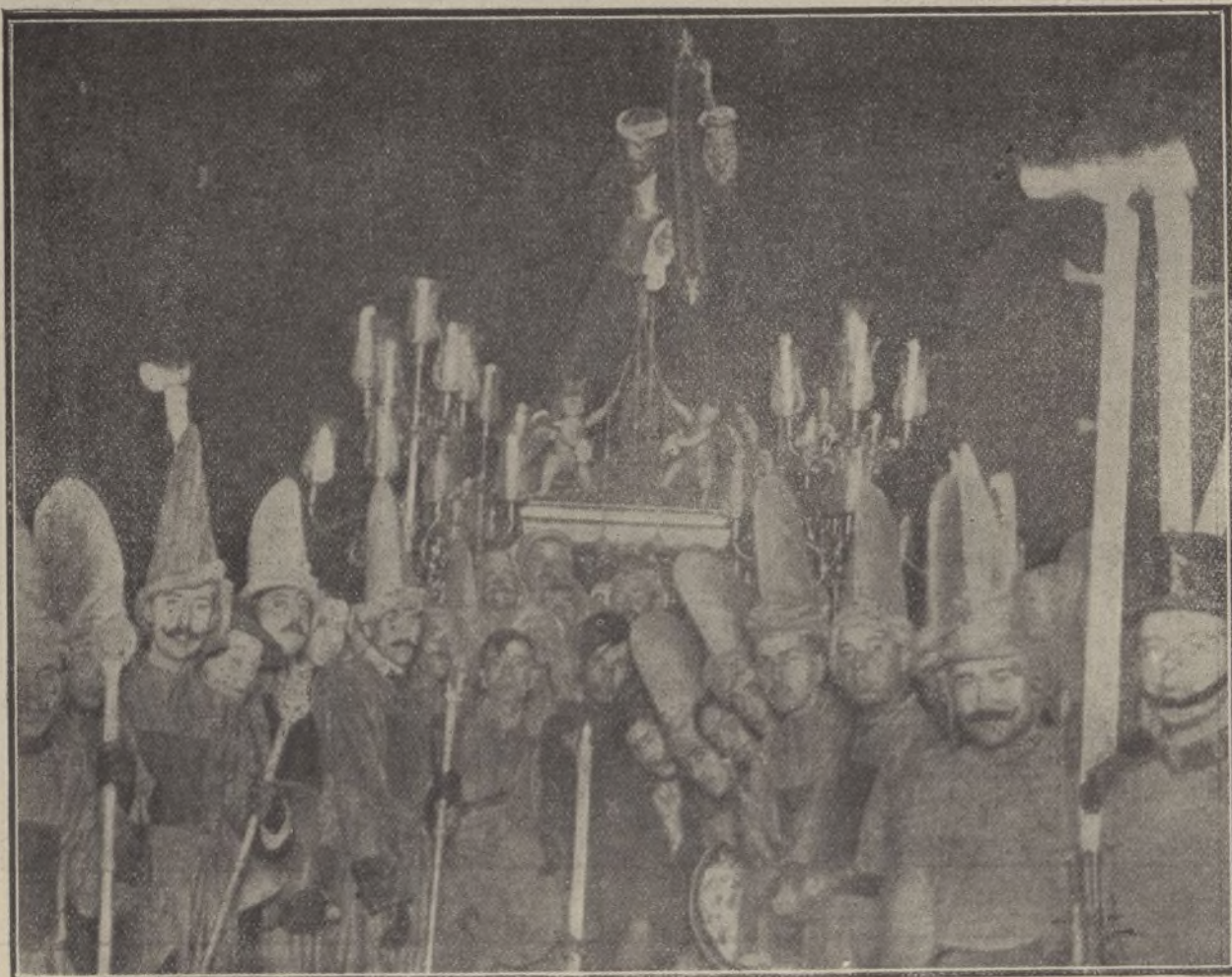
La procesión de Jesús el Rico, de Málaga, en la que figura un preso (X) sacado de la cárcel el día de dicha solemnidad

ENTRE las costumbres típicas que se conservan en algunas capitales las hay realmente humanitarias y curiosas.