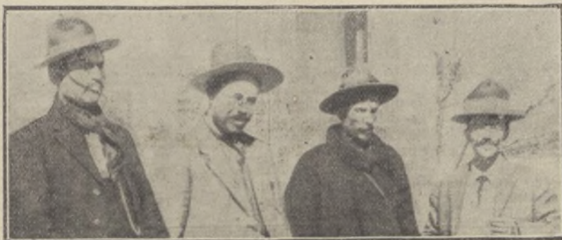
Cuatro jefes revolucionarios, ó sea los bandidos Fierro, Pancho Villa, Ortega y Medina, que tanto se distinguen por su odio feroz á los españoles