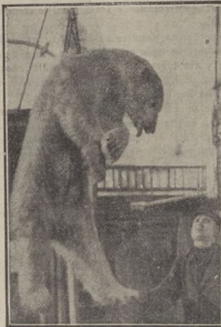
Oso monstruo polar

Es verdaderamente asombroso el trabajo de los albañiles sobre los techos de las casas de Nueva York. Nadie ignora que en la gran ciudad se construyen edificios de 30 y 40 pisos, que alcanzan muchos metros de altura. Véase á esos atre-