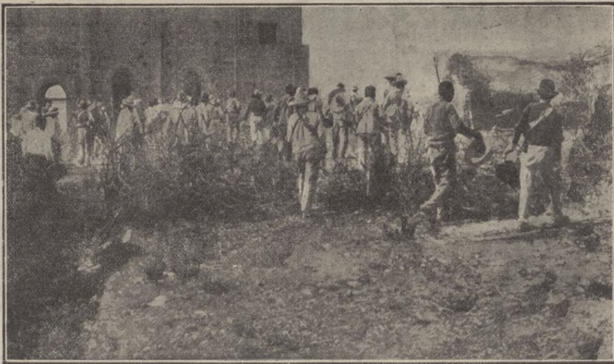
Las hordas de Villa á su entrada triunfal en Torreón, donde quisieron asesinar á los españoles después de haberles robado sus propiedades

lo que ha producido la indignación del Gobierno español y ha motivado su vigorosa protesta ante los Estados Unidos.