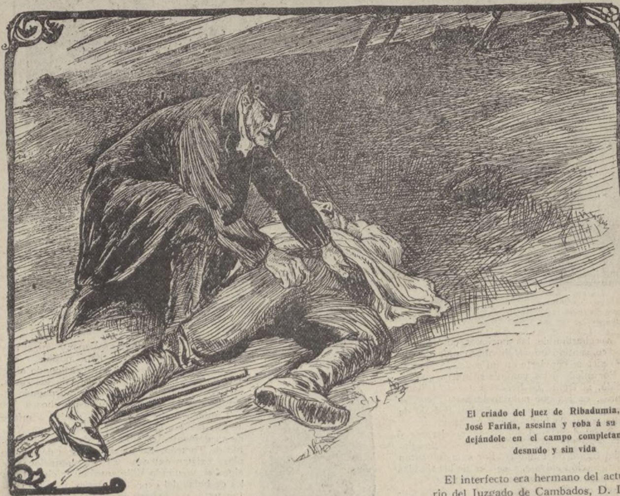
El criado del juez de Ribadumia, don José Fariña, asesina y roba á su amo, dejándole en el campo completamente desnudo y sin vida

El cadáver apareció desnudo, incluso sin calcetines, y presentaba varios golpes en la cabeza y pecho, el cráneo destrozado y cuatro largos cortes en el pecho y vientre, con otro circular y muy grande en la espalda.