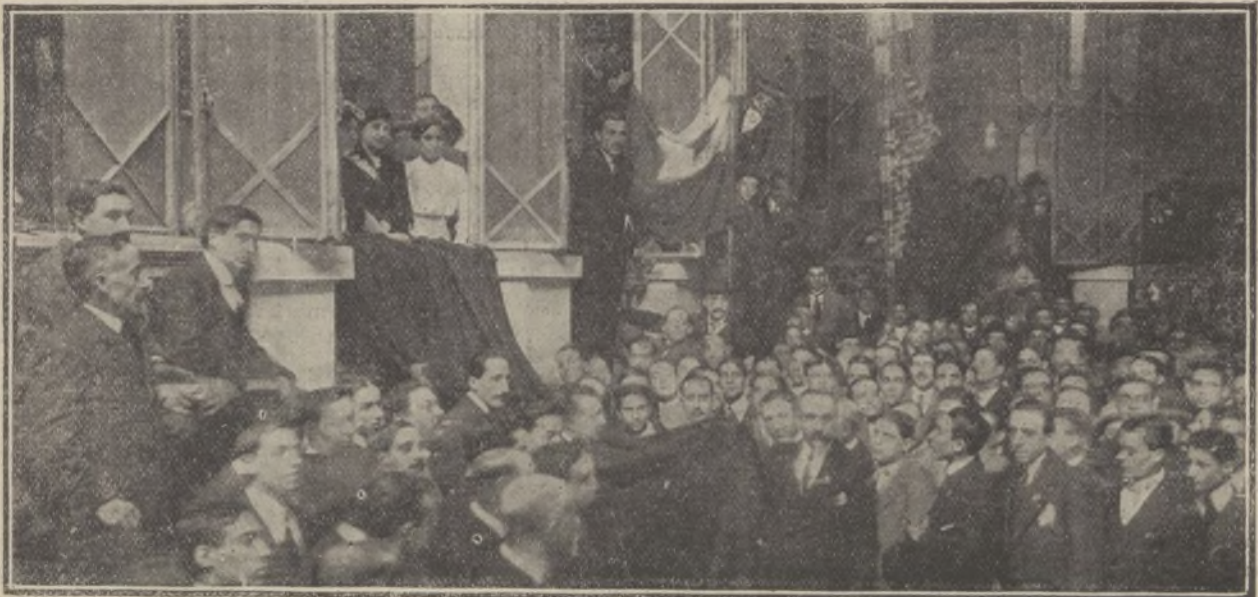
BARCELONA.—Junta de bellas damas catalanas haciendo entrega de la bandera, regalo del Centro Autonomista de Dependientes del Comercio y de la Industria