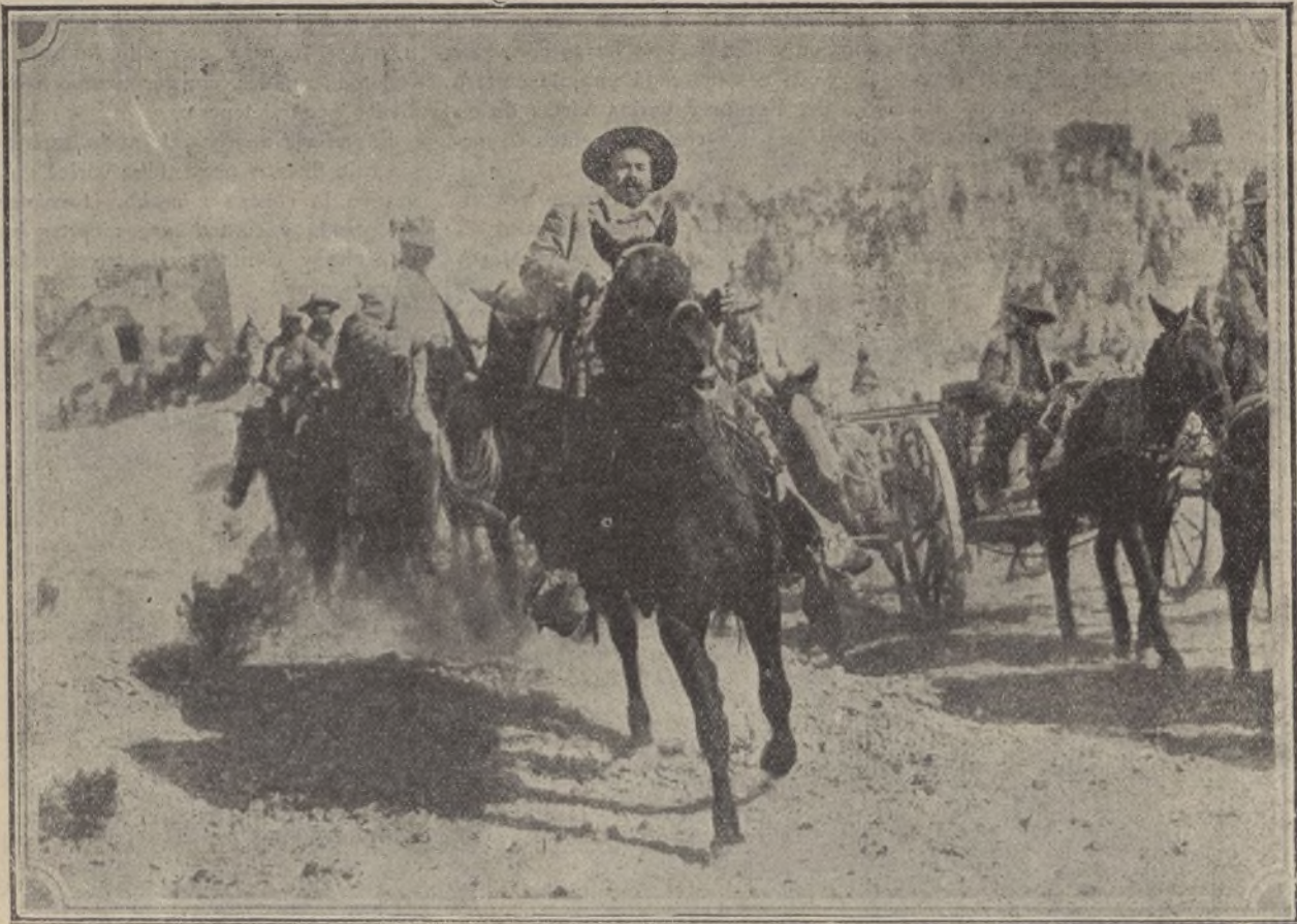
El general Villa galopando al frente de sus tropas en la toma de Torreón

L a cobardía de las naciones europeas ha consentido que el hermoso país de México se convierta en un segundo Marruecos. Por miedo á los yanquis se tolera que un bandido, al frente de hordas astrosas y hambrientas, en las que pululan indios feroces, se entreguen al saqueo y aniquilen el trabajo de muchos años de ingleses y españoles.