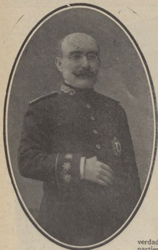
D. Carlos Blanco, jefe superior de Policía

Las derivaciones del debate sobre Marruecos en los pasados días encendió las pasiones, provocando disturbios y tumultos en las calles cercanas al Congreso.