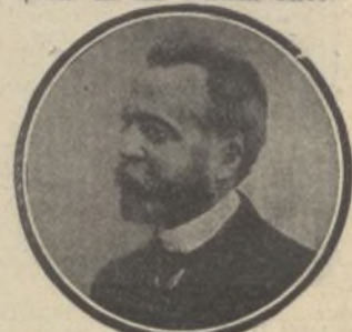
El ministro de la Gobernación Sr. Sánchez Guerra