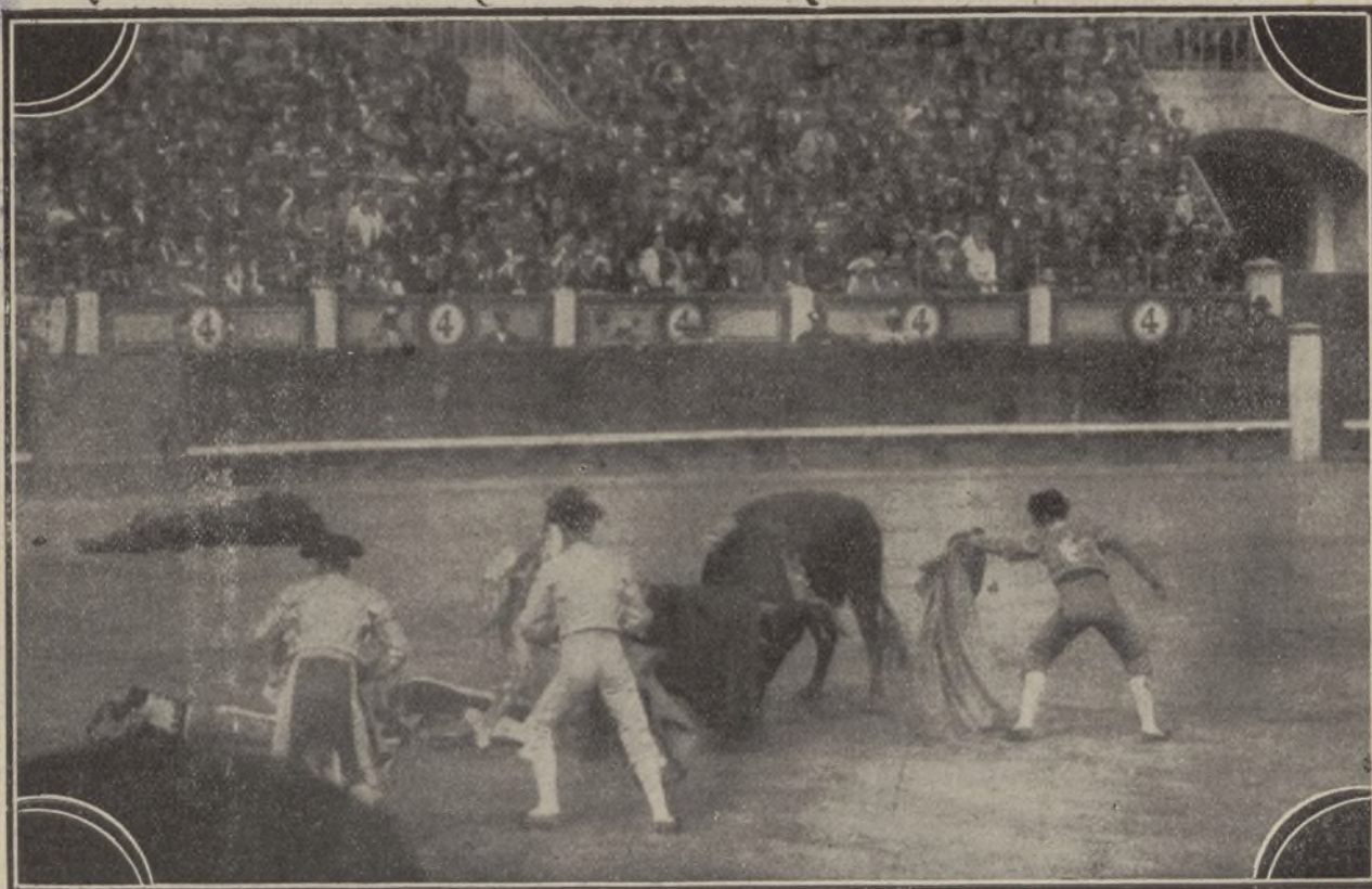
Interesante fotografía de la cogida del banderillero «Magritas».—Los diestros Pastor y Belmonte acudieron oportunamente al quite, evitando que fuese de fatales consecuencias (Fragmento de una película de la casa «Alberia-Cines»)

La corrida de la Prensa es, después de la de Beneficencia, el acontecimiento taurino que despierta más interés.