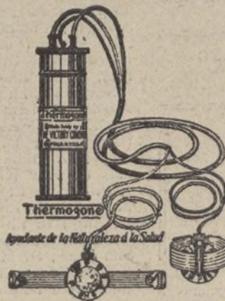
Apoyante de la Rella fuerza á la Salud

Ha conseguido este científico instrumento un triunfo verdaderamente notable con los casos de enfermedades crónicas curadas en breve tiempo, única fórmula verdad de acreditarse un invento como éste, basado en los estudios y práctica del Doctor S. R. Beckwit, de los Estados Unidos de América.