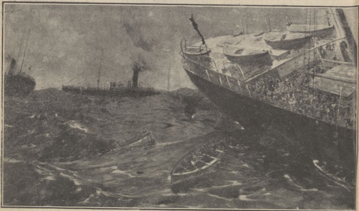
En las tinieblas de la noche, y durante los veinte minutos que el buque estuvo a flote, se produjeron escenas desgarradoras. Dos vapores acudieron al lugar del siniestro, logrando salvar a muchos naufragos

visiones humanas son ineficaces para luchar con la fatalidad. Está confirmado que la catástrofe fué originada por el choque del Empress of Ireland con el barco carbonero Storstad .