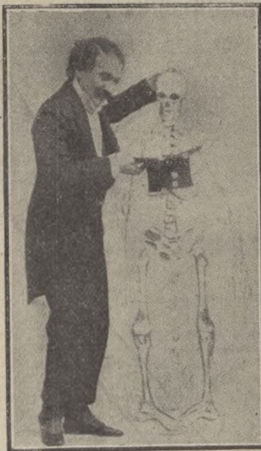
Caricatura que circula mucho en Londres.— El ministro Lloyd George sacando dinero al esqueleto del pueblo inglés

En el Winter Garden, de Berlín, se exhibe al público un nadador que ha ganado el «record» del mundo de resistencia debajo del agua. Para que