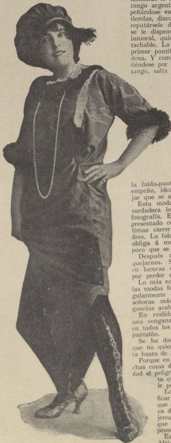
Una señorita con falda de moda, tal como se ha visto en las carreras de caballos en Londres

Tras aquellas ráfagas de sano espiritualismo, volvió París á caer en el aletargamiento de los bailes indígenas y de los machaqueantes y conocidísimos garrotines andaluces cuyo esplendor pasara con la Otero y otras artistas pasionales y febricitantes. El arte retrocedía empujado por las sacudidas tenaces y persistentes del medio ambiente, en descomposición moral. No se dibujaba una esperanza de renovamiento, hasta que de improviso saltó á los tablados é hizo irrupción en los salones de la aristocracia una extraña danza incubada en las apartadas pampas americanas, un nuevo baile que se decía importado por los fieros gauchos argentinos, de costumbres milenarias como las selvas vírgenes de sus montes, no hollados por el hombre moderno. Lo que no lograra Isidora Duncan, mantener y aclimatar el ancestralismo ruso en una de sus manifestaciones más augustamente hermosas, lógralo bien pronto el espíritu indomable de los indios vegetando lejos del mundanal ruido, los que hacen que París entero se revolucione y sacuda su frivolidad para adoptar entusiasmado y fervoroso el baile raro que le entraba puertas adentro. La ciudad se considera vencida y ríndese ceremoniosamente á su exquisita grandeza. A los primeros momentos de incertidumbre y de frío análisis, sucede la fecunda explosión del entusiasmo sin limitacio-