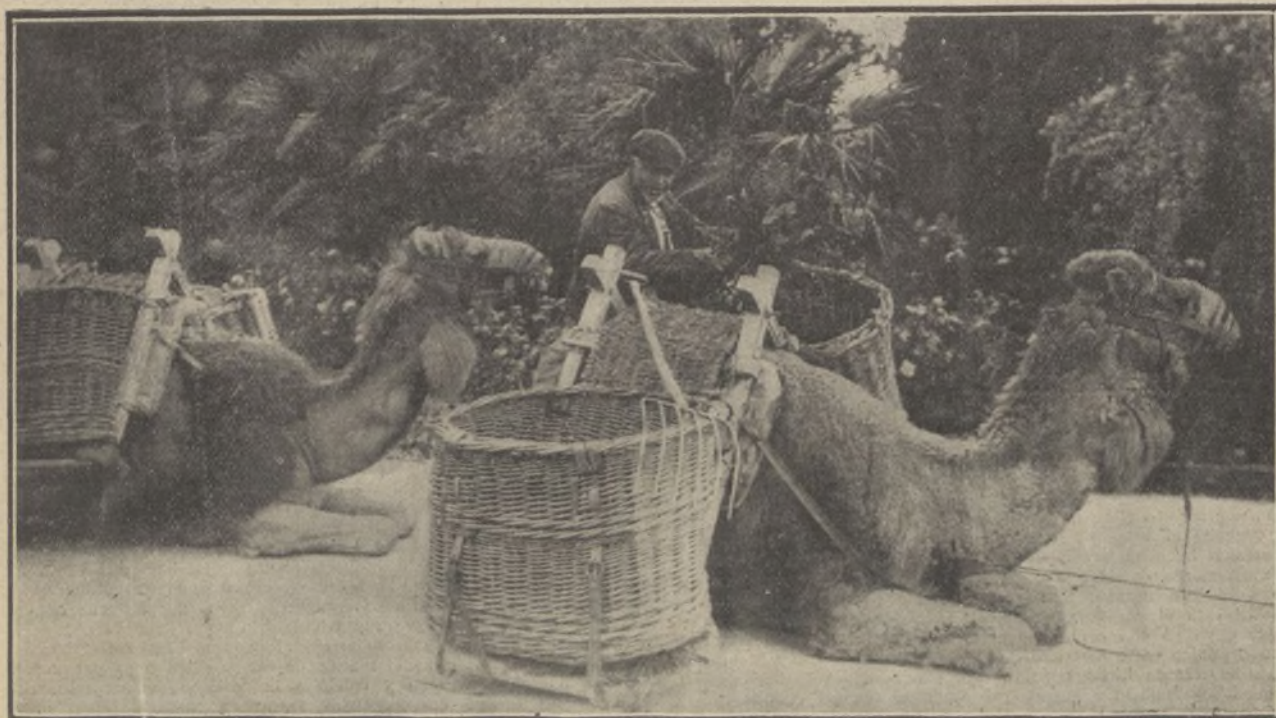
Los camellos de la basura en los jardines de Aranjuez. Estos pacientes Sifio y llaman la atención del público por su aspecto exótico

¿Es acaso una temeridad decir que el perro conserva el recuerdo con la misma fijeza que el hombre? Lo indudable es que en los animales, como en las personas, los hay inteligente.