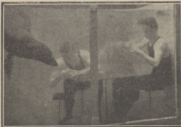
El hombre que ha estado debajo del agua cuatro minutos y cincuenta y seis segundos. Dando de comer un plátano á un pez

El nadador descende debajo del agua con los ojos abiertos; se sienta tranquilamente en el sillón y ofrece al pez un hermoso plátano, que se traga de una dentellada.