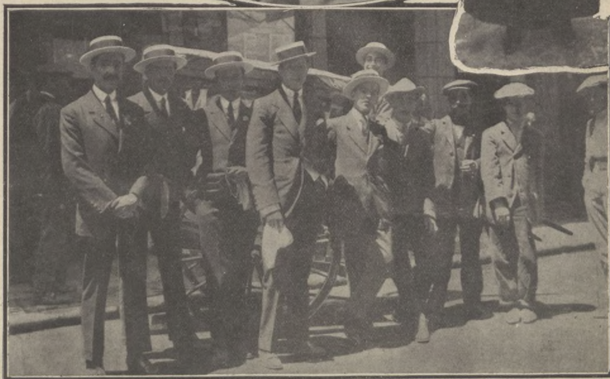
Los reyes D. Alfonso y D. a Victoria, que pasearon en automóvil por las calles repartiendo duros á manos llenas.—Una de las bellas postulantes.—Grupo de estudiantes que tocaban los organillos y dieron á la fiesta de la Flor una nota de alegría popular