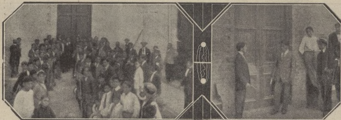
Los estudiantes de un colegio de Lima (Perú), amotinados contra un profesor.—Dos alumnos, revólver en mano, guardando la puerta donde habían encerrado al catedrático enemigo

EN un colegio de Lima (Perú) se ha desarrollado un suceso extraordinario, que, por circunstancias singulares, ha causado honda emoción.