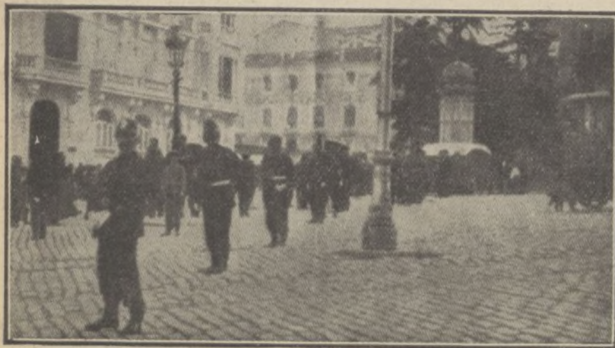
Cordón formado por guardias de seguridad que impedían el acceso al Congreso á las personas no autorizadas

* El cerebro de una mujer disminuye en peso después de los treinta años.