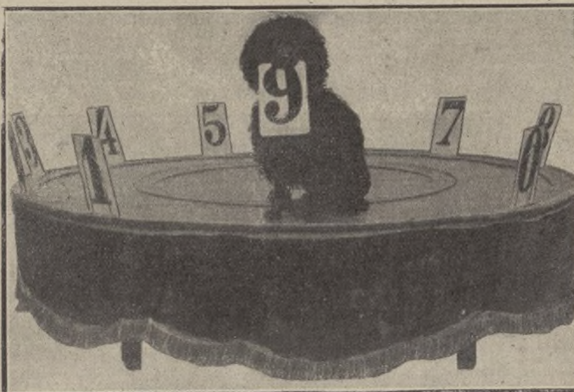
Filax , el perro calculista que sabe todas las operaciones aritméticas

Filax conoce las cuatro reglas fundamentales de la aritmética y distingue todos los números. Lo mismo suma números de una cifra que de varias. Jamás se equivoca en el resultado, y éste lo expresa con prodigioso acierto, reuniendo los números pintados en cartones. Así, por ejemplo, le pregun-