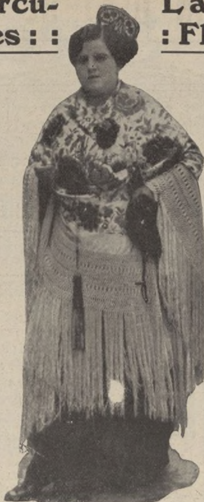
Don Alfonso y doña Victoria pasearon en automóvil, repartiendo dinero á manos llenas y regresando á palacio después del mediodía. Más tarde, cuando el rey salió á

pie para dirigirse á la Casa de Campo, se vió rodeado de muchachas bonitas y comenzó á repartir duros.