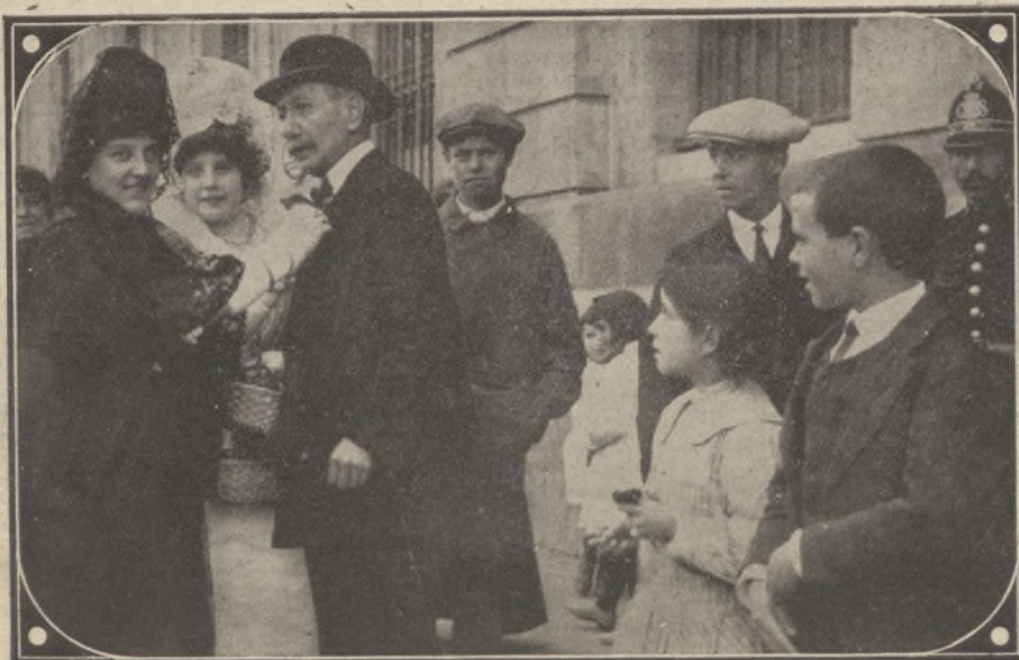
Las más lindas muchachas madrileñas, ataviadas con el mantón y la mantilla clásica, recaudaron muchos miles de pesetas para los tuberculosos pobres

El conductor del tranvía logró parar casi en el acto y la señorita de Ester sólo sufrió el susto consiguiente.