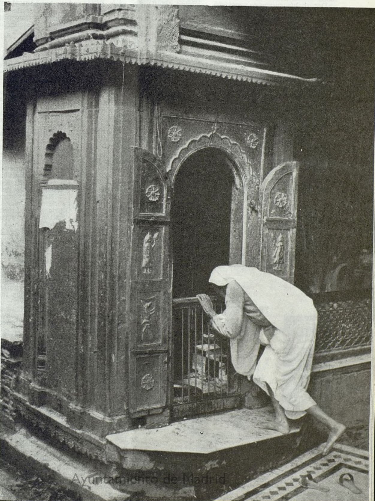
Peregrino hindú haciendo oración y sacrificio en el templo de oro de Benares, India.

mediante la Biblia y otros múltiples escritos, mientras que nosotros los católicos hemos cuidado más las conversiones, instruyendo a los conversos y procurando el máximo arraigo, en pequeños núcleos, de la fe cristiana.