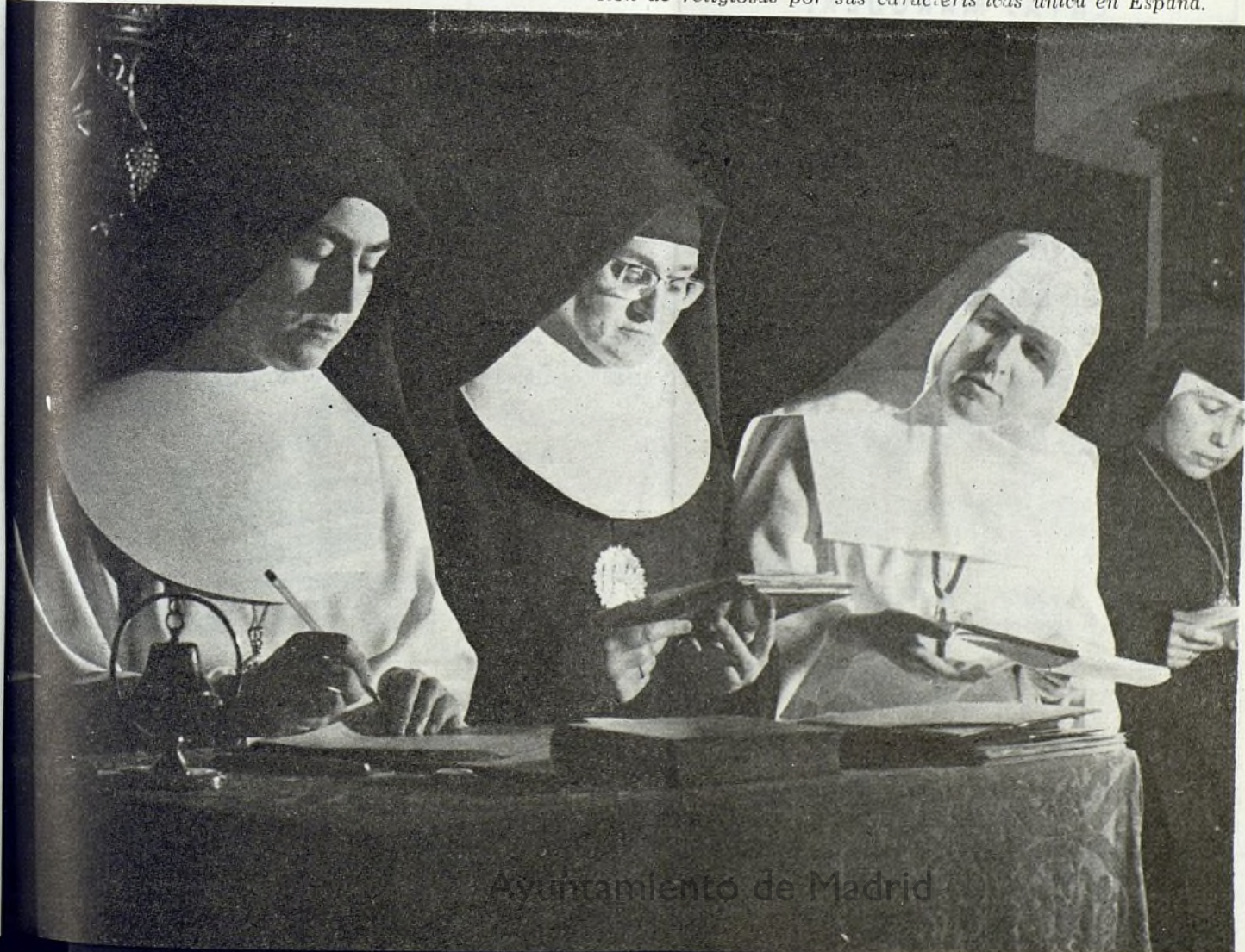
Religiosas trabajando en la sesión Juventudes. En esta concentración de religiosas por sus características única en España.

El Excmo. Sr. Obispo de Vagada, y Superior General del IEME, 2.º Vicepresidente de la Comisión de Misiones del Concilio Vaticano II, que desarrolló el tema: HACIA UNA NUEVA PLANIFICACION MISIONERA DE LA IGLESIA.