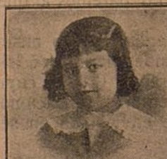
Este retrato se ha estampado delante del público

La casa PHOTO-NOVELTIES, instalada en la calle de Preciados, núm. 16, acaba de presentar al público otra maravilla fotográfica, que rivaliza con el retrato cinematográfico.