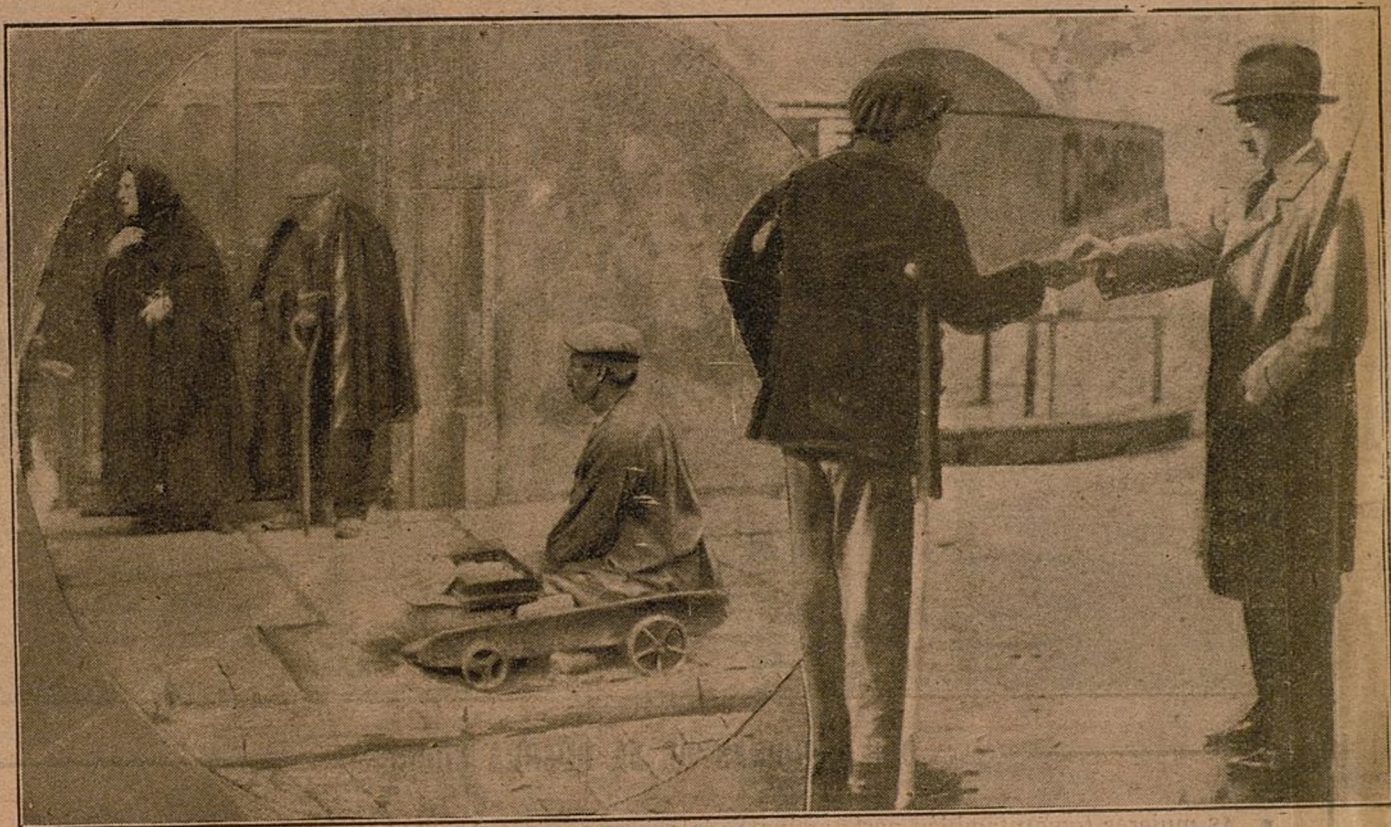
Pobres pidiendo limosna á las puertas de las iglesias, y un mendigo callejero implorando á un transeúnte

N UEVAMENTE se ha planteado el grave problema de la mendicidad en Madrid. Nuestra España es un país pobre, y el remedio radical para extinguir la mendicidad es imposible. Se dice que hay muchos pobres pedigüños de profesión; ¡qué triste profesión! ¿Se concibe trabajo más triste que el de asaltar á todas horas á los transeúntes pidiéndoles una limosna por amor de Dios? La reforma necesaria no es quitar á los pobres de la calle; lo que se