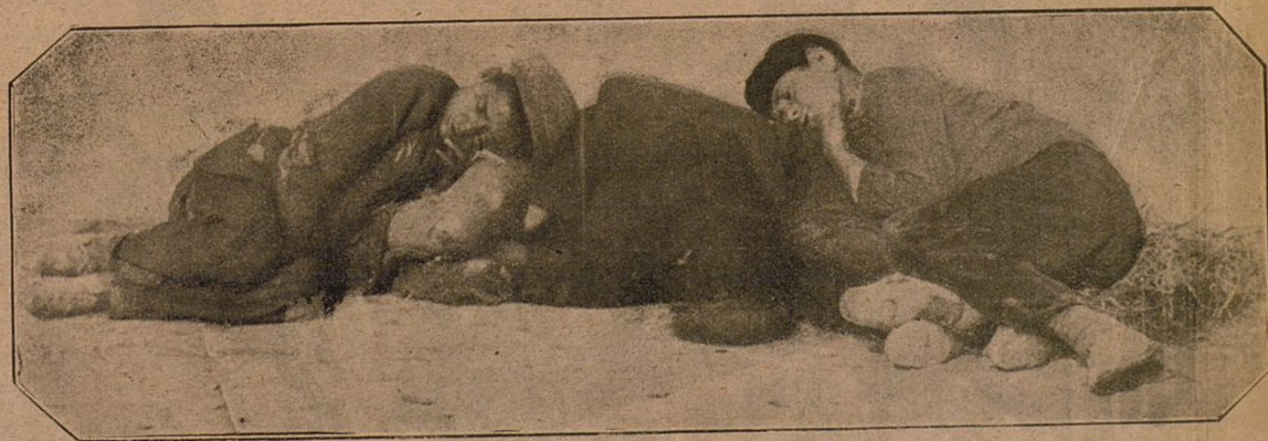
Emocionante grupo de golfos, durmiendo en la calle por no tener hogar.

Y nada de encarcelar, y no sólo asilar, y cuidado con ese echar á provincias á los pobres, pues Madrid es el corazón de España, y nada que sea español es aquí forastero.