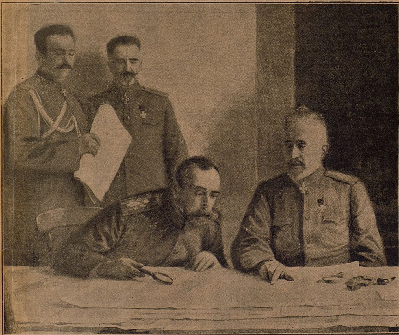
Generales Tianoket y Danilof.

Tomado Lemberg, si el ejército ruso se retira á otras líneas, seguirán los imperios centrales obligados á mantener enormes contingentes en Oriente; pues la mayor debilidad del adversario se verá compensada con la mayor extensión del frente de combate. Y mien-