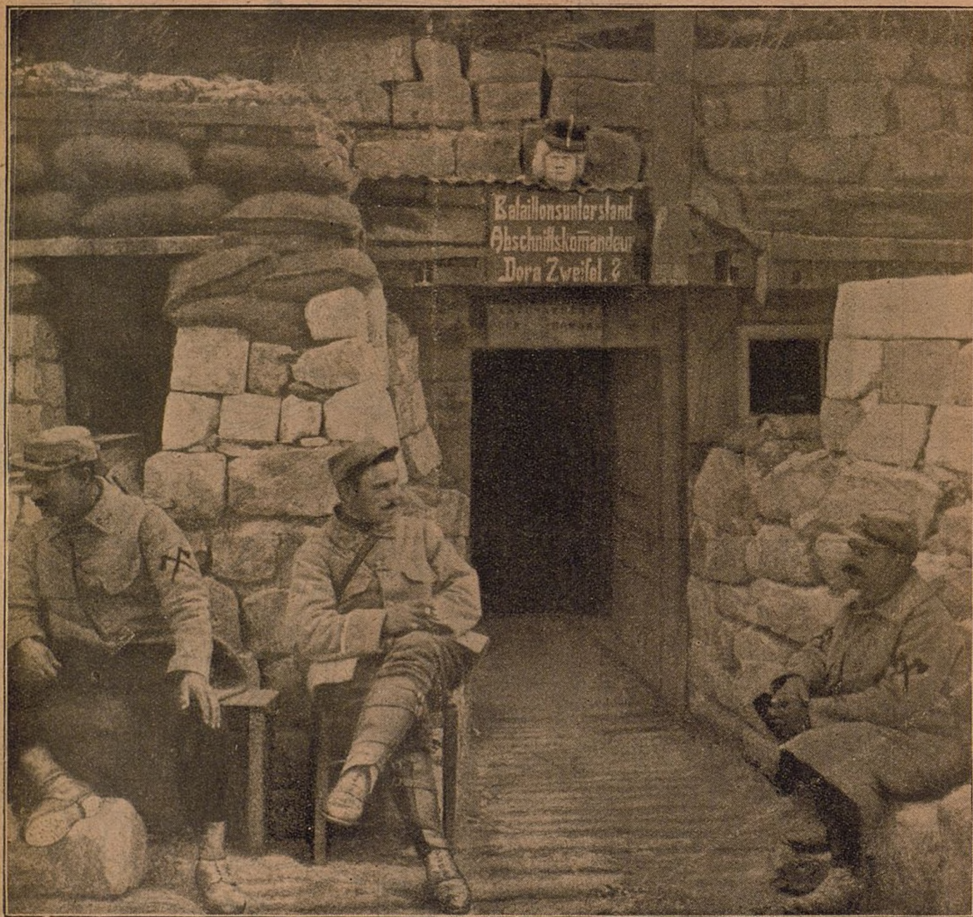
Entrada del misterioso subterráneo.

EN esta fotografía se aprecia claramente el esfuerzo gigantesco que acaban de realizar los franceses apoderándose y destruyendo el famoso laberinto construido por los alemanes. Aparece aquí la entrada de uno de los subterráneos donde se refugiaban los soldados del kaiser.