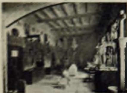
Museo de Sabadell

Leán en este número amplia información de la vida en la ciudad industrial de Sabadell (Barcelona)