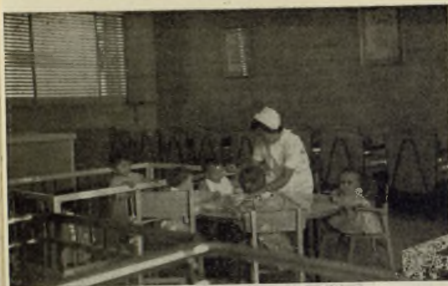
Fotografías de la Guardería infantil de la Caja de Ahorros de Sabadell, obra magnífica