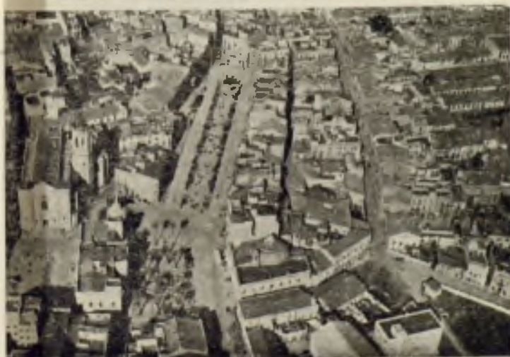
Vista aérea de Sabadell

En el amanecer de un día cualquiera se nos presenta un Sabadell algo gris y monótono. No abundan en verdad los grandes y bellos edificios; sus casas son más bien bajas, de tipo unifamiliar; en muchas calles hay más fábricas que casas y en todas partes se oye el golpear característico de las lanzaderas. Los trabajadores (treinta mil en números redondos) han empezado la tarea y hasta que las sirenas den la señal no volverán a invadirse las calles con el hormigueo humano.