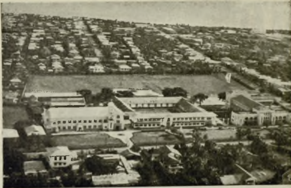
Vista aérea de la Universidad de S. Agustín con el High School recientemente inaugurado

Universidad de Santo Tomás los estudiantes de Medicina de San Agustín, número de 43, pasaron todos el examen previo. Este éxito es digno de notarse, ya que de los 3.000 estudiantes que se presentaron fué reducido el número de los que pudieron pasar.