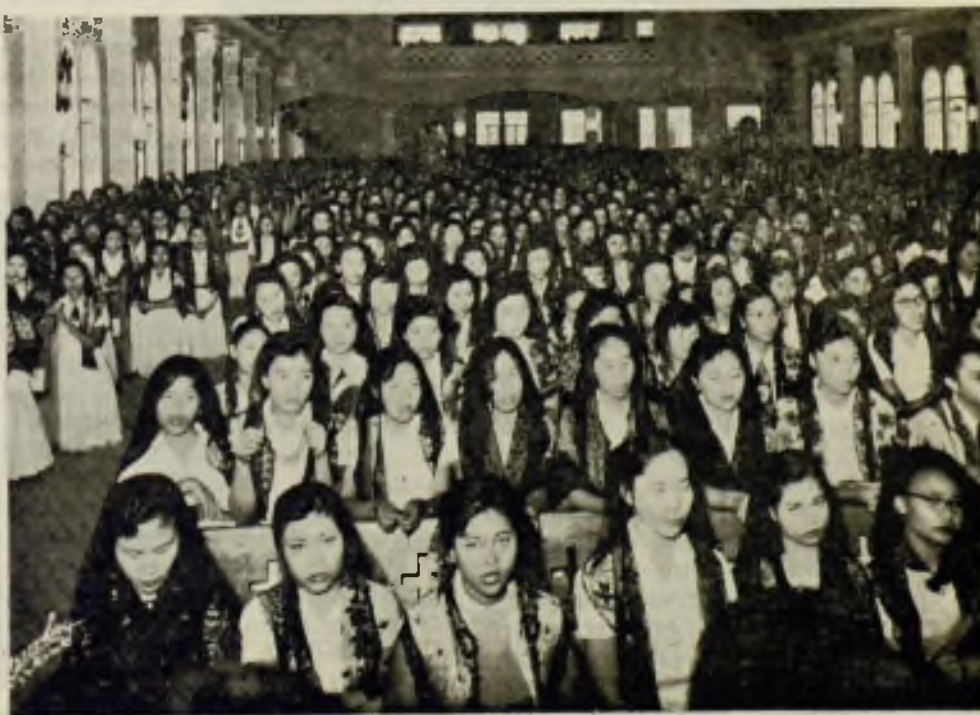
Impresionante aspecto de la Capilla de la Universidad de S. Agustín durante los Santos Ejercicios Espirituales del mes de marzo. Más de 2.000 señoritas de las distintas facultades acudieron a ellos.

Igualmente pasaron el examen de Estado 48 de las jóvenes estudiantes de Farmacia, obteniendo una de ellas el número 13 de toda la nación. Hay que advertir que de las 48 nuevas farmacéuticas 46 pasaron por primera vez el examen del Estado en enero sin