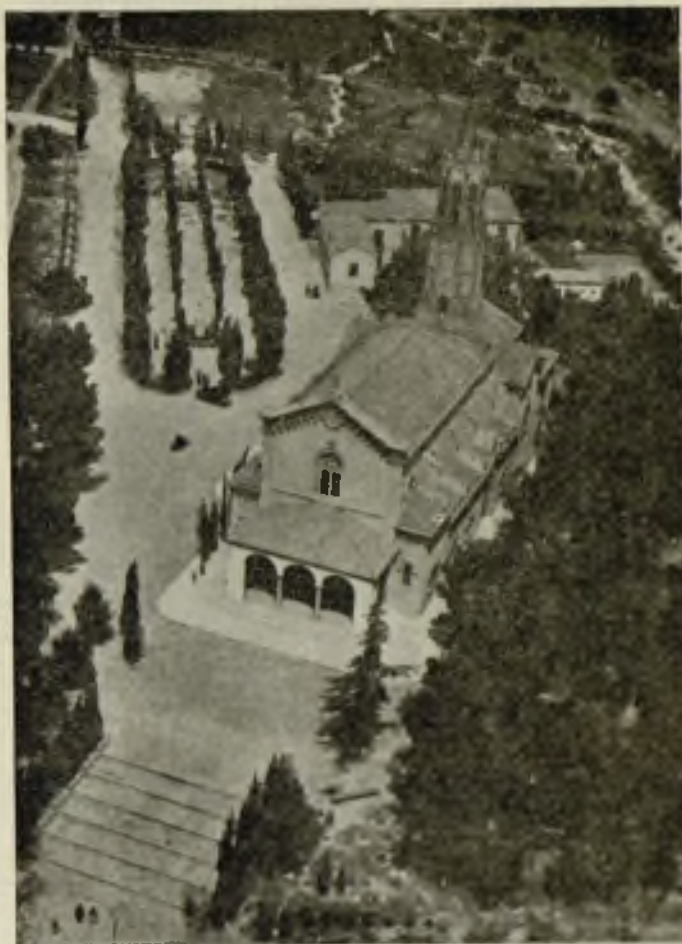
Santuario de la Salud

Esa gran ciudad cuya fama corre ya por las rutas del mundo tiene un nombre: Sabadell. Y he aquí que Sabadell, ciudad surgida sobre la ruta imperial de los Césares, se nos descubre con su ritmo fabril, con su acerico de chimeneas humeantes, con el trepidar de sus máquinas, con el afán de su actividad continua y constante. Sabadell es a primera vista una enorme con-