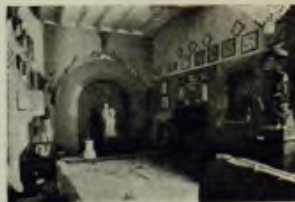
Arqueología e historia

Leán en este número amplia información de la vida en la ciudad industrial de Sabadell (Barcelona)