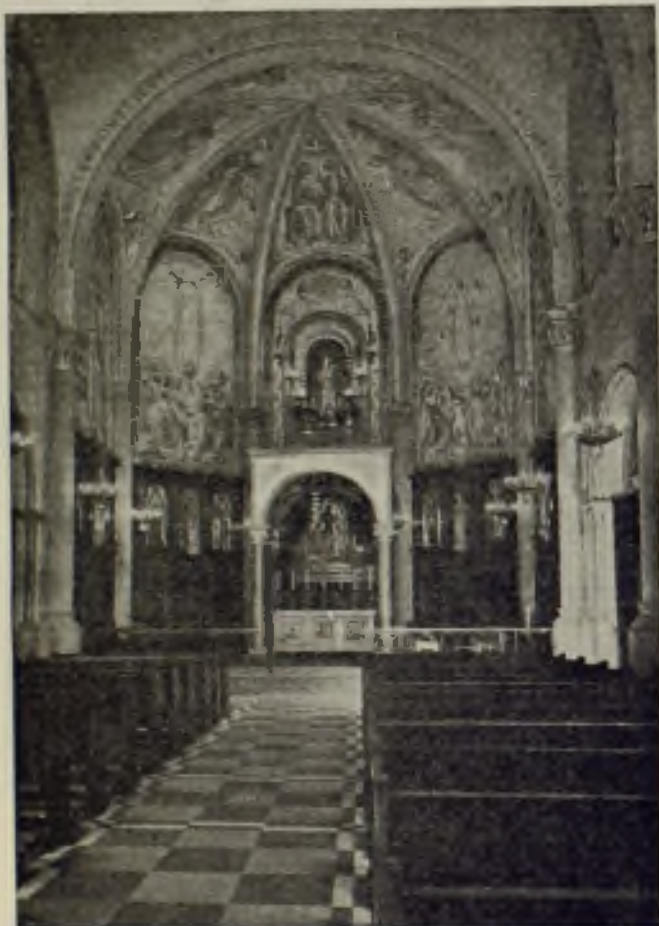
Interior del Santuario de Ntra. Sra. de la Salud

Poco a poco se va haciendo la paz; las familias comen en sus hogares y luego en medio de una apacible calma, los sesenta mil C. V. ponen en marcha de nuevo todo el engranaje mecánico de la urbe.