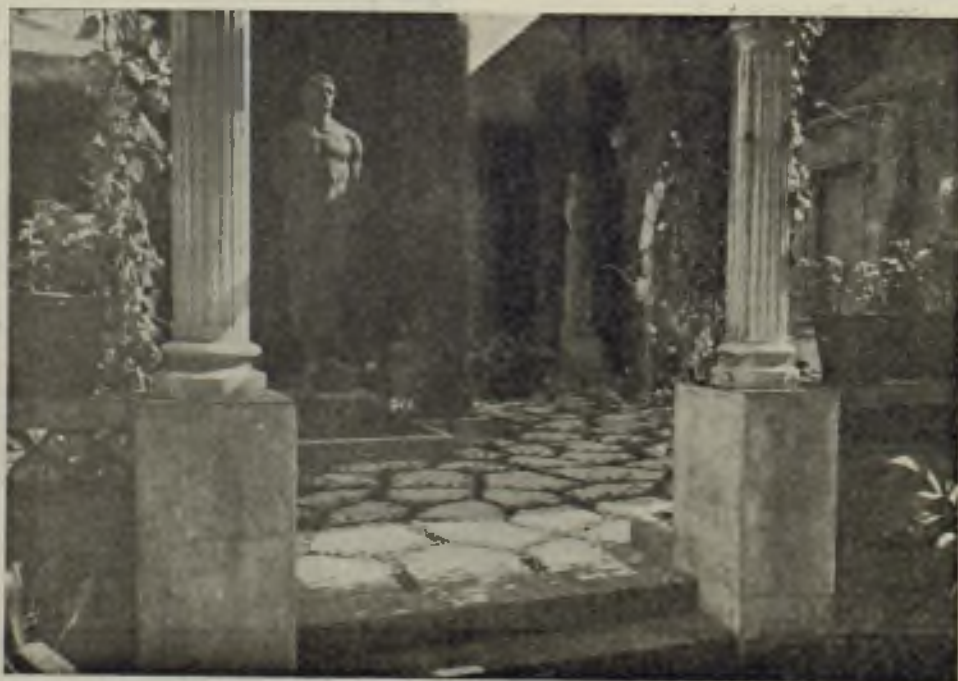
Patio del Museo de Sabadell

Y con ello Sabadell deja de ser la ciudad únicamente fabril, para convertirse en una ciudad total, aunque su modesta apariencia, sus cien chimeneas y sus campanarios recortados sobre Sant Llorenç del Munt y Montserrat parezcan indicar lo contrario.