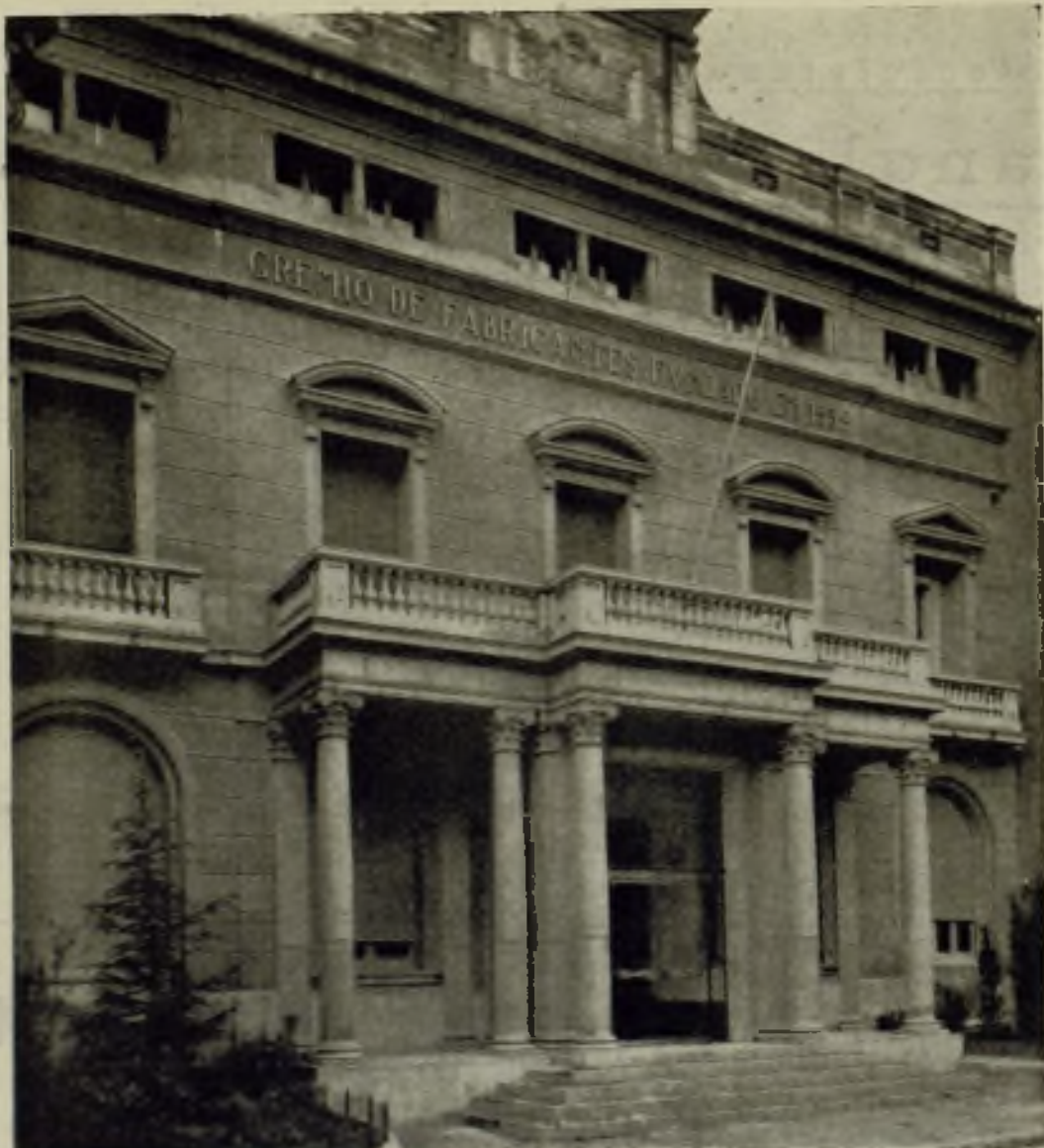
Edificio del Gremio de Fabricantes de Sabadell