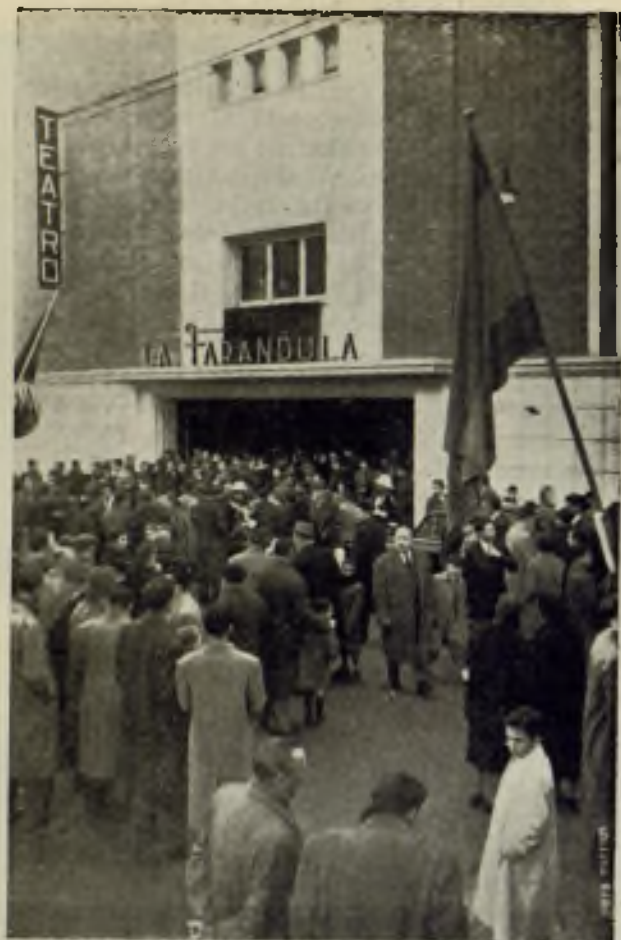
Fachada del teatro en el día de su inauguración