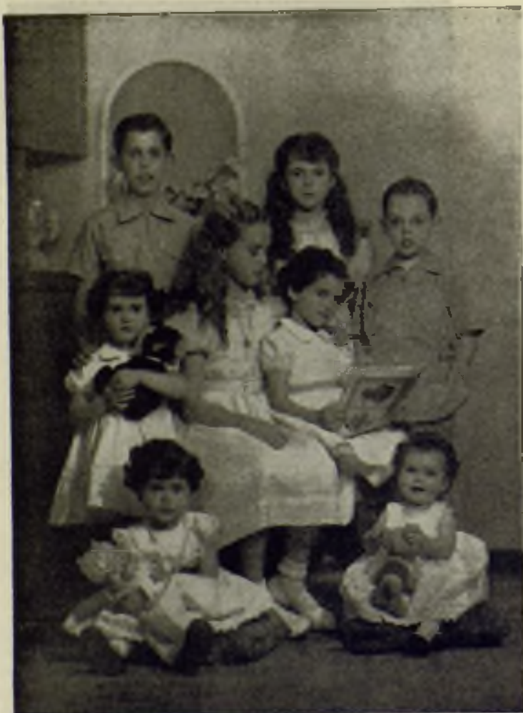
Mis ocho hijos con la correspondencia misional se emocionan. Solamente leen libros y revistas misionales y también hacen sus ahorros para las MISIONES.