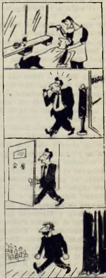
Del teatro de la vida a la vida del teatro