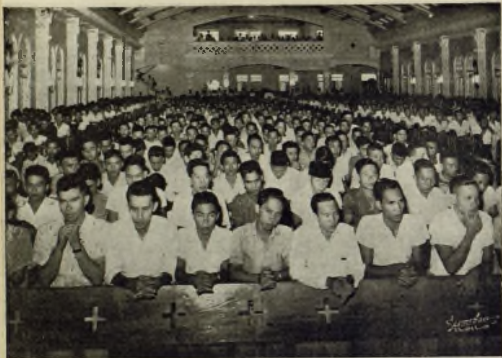
Aspecto general de la Capilla de la Universidad de S. Agustín durante los Ejercicios espirituales tenidos en marzo de 1956. Mas de 2.000 jóvenes de las distintas facultades asistieron a ellos.

registrarse una sola baja, cuando de las otras Universidades no escasearon.