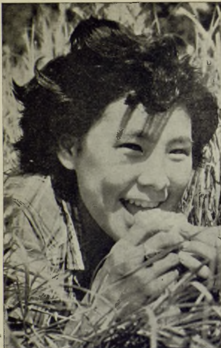
NUESTRA PORTADA. — Esta muchacha, ya católica, de la Misión de Santa Cruz, en Alaska, sorprendida al comer una naranja que le han regalado y que, por lo visto, no le desagrade. ¡Es una fruta que ha venido de tan lejos!...

La suscripción del año 1957 (48 ptas.) será cobrada a domicilio mediante letras bancarias.