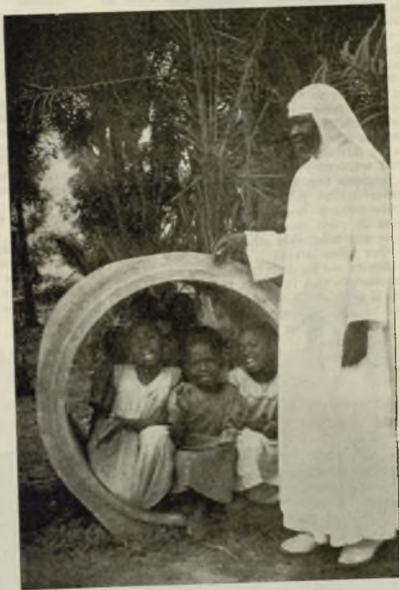
Refugio improvisado en Bandalungwa (Léopoldville).

¿Quién dijo, hace poco que las Misioneras no saben adaptarse a los tiempos?