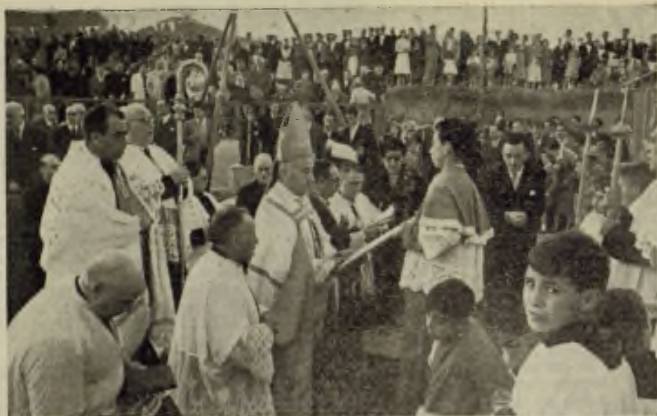
El Arzobispo-obispo, Doctor Modrejo, bendice la primera piedra del futuro templo parroquial de Nuestra Señora de la Salud.

las murallas, y en las interesantes termas recientemente exhumadas en las proximidades del antiguo templo parroquial de Santa María y sobre las cuales se está edificando el futuro Museo de la Ciudad.