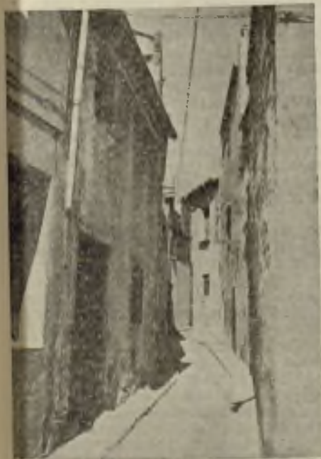
Una de las viejas calles de la vieja Badalona...

Posteriormente, con la invasión romana, aparece en la historia aquella Bétulo que citan Plinio, Me'la y Ptolomeo como una de las más importantes poblaciones de la Layetania. El esplendor de la civilización de la Bétulo romana se refleja en los artísticos mosaicos, en las esculturas, en la cerámica, en las vías de alcantarilla, en