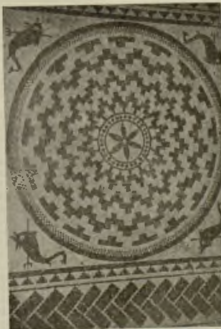
Bellos mosaicos evidencian el esplendor de Badalona Romana.