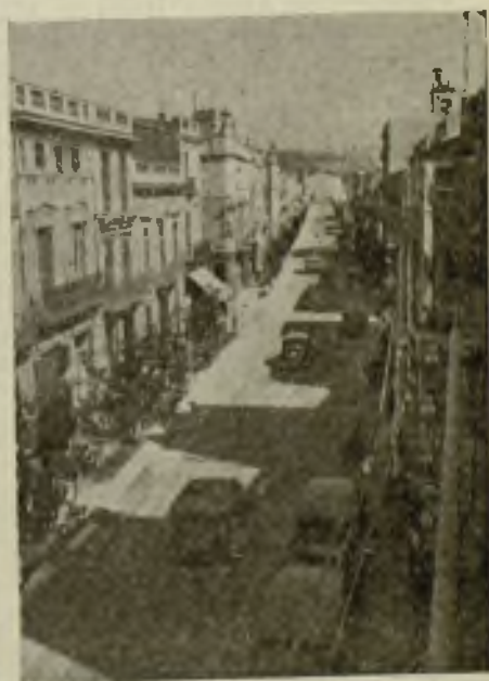
Las arterias del centro de la población, anchas y rientes.