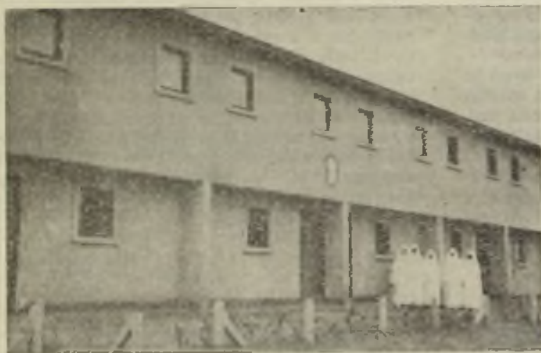
El bloque 341, convento «Regina Mundi»

No estamos al fin de nuestra admiración y extrañeza. Llamamos