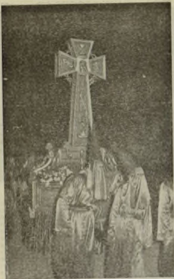
Silente y devota discurre la Procesión.