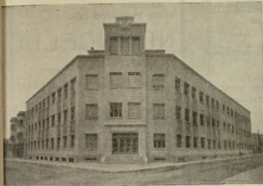
Vista del edificio.