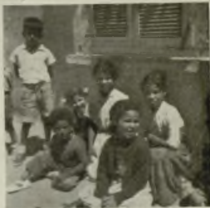
Varios moritos alumnos de la escuela de la Inmaculada de Beni-Malzada.

—Hice más preguntas sobre la historieta y cuando entendieron bien que la idea principal de la misma estaba fundada en el Séptimo Manda-