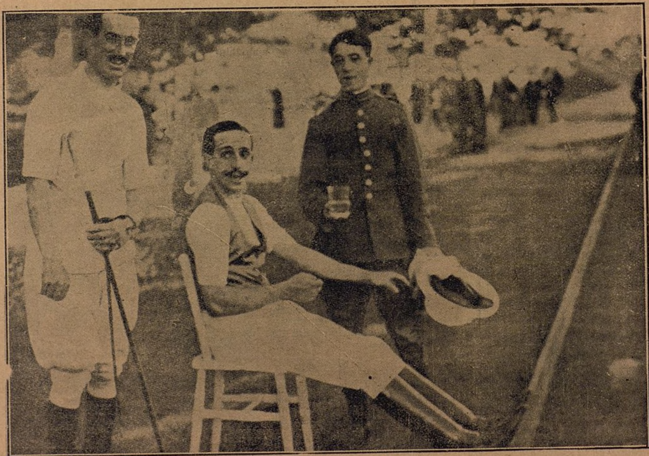
El Rey D. Alfonso XIII durante su estancia en Santander, jugando al polo en el Palacio de la Magdalena. El monarca español es el paño de lágrimas de todos los extranjeros y á él acuden las madres y esposas de los soldados prisioneros, lo mismo franceses que alemanes y rusos.