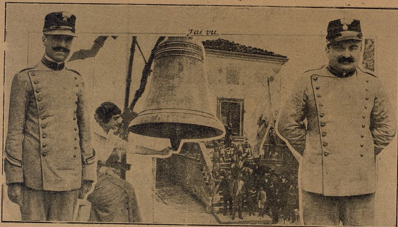
La pequeña República independiente de San Marino ha declarado la guerra á Austria, enviando 27 soldados á reunirse con las tropas italianas.—En estas fotografías se ve el Ayuntamiento; una señorita llamando con campana á la movilización, y los dos únicos soldados que quedan para guardar el orden interior.

UNA nación muy chica, el país más pequeño del mundo, ó sea la República de San Marino, está comprometida en la mayor guerra del mundo. La República independiente de San Marino se halla enclavada en el reino de Italia, cuenta un total de 10.000 habitantes, y constituye, por su situación, un lugar adecuado para que los aeroplanos austriacos pudieran aprovisionarse.