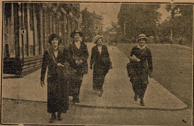
Las mujeres inglesas que, por falta de carteros, hacen el reparto de la correspondencia en los pueblos.