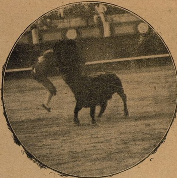
La emocionante cogida del valiente Fortuna.

Desgraciadamente, el amigo acertó. Las entradas iban impresas en un papel anaranjado, cuyo empleo, según una curiosa y rara observación del