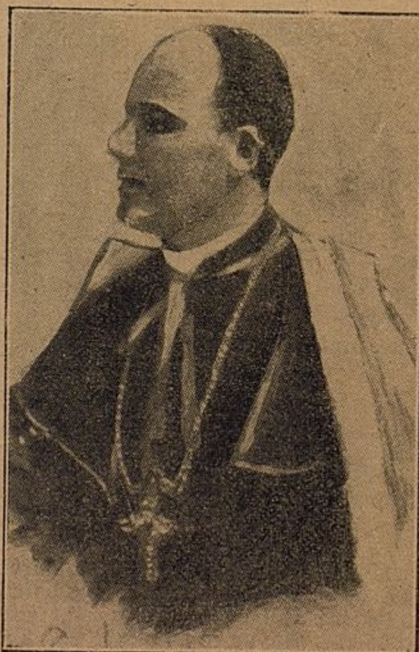
El cardenal Vannutelli, fallecido la semana última.

Monseñor Serafin Vannutelli, que actualmente era decano del Sacro Colegio, nació en Genazzano el 26 de noviembre de 1834. Entró muy joven en el Semina-