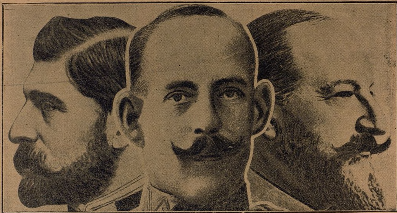
De izquierda á derecha, el Rey Fernando de Rumania, Constantino de Grecia y Fernando de Bulgaria.— Estos tres Reyes de los Balkanes, son hoy los niños mimados de la diplomacia, y su ayuda en la guerra se la disputan lo mismo los aliados que los imperios centrales.