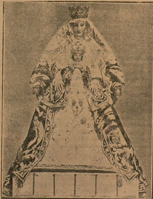
Nuestra Señora de los Reyes, patrona de Sevilla, que con gran solemnidad ha salido procesionalmente este año.

dijérase que oculta su dolor escondiéndose en las tinieblas. No queremos decir que los londinenses marchan á tientas por las calles, sino que la iluminación actual, comparada con la de tiempos normales, es escasa. Sin embargo, los poderosos reflectores instalados en distintos puntos de la inmensa Babilonia, cual pacientes vigilantes en espera de zeppelines, dan, con sus ráfagas luminosas, cierto aspecto fantástico á la ciudad que inspirará tantas de las obras de Dickens.