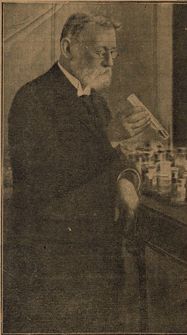
Pablo Ehrlich, sabio médico alemán, inventor del 606, que acaba de fallecer.

Las últimas noticias parecen revelar que el Peña Castillo se hundió en el choque con otro barco, en el mar del Norte.