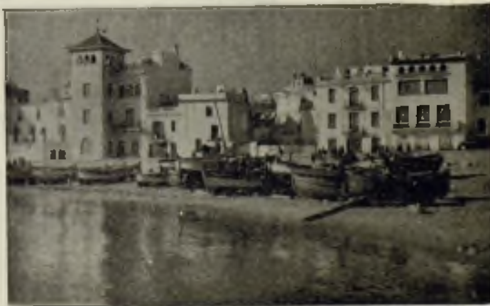
Paseo y barcas de Sitges

En 1934, la Junta de Museos decidió habilitar parte del edificio llamado Maricel para albergar colecciones complementarias de las del Cau Ferrat. Maricel fué construido en 1910, bajo la dirección artística de Miguel Utrillo, reformando totalmente el edificio del antiguo hospital de Sitges, enriqueciéndole con ventanas y otros elementos arquitectónicos antiguos procedentes de toda España, y algunos capiteles y ménsulas modernos labrados por el escul-