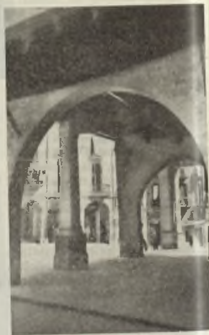
Detalle de la Plaza Mayor