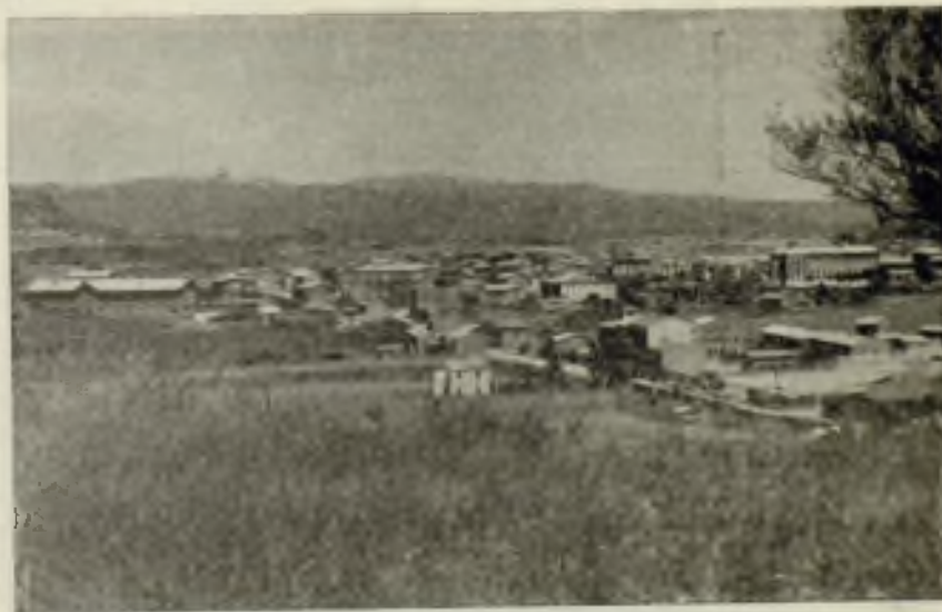
Vista panorámica desde el Sur-Oeste

En la mayoría de las familias de la ciudad se reza el Santo Rosario. Y en su extensa y rica