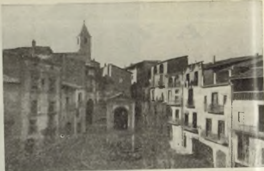
Plaza de San Juan

Y en cuanto a la devoción a la Virgen es sabido que Solsona es inseparable de su amante patrona, la Santísima Virgen del Claustro, cuyo santuario es un verdadero y cálido hogar colectivo, donde la Madre recibe y mimma a sus hijos y donde éstos le manifiestan su cariño y la colman de obsequios. La última expresión colectiva del entusiasmo que sienten los hijos de Solsona por la Virgen del Claustro, se ha manifestado de una manera equivocada, extraordinaria y triunfal, con motivo de su coronación