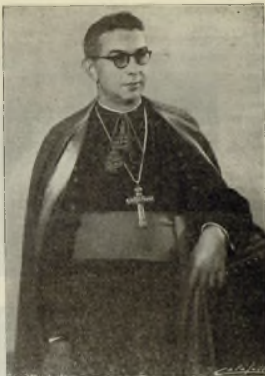
Excmo y Rdmo. Sr Dr D. Vicente Enrique Tar- rancón, Obispo de Solsona

les de Europa y América. Y a las órdenes religiosas citadas ha sucedido la Congregación de los Padres Misioneros, Hijos del Corazón de María, establecidos en esta ciudad desde mediados del siglo pasado, con su Colegio de Filosofía y sus múltiples actividades culturales y apostólicas.