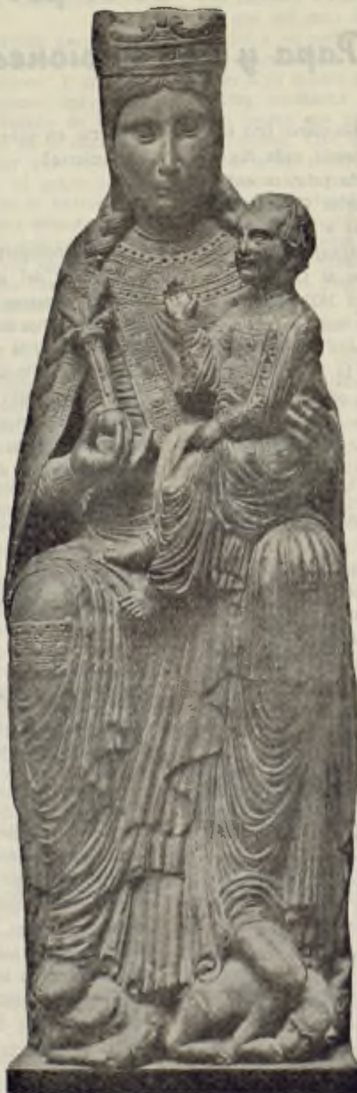
Virgen del Claustro, Patrona de la Ciudad

Desde que la Santa Sede, a instancias de Felipe II, creó la diócesis de Solsona como un nuevo baluarte enclavado en la frontera para impedir el avance de la herejía protestante hacia las tierras hispánicas, los obispos han mimado la vida religiosa de la ciudad, que, a pesar de su pequeñez, ha sabido mantener el prestigio de su capitalidad y ha llevado victoriosamente el peso de una diócesis cargada de piedad sincera y fecunda.