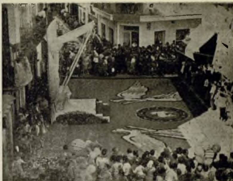
Alfombra de flores a los pies del altar. Esta alfombra corresponde al Fomento de Turismo.

Breve información de la bella población catalana que alfombra sus calles con flores para el paso de la Procesión del Corpus Christi.