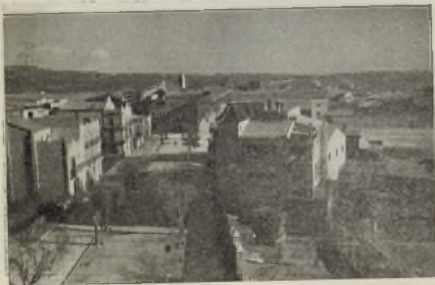
Paseo de San A. M.ª Claret