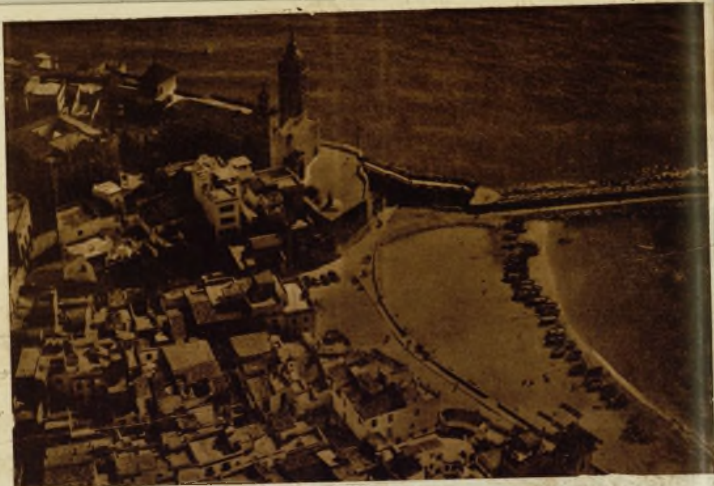
Vista aérea de Sitges