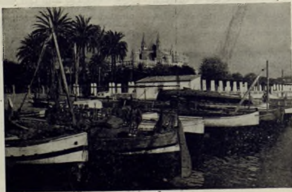
Bella vista de la playa de Mallorca

a. -- A las 6, Magna Procesión final eucarística, con asistencia de las Autoridades, Representantes de las Parroquias de Mallorca con sus Párrocos o Rectores, Comunidades de Religiosos, Escolanías y Asociaciones de hombres. El Itinerario fué el siguiente: General Goded, Conquistador, Generalísimo Franco y Plaza de Pío XII. A su llegada, breve parlamento del Ilmo. Sr. Alcalde de Palma, terminando con la Consagración de la Diócesis y bendición con el Santísimo.