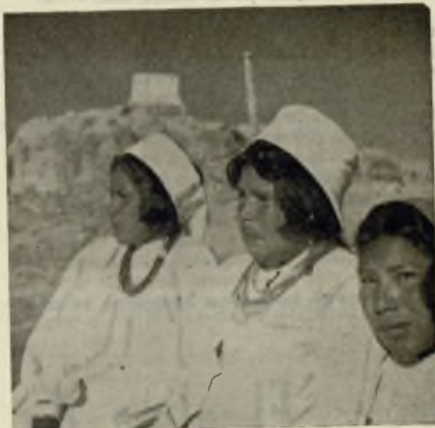
Tipos de indios tarahumares de los que hablamos en nuestro pasado número: «Fuego en las montañas», del P. Fenoll

de Chajul y en una hallaron a una india con una hietura de pecho; la india huyó y dejó a la criatura, vino corriendo al pueblo y se pusieron los indios en armas, llegaron a la milpa que distaba pocas leguas del pueblo, pero cuando llegaron los indios habían huído y hallaron que la criatura la habían sacrificado abriéndole el pecho...»