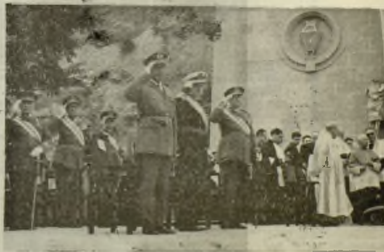
Autoridades y Jerarquías en la Presidencia de los Actos