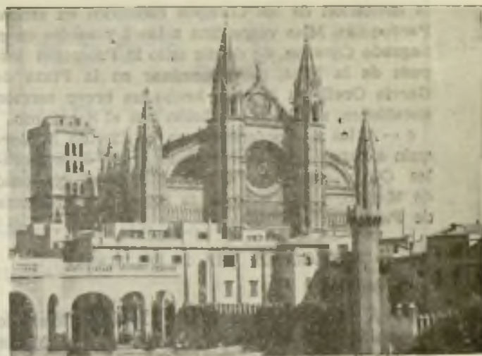
La Catedral de Mallorca

b. — A las 9, en la Catedral, Misa de Comunión de los niños y niñas de las Escuelas Primarias. Los niños y niñas que habían hecho este año la Primera Comunión, asistieron con sus trajes de fiesta y ocuparon lugar preferente.