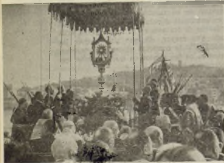
La Sagrada Hostia, protectora del católico pueblo de Mallorca

b. — Turnos de vela al Santísimo, que se continuaron todo el día, en las Iglesias de Padres Mercedarios, de MM. Reparadoras, del Centro Eucarístico y de Adoratrices, organizados con los miembros de uno y otro sexo de las diferentes Asociaciones Eucarísticas: Sacerdotes Adoradores,