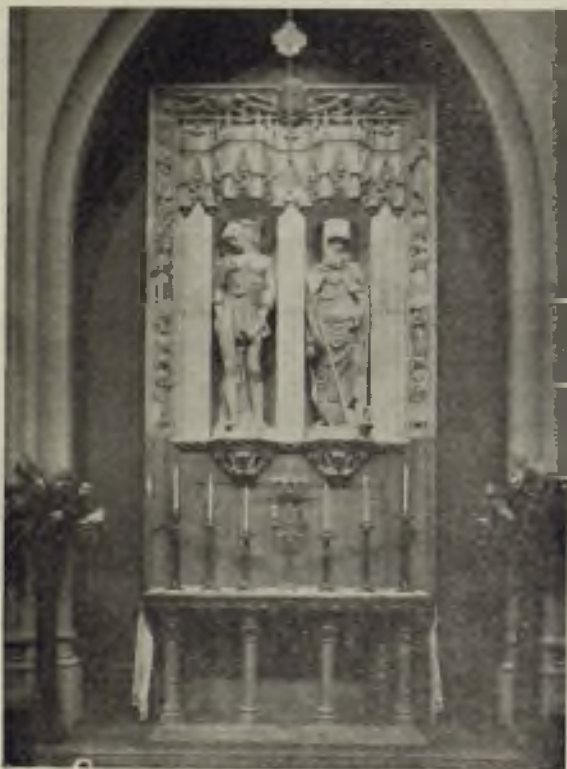
Altar del Gremio de Fabricantes en la Iglesia Arciprestal de S. Félix.