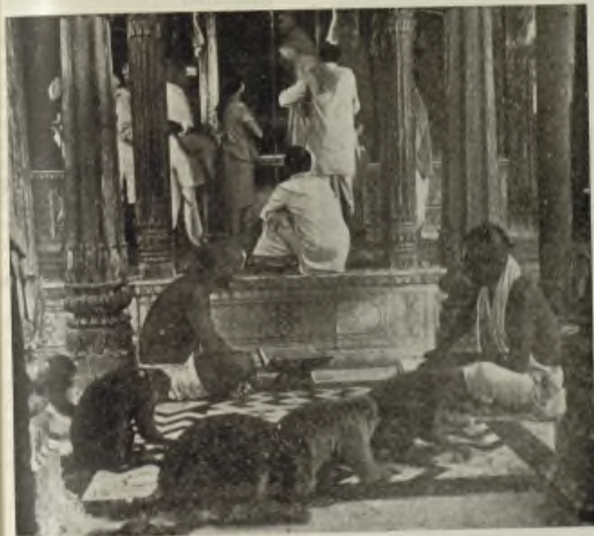
Monos sagrados que se ven en el templo indio dedicado al dios Hanuman. Según el Ramayana este dios de aspecto simio ayudó a Rama a liberar a Sita del demonio Ravana

Media anual de defunciones: 27 por mil habitantes.