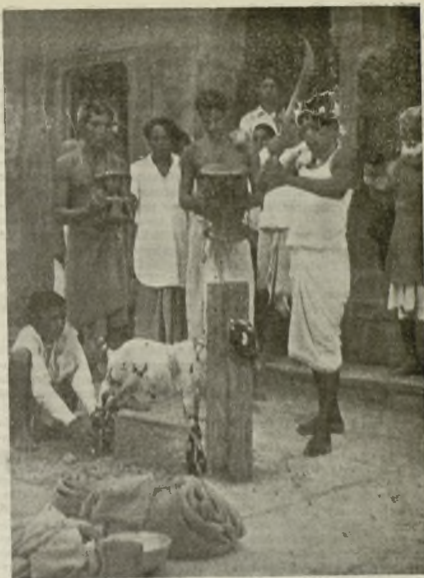
Víctima en honor del dios Kali. Apenas rueda por el suelo la cabeza de esta cabra que un sacerdote se apresta a decapitar de un solo golpe de su espada curva, sonarán los tambores en honor de la diosa.

La religión fundamental de la India es el hinduismo con una doctrina muy original para los occidentales. Los dos pilares de la ortodoxia brahmánica, son, según Olivier Lacombe, «el dogma de la transmigración, según el cual, toda vida temporal constituye un estado de servidumbre espiritual, regido por la ley del acto (karma), del renacimiento y de la muerte indefinidamente repetida, y el dogma de la liberación, según el cual existen caminos y métodos liberadores, susceptibles de libertarnos de la esclavitud transmigratoria y de establecernos definitivamente en un estado de libertad espiritual». El concepto de la divinidad en el hinduismo es más bien de signo