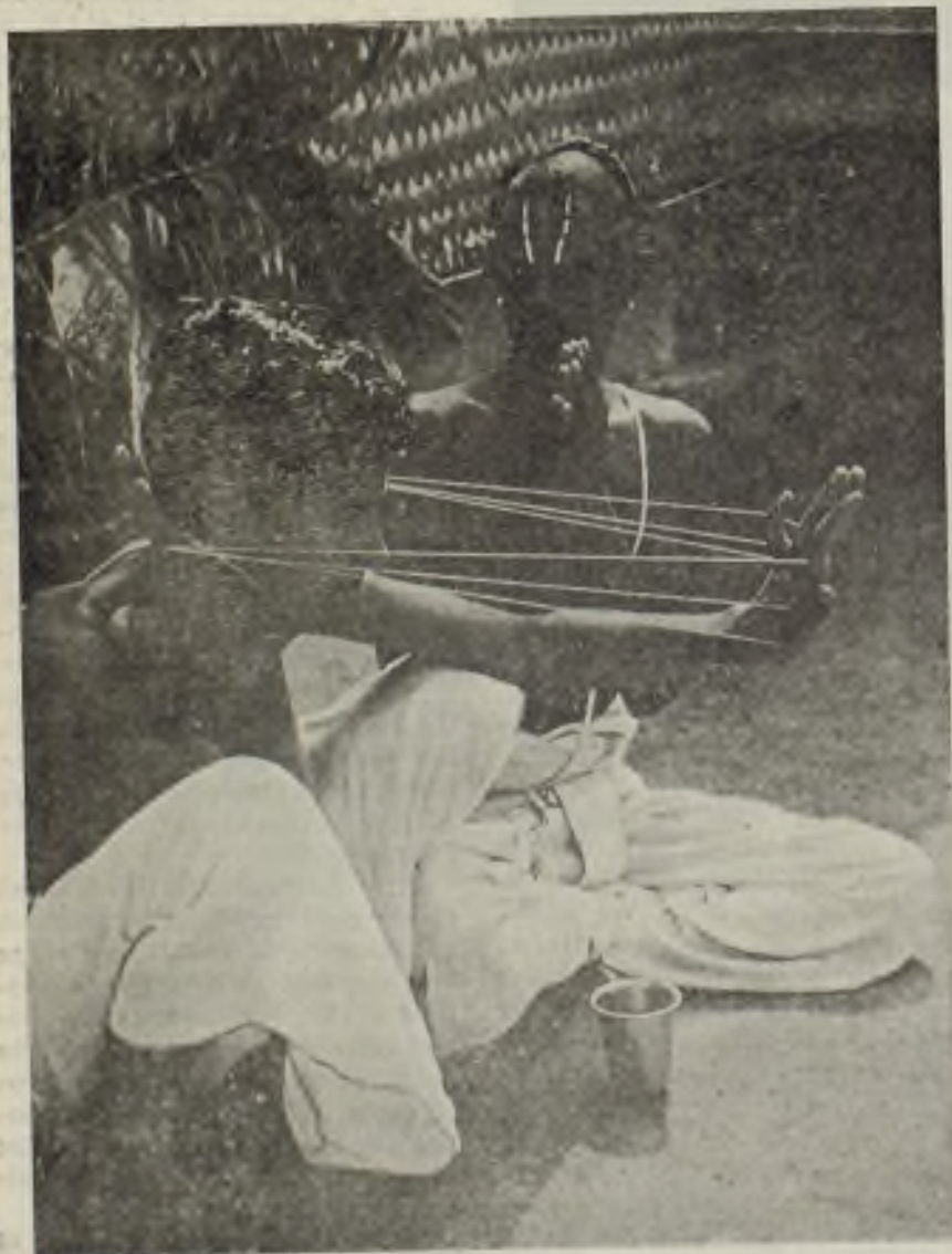
El hilo sagrado, signo de la firmeza en el cumplimiento de los deberes religiosos, es impuesto a un penitente indio. El sacerdote lleva el triple signo de Visnu sobre la frente.

Total población, 357.029.055. superficie, 3.221.000.