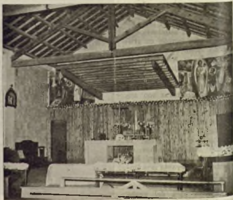
Iglesia de San Jaime

Tienen encomendada en la actualidad sus celosos párrocos la edificación de sus parroquias respectivas en el más amplio concepto. Pero, ¿cómo pedir para casa de Dios entre tanta indigencia? Ciertamente que ya se repartiendo más las cosas. Y ven al lado mismo de barracas perfectamente decentes pero... ¿cómo pedir a los para faltarles es posible que muchos casos hasta les falte? Y, ¿cómo dejar de atender tantos y tantos huérfanos de más elementales asistenciales manas? Las tareas de los pocos san tareas inmensas. Sus braderos de cabeza son y