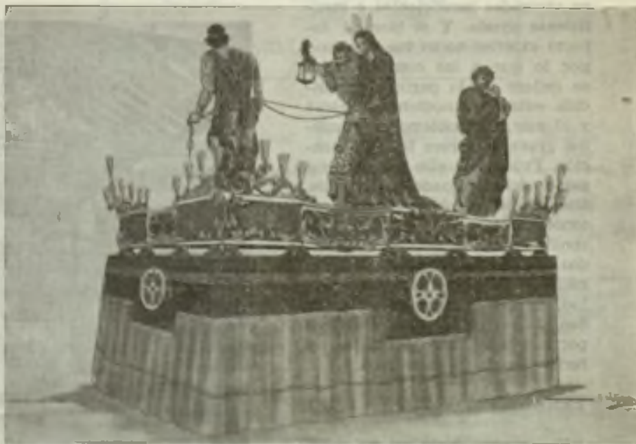
Proyecto del nuevo Paso del «Prendimiento» original de D. José M. a Saladrigas