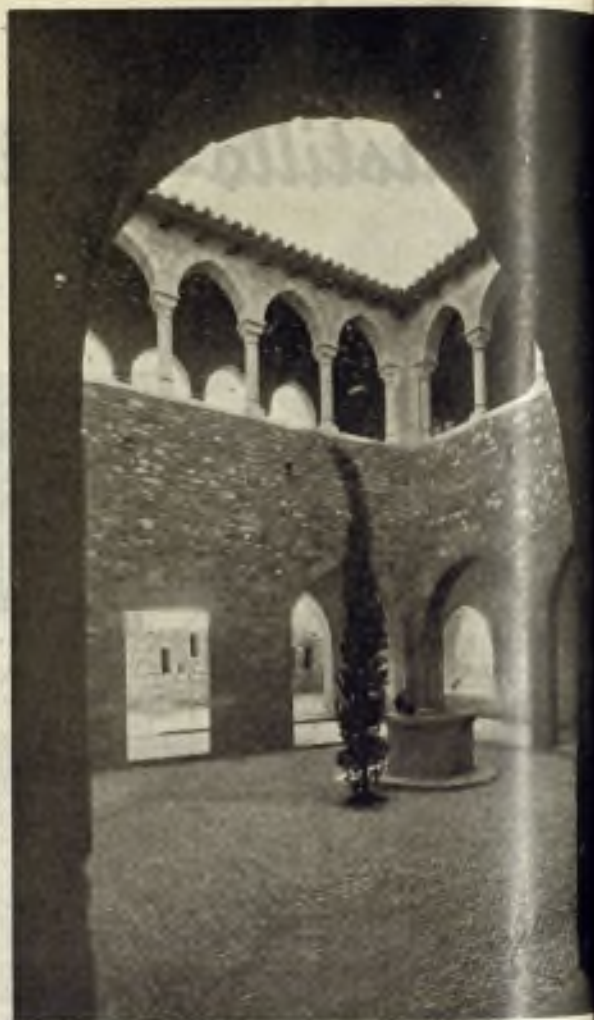
Claustros y Patio

tan falta de jardines y de bellos lugares de reposo. La repoblación de árboles y plantas, llevada a cabo con éxito en el recinto de las mencionadas iglesias, predice que el Vallparadís va a transformarse en un paraje de maravilla