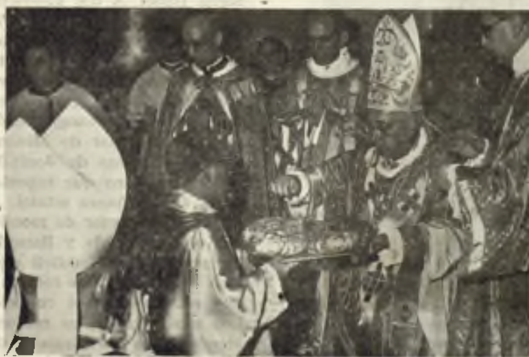
Acto de la Consagración