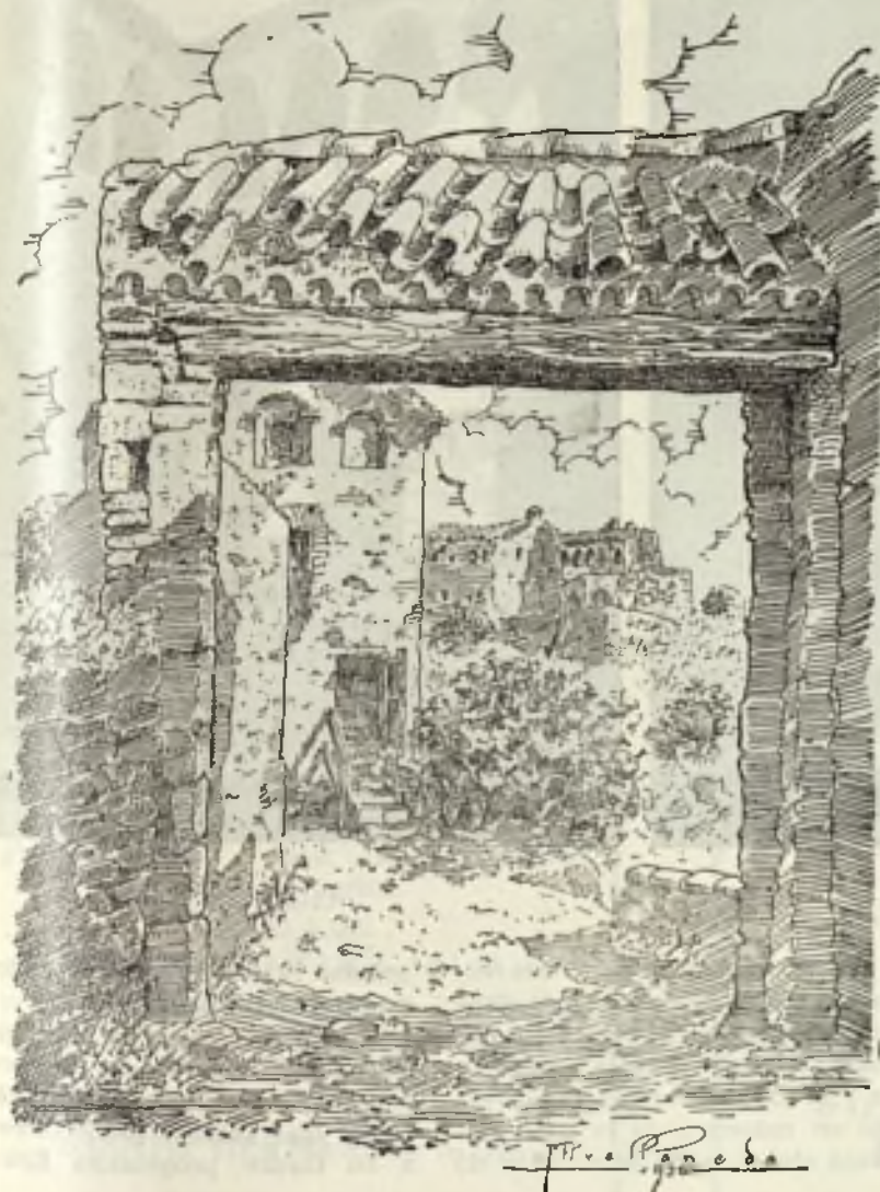
Antigua puerta de entrada a la Cuadra de Vallparadís

El conjunto histórico-artístico del Vallparadís. — Hace tiempo que los tarrasenses amantes del arte y de la arqueología están de enhorabuena. Constituye un orgullo para la ciudad de Tarrasa ofrecer a la consideración de turistas y visitantes el admirable conjunto monumental arqueológico formado por las tres iglesias visigóticas-románicas de San Pedro, no sólo salvadas de una ruina inminente, sino restauradas y valoradas con plena dignidad,