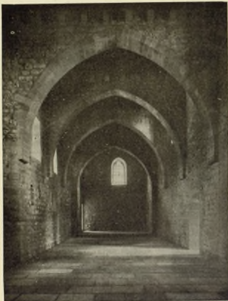
Sala principal y Capilla