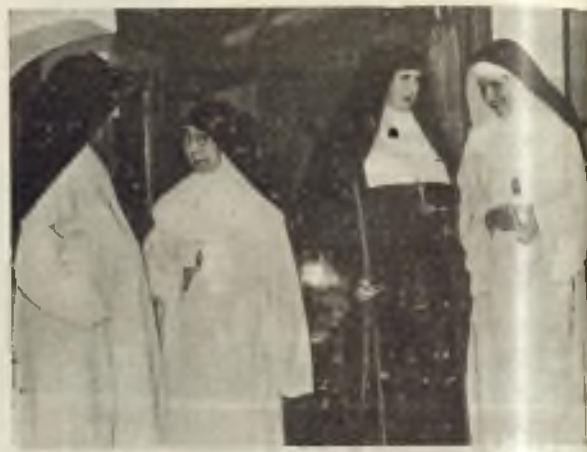
Entre lección y lección