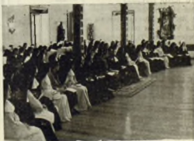
Un aspecto del Salón