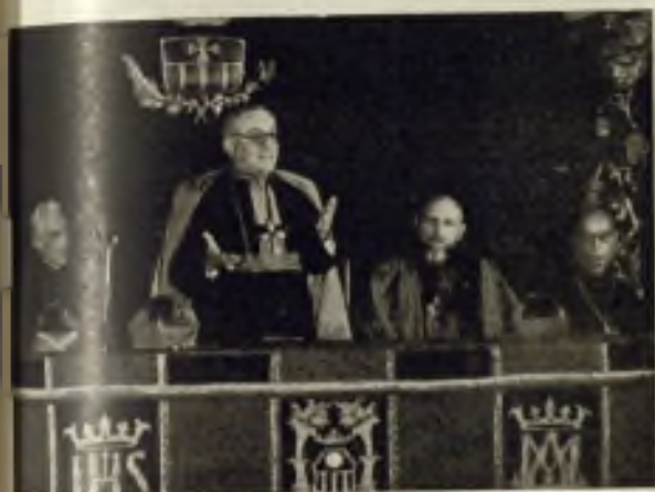
Alocución del Señor Obispo Diocesano en la sección de clausura.

El Centro de Estudios de Misionología de Bériz —incorporado oficialmente desde 1955 al Pontificio Instituto Internacional Regina Mundi— acaba de celebrar del 17 al 21 de agosto, su VI Cursillo de Misionología.