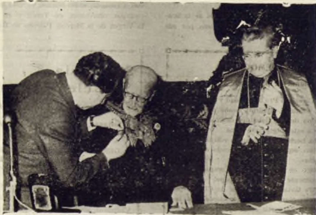
Momento de serle impuesta la Medalla de Oro al mérito en el trabajo. Año 1955