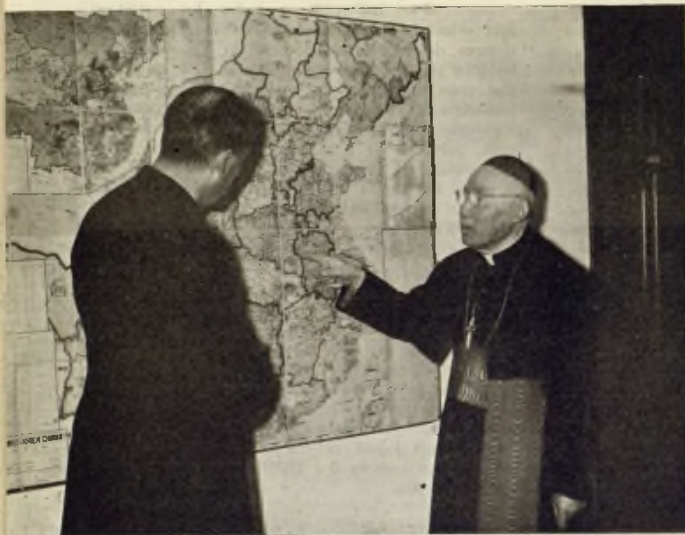
Su Emcia, el Cardenal TIEN de conversación con un misionero desterrado

amarga. Yo creo que si supiera español diría con E. Montes: