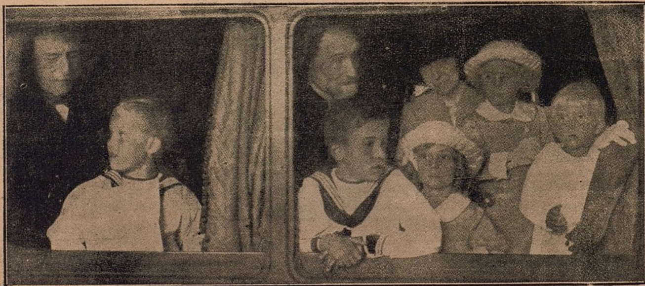
El veraneo de los hijos de los Reyes de España.—El Príncipe de Asturias y los Infantes D. Jaime, doña Beatriz, doña Cristina y D. Juan en su departamento del tren especial, durante su viaje á San Sebastián y otras capitales del Norte.

—¡Que entren esos pobres diablos!... Seguramente no conocieron á Dios, y por eso le crucificaron.