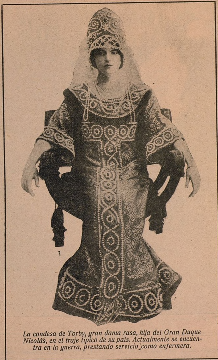
La condesa de Torby, gran dama rusa, hija del Gran Duque Nicolás, en el traje típico de su país. Actualmente se encuentra en la guerra, prestando servicio como enfermera.

Allí se han paseado tranquilamente, derrotando por completo a la guardia alemana. Luego, ante la intervención de grandes masas de artillería enemiga, tuvieron que volver a sus posiciones del río Sereth».