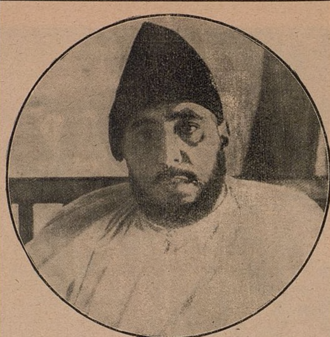
Ultimo retrato del ex sultán Muley Haffid, durante su estancia en Madrid.

hecho antesala en las habitaciones del soberano destronado, ni recibido merced alguna de este personaje extravagante, que pasea por España su cansancio y aburrimiento de la vida.