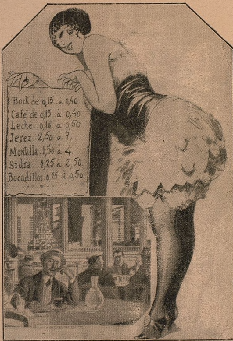
Las mujeres son víctimas de una explotación inicua en los cafés y cervecerías de camareras, que además abusan del público poniendo precios caprichosos a todos los artículos.