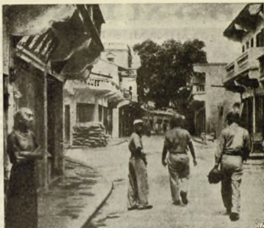
En la calle principal de Kienman (Quemoy), las tiendas están cerradas, se levantan las barricadas de sacos de arena, y circulan los soldados con sus cascos. Están en plena guerra.