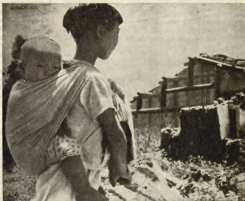
Delante las ruinas de su casa bombardeada por la artillería comunista, esta joven de Quemoy que lleva a su espalda a su hermanito más pequeño, llora ante tanta desgracia.