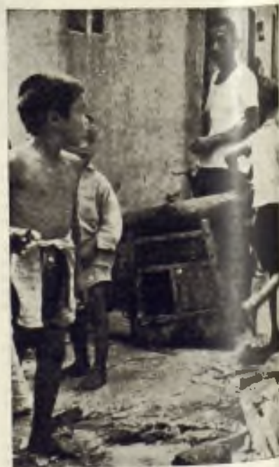
Los chiquitines de Quemoy aprenden ya en su tierna edad la terrible lección de los horrores de la guerra.

Roguemos al Señor por la paz en esas islas, donde unos hombres como los demás llevaban a cabo sus actividades pacíficamente entregados a sus campos y a la pesca y de repente, por el hecho de ser las islas más próximas a la metrópoli china, han sido blanco de la terrorífica máquina bélica que ha derrochado sobre ellos todo el peso del más diabólico ingenio.