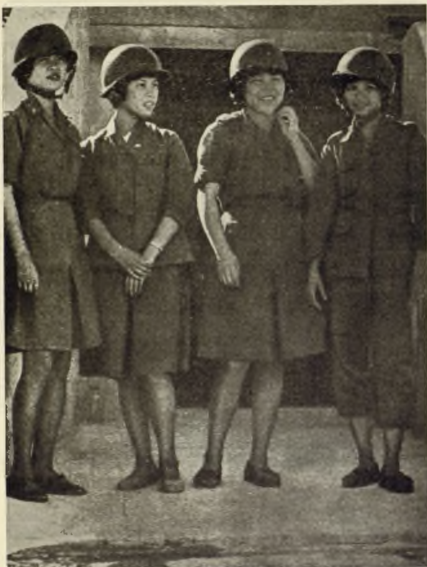
A la entrada del hospital subterráneo de Quemoy estas cuatro enfermeras aguardan el nuevo bombardeo para llevar socorro a los heridos.

Cuando la Nación está en paz, llega uno casi a olvidarse de lo que supone de crueldad y tragedia, el drama de una guerra. Hoy tenemos a unos hermanos nuestros sujetos a constantes y terribles bombardeos que están llegando a la destrucción más espantosa. Quemoy, la isla cercana a la China comunista ha llegado a soportar hasta 5.000 obuses en una hora. Imposible hacerse cargo de la tragedia de aquellas pobres gentes que ven sus casas destruidas, sus campos devastados, y lo que es aun peor, a sus