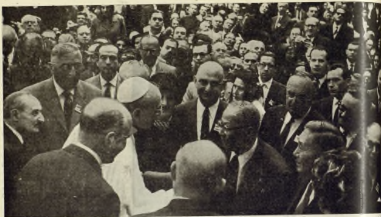
Una reciente fotografía de S. S. — El Pontífice recibe en su residencia de Castelgandolfo a los médicos que participaron en el Congreso de Hematología, celebrado en Roma.

sobre la Humanidad. Sólo la figura blanca del Papa ha sido desde el Vaticano, una esperanza para cuantos comprenden la enmarañada situación de la tierra. De todos los rincones llegaban a Roma millones de seres ávidos de ver al Papa, de asistir a alguna de sus audiencias o por lo menos recibir su bendición desde aquella pequeña ventana iluminada en la que velaba y oraba hasta las más avanzadas horas de la noche. Sus doctos y paternales mensajes, adaptados siempre a los problemas que atormentan al mundo, eran una lección que orientaba en este siglo de vertiginoso progreso material y de la máxima congoja espiritual.