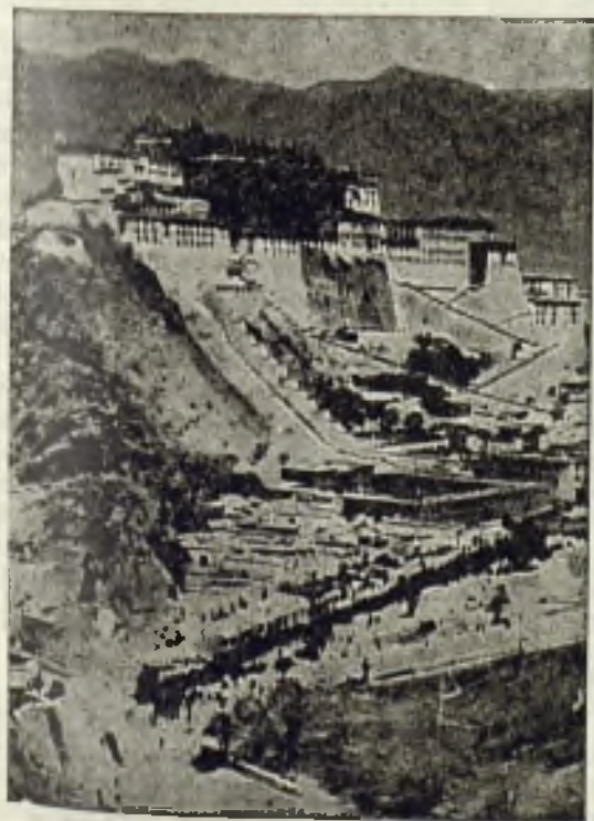
Lhasa, el gran palacio del Dalai Lama.

Abandonado por los capuchinos terreno tan agreste, en la actualidad después de veinte siglos se puede decir que la Iglesia no existe en el Tibet. En este inmenso país tan grande como, Uruguay, Paraguay y Chile juntos no hay ni una sola Iglesia dedicada al culto al verdadero Dios, no hay ni un sacerdote que inole la Víctima Expiatoria, ningún Sacramento que proporcione la Gracia Santificante. No se conoce a Nuestro Señor Jesucristo. Solamente se encuentra una inscripción en el templo principal de Buda en Lhasa que dice «Te Deum laudamus». También se en-