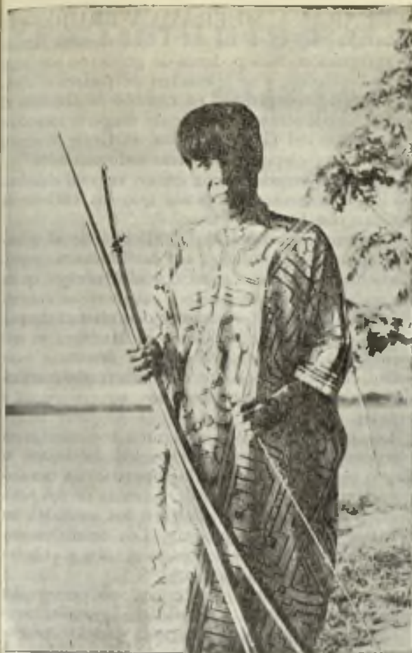
Curaca de una tribu cunibo luciendo su clásica túnica de algodón, o «tari», con dibujos geométricos.

nuevos por temor a quedarse ciegos. La carne de cerdo la consideran nociva, lo mismo que la sal.