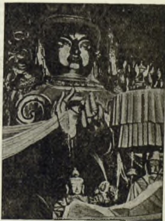
El Dipankara Buda.