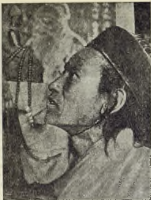
Un Lama en oración.

cuentran algunas cruces de madera en algunos templos... Son los últimos vestigios del paso de los Misioneros en el Tibet.