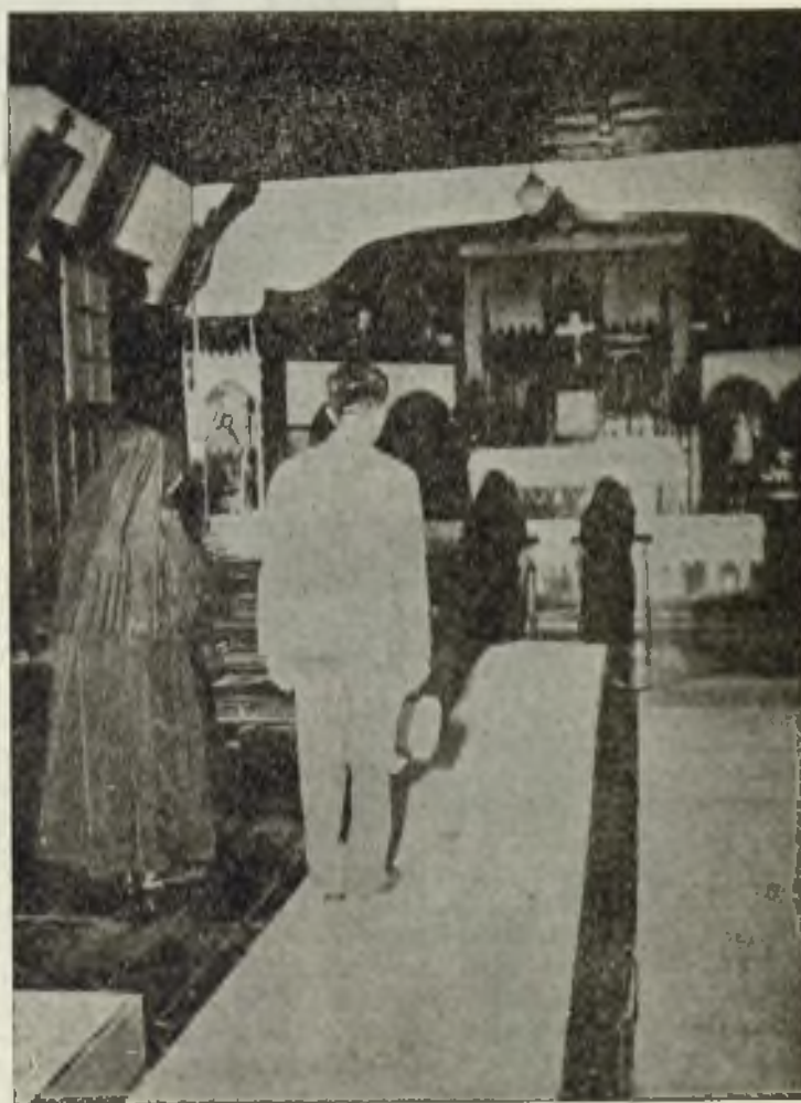
Esta es la primera vez que S. M. el Emperador del Japón visita una Iglesia Católica.

La simpática, deportiva y agradable Michiko Shoda, jugando unos "sets" en la pista de tenis antes de vestir el traje nupcial de 25 kilos de sedas recamadas en oro heredado por las futuras emperatrices durante once siglos, ha venido a acentuar la democratización del Japón, sin que ello