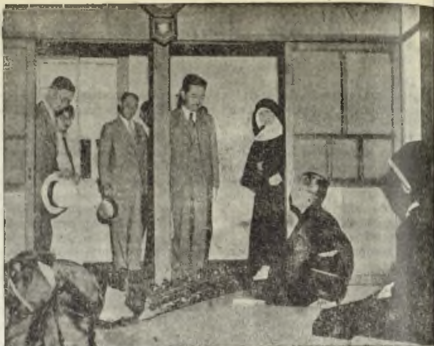
El Emperador del Japón visitando el establecimiento de las Hijas del Sagrado Corazón (Soishin Aishi-kai)