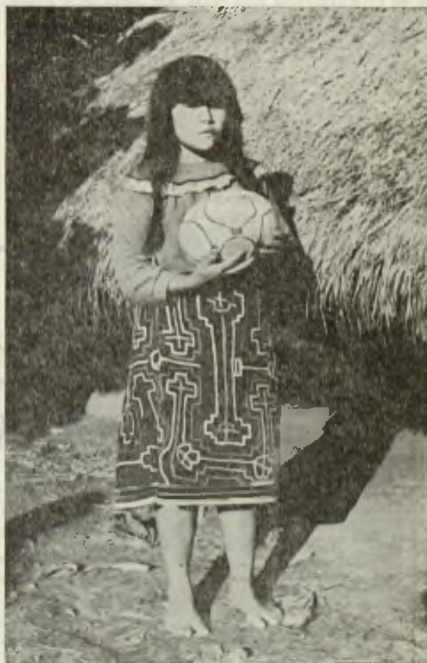
Una jovencita cunibo ataviada, a la usanza de la tribu, con la falda de jeroglíficos, y la monedita de plata pendiendo de la nariz.

EL «PANKARI». — El Pankari es el distintivo social de la tribu y consiste en el aplastamiento de la cabeza de los niños recién nacidos. Para ello la madre aplica a la frente del niño un almohadoncito de arcilla sujeto a una tableta que atan con una liga por el cerebro y la coronilla. Antes del año el niño tiene la frente achatada. El origen de esta bárbara costumbre cuyo tributo tantos niños pagan con su vida, es sin duda religioso. Así creen asemejarse al Sol.