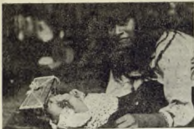
Joven madre cunibo practicando en su tierno vástago el clásico «Pankari», rito cruel y tradicional de su tribu.

RELIGION "MITOLOGIA". — Creen en la inmortalidad del alma, pero al mismo tiempo creen en la reencarnación del alma de los malos en animales. (Quiero hacer notar aquí lo arraigado de esta creencia aún entre los blancos y gente civilizada de toda esa región).