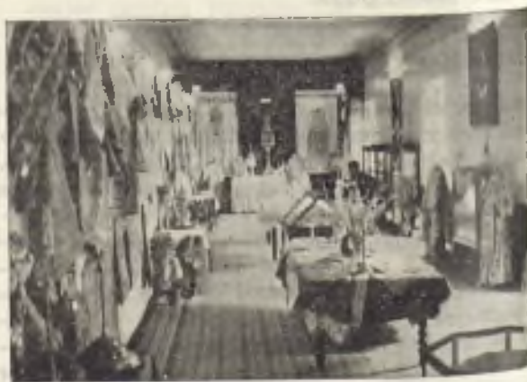
Un aspecto de la exposición de arte eucarístico realizada en la biblioteca del Seminario Conciliar de Ciudadela.

A la misma asistieron fieles de todas las parroquias de la isla, precedidos por sus «lledánies» de flores y sus estandartes; niños de las escuelas y colegios; entidades piadosas, comunidades de enseñanza y caridad de toda la Diócesis; varias representaciones oficiales; jefes y oficiales del Ejército y de la Marina; todos los Ayuntamientos de Menorca con sus insignias y maceros; casi la totalidad de los sacerdotes diocesanos, revestidos de capa pluvial; Ilmos. capitulares, de capamagna; el Excmo. Sr. Obispo con sus ministros; las primeras Autoridades insulares, y fuerzas del Ejército con cornetas y tambores.