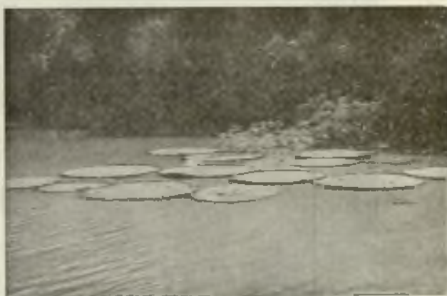
La Victoria Regia.

He aquí, amados lectores españoles, la reina