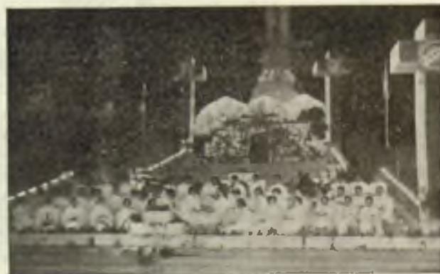
Auto sacramental «La Vida es Sueño».

El mismo Día Sacerdotal se inauguró en la espaciosa biblioteca del Seminario Conciliar una