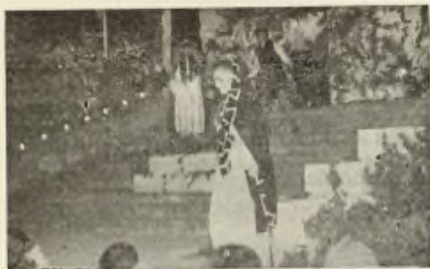
Auto sacramental «La Vida es Sueño».

interesante exposición de arte sagrado, en la que se exhibían un millar de objetos, especialmente relacionados con el culto eucarístico; algunos, notables por su valor material, artístico o histórico, eran ejemplares antiguos que lograron salvarse del despojo y destrucción por los rojos en 1936; otros fueron seleccionados de entre lo más digno de admirarse dentro de las modernas tendencias del arte litúrgico. Una vitrina recogía los recuerdos del culto clandestino durante la última persecución: copas que sirvieron de cálices, cajitas utilizadas como sagrarios y píxides en la reserva eucarística doméstica... Puesto de distinción ocupaban el cáliz, misal y ornamentos del protomártir del Clero menorquín en 1936, el angelical sacerdote Slervo de Dios D. Juan Huguet, que sólo celebró 33 Misas. Con esta exposición se inauguró un monumental fascistol con el libro de las Sagradas Escrituras y oportunas inscripciones y adornos, que por disposición del Prelado ocupa con todo honor el centro de la antesala de la biblioteca del Seminario.