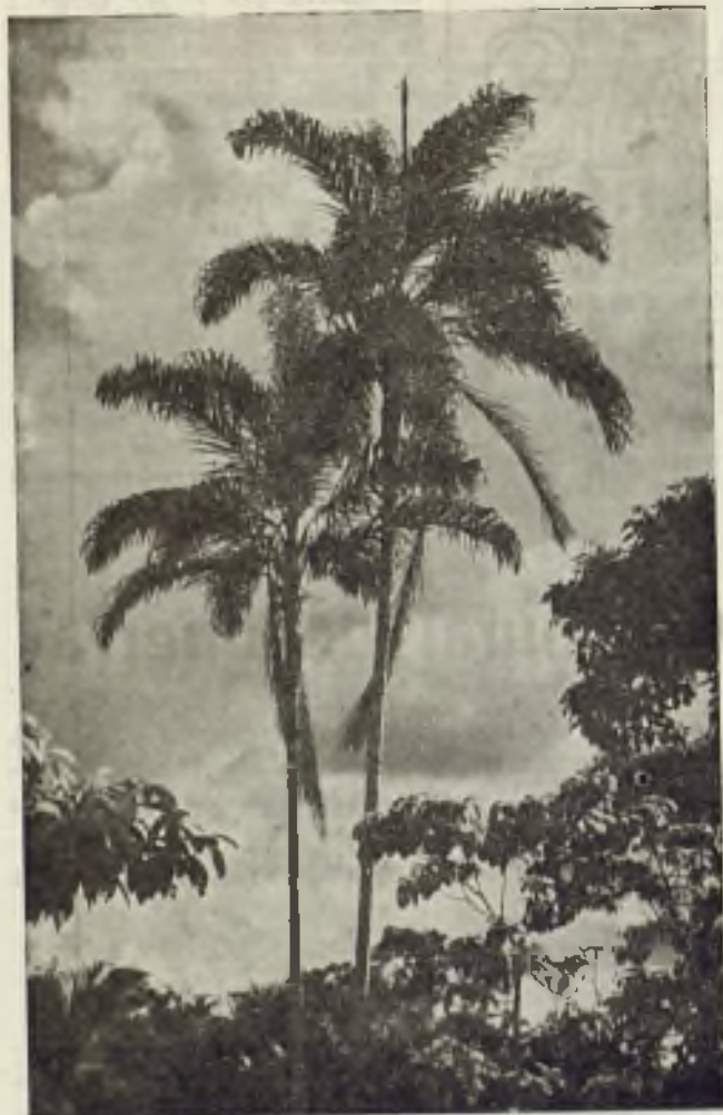
Esbeltas palmeras en medio de la selva.

La selva virgen en uno de los espectáculos más grandiosos de la naturaleza.