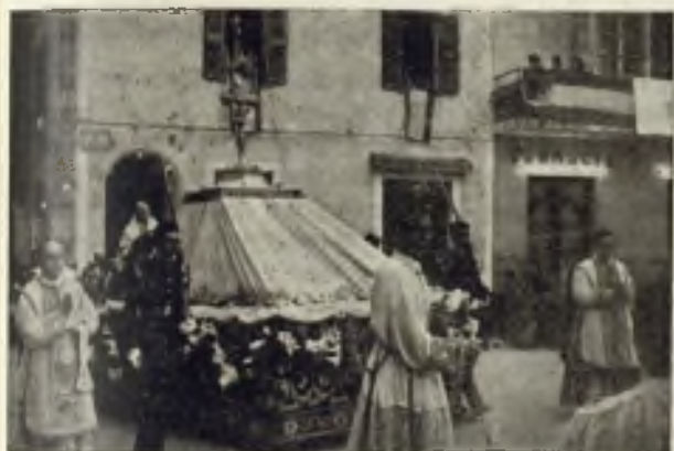
La Sagrada Custodia recorre triunfalmente las calles de Ciudadela en la concurridísima procesión de clausura.

Grandiosidad y fervor, arte y poesía, flores e iluminaciones rivalizan en glorificar a Cristo Sacramentado