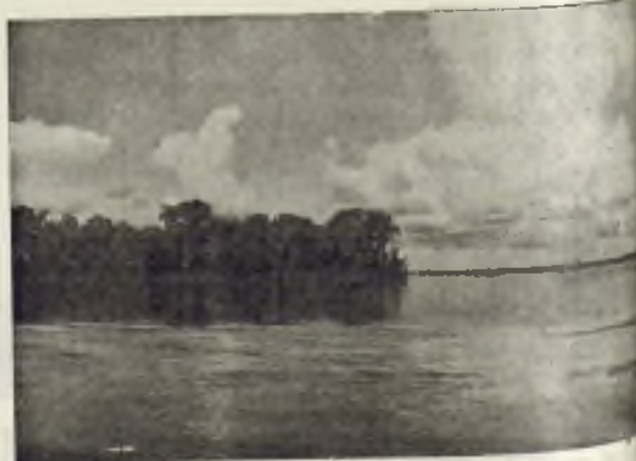
El Amazonas desbarrancando en las orillas arrastrando constantemente vegetación.

Sus pistillos son grandes como astas de buey y sus hojas, como ruedas de molino. Las hojas de la flor y el fruto (los dos últimos sólo en determinadas épocas) son las únicas partes visibles de la planta. El tallo, el pedúnculo y el cáliz permanecen siempre sumergidos en el agua.