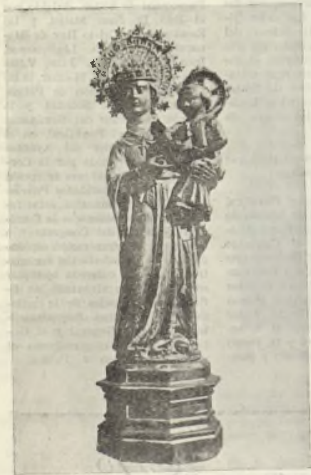
Imagen de Ntra. Sra. de Lluch

Y en la intimidad del templo se quedó la Virgen Morena. Mallorca entera le había tributado el homenaje de su amor y de su devoción y antes de partir para sus casas todos sus hijos le habían estampado el beso de su cariño. Ella, solita en su Camarín, entre el perfume oloroso de unos claveles y el chasquido alegre de unos cirios, bendecía aquel pueblo predilecto que tan solemnemente le había festejado.