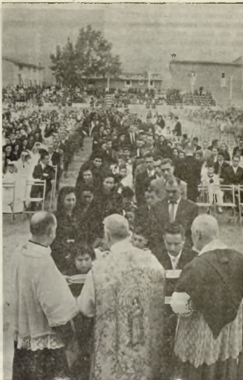
Festividad de la Primera Comunión