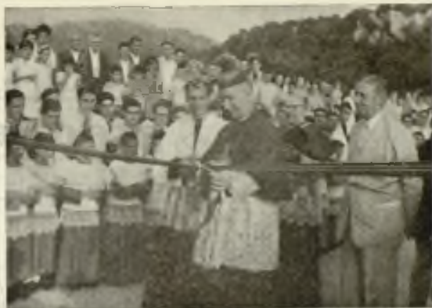
El Sr. Obispo de Mallorca inaugura la nueva carretera

das Y entre ellas el corazón de todos los mallorquines a su Reina y Madre.