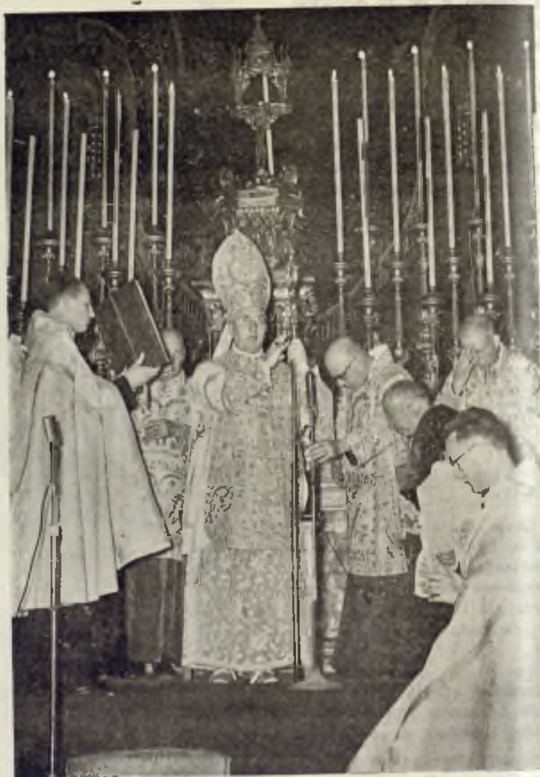
Solemne bendición Papal por el Excmo. Sr. Obispo de Palma

El esplendor de esa procesión fué mucho mayor que en años anteriores. No sólo en cuanto al número de los que formaron el respetuoso séquito de la Eucaristía por las calles de nuestra ciudad, sino también por la extraordinaria concurrencia de personas que presenciaban su desfile. Pues la tarde del viernes fué de asueto en todos los oficios, fábricas y talleres, lo mismo que todo el día del sábado, con motivo de las extraordinarias festividades de esos días.