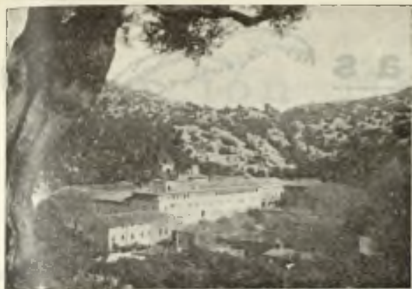
Vista del Santuario de Ntra. Sra. de Lluch