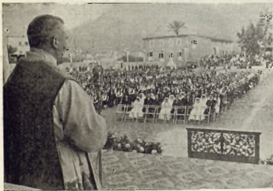
Plática del Excmo. Sr. Obispo a los infantes