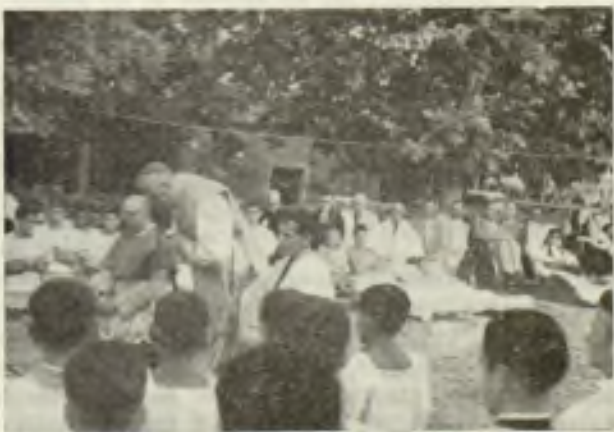
El Sr. Obispo celebra la Misa ante 480 enfermos congregados en torno a la Moreneta.