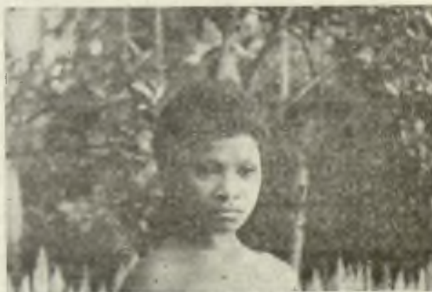
Una jovencita papue (Nueva Guinea).

Yo tengo una Hermana, ángel de caridad, que cada día, bien de mañana, al aire libre, si el tiempo lo permite, atiende bondadosamente a esas centenares que acuden para que nos compadezcamos de sus miserias, pues empiezan a tener fe en nuestras medicinas.