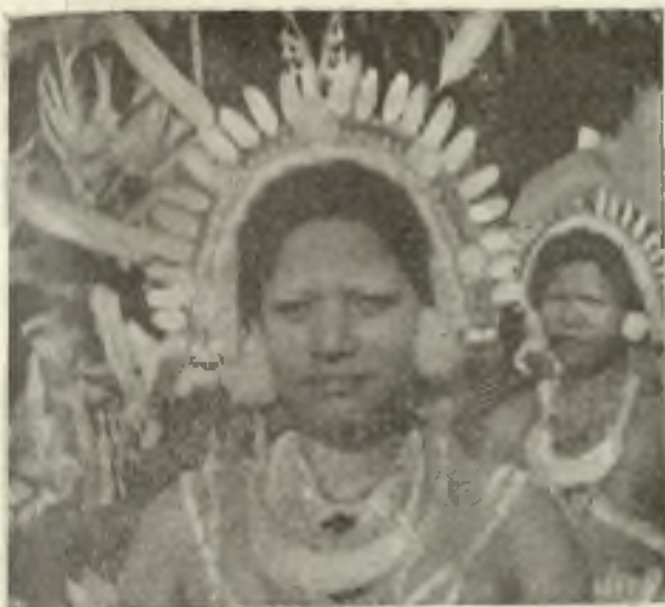
Jóvenes ataviadas para la danza (Nueva Guinea).

QUIERO DINERO!!! porque lo necesito. No, no es para mí, sino para mi obra. El misionero, habituado ya a las penalidades de su vida, se resigna fácilmente a las privaciones y dureza que van anejas a su ministerio, tan duro allí sobre todo, en esa isla, la más salvaje, la más desconocida, la más alejada e inhospita de la tierra.