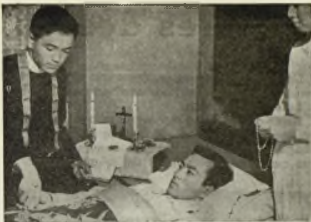
Siempre está dispuesto a acudir en las situaciones más críticas.

Dad lo que sois, todo lo que sois. Sed genero-