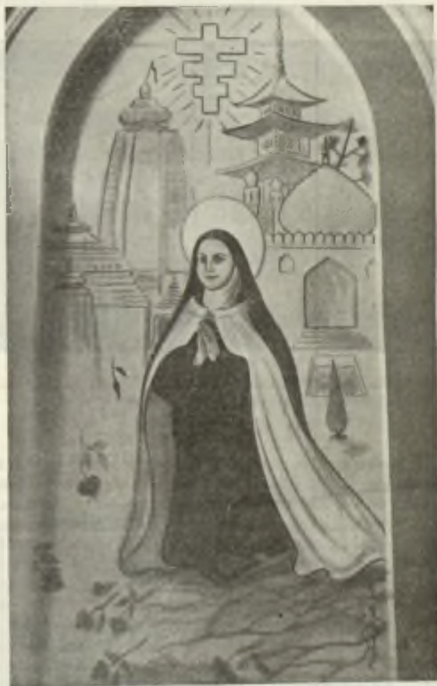
India (Poona) Colegio Nobili. Pintura en la Capilla del Escclasticado de los PP. Jesuitas, representando Santa Teresa del Niño Jesús. Autor Angel de Fonseca (estilo indio).

islamismo... Son muchos los miles de gente que desgraciadamente se están enrolando en las líneas de estas instituciones que, de día en día están