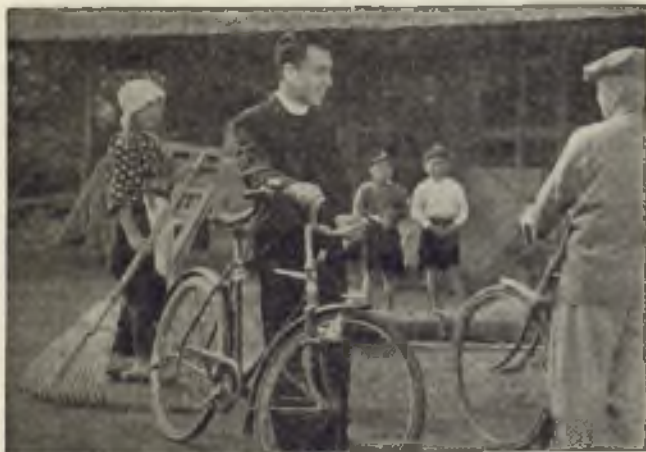
El Misionero utiliza toda clase de medios para desarrollar su labor.

Nació en 1822, y su primera colecta arrojó la insignificante cifra de 78 francos. En 1922 el Papa la hizo órgano oficial de la Santa Sede.