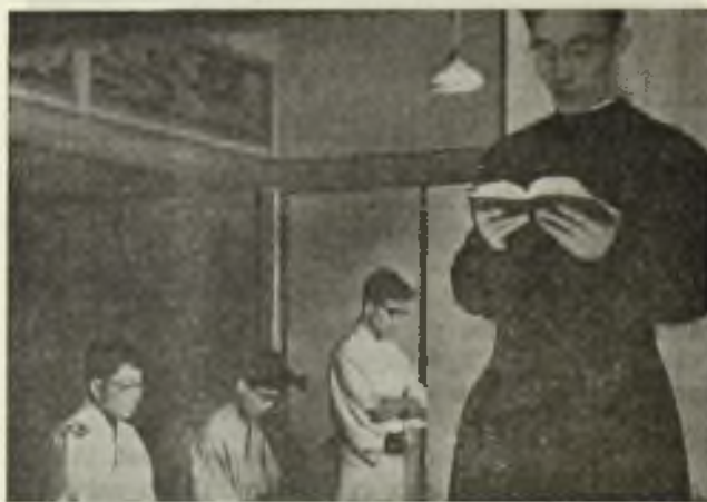
Y eleva su plegaria al Señor para las almas que El ha puesto a su cuidado.