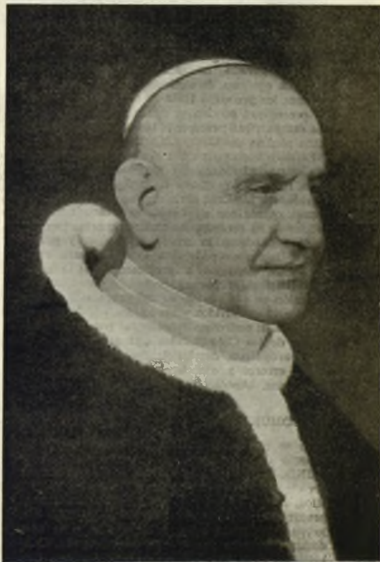
Su Santidad Juan XXIII.

El DOMUND 1959 hará todo lo posible para que los cristianos recuerden y consideren, procurando vivirlos, estos dogmas, estos pensamientos en su ser y en su vida, en el de la Unidad y para la Unidad. El ideal de este DOMUND sería que cada católico estudiando, considerando, haciendo de todo esto tema de sus meditaciones y de sus oraciones; destacara con letras muy visibles en la pantalla de su espíritu, estas palabras de San Pablo: «Descaba ser anatema de Jesucristo en