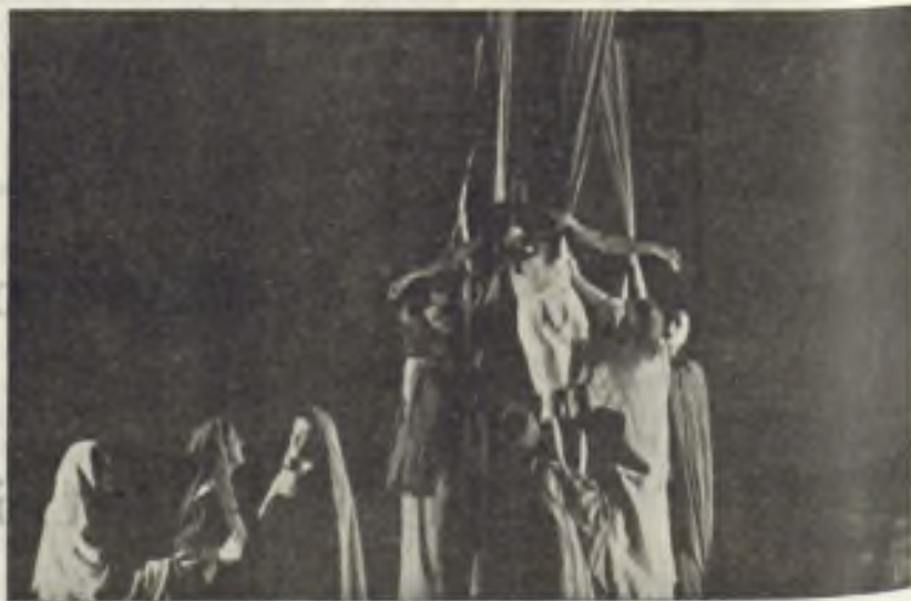
Jesús descendido de la Cruz