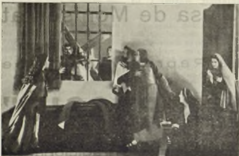
JESÚS CON LA CRUZ A CUESTAS

de Nafm.—5. Conversión de la Magdalena.—6. Jesús invitado por Simón de Cafarnaúm.—7. La pecadora en el festín.—8. El ciego de nacimiento.—9. Jesús va a Betania por Lázaro.—10. Resurrección de Lázaro.—11. Jesús y los niños.—12. Entrada triunfal en Jerusalén.