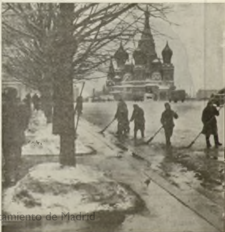
Ayuntamiento de Madrid

sangre de los mártires es semilla de nuevos cristianos». Estos olvidan que la sangre de los mártires será algún día semilla de cristiandad. Pero, por ley ordinaria, el martirio colectivo, lo que pudiéramos llamar «genocidio del pueblo cristiano», ha abierto en la Historia de la Iglesia unos eriales, en los que durante siglos la fe de Cristo ha quedado totalmente arrasada. Tal ha ocurrido