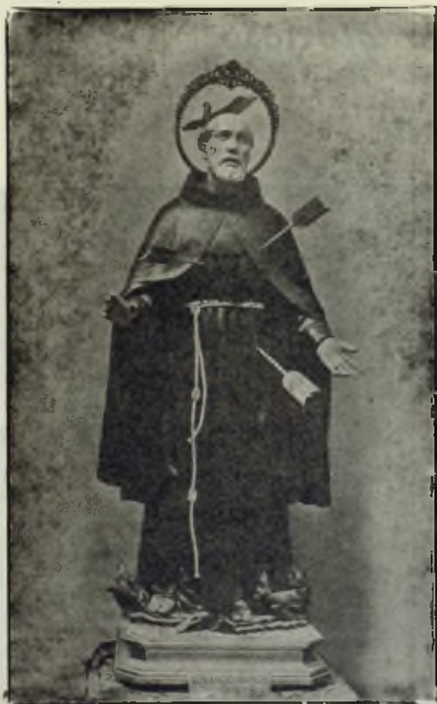
Beato Juan de Prado, O. F. M., a cuyo celo misionero se debe la primera restauración de las Misiones marroquíes.

obstáculos se iban acrecentando. Las luchas intestinas, las cárceles y los sufrimientos obligaron a que los superiores de la Orden cesasen de mandar misioneros.