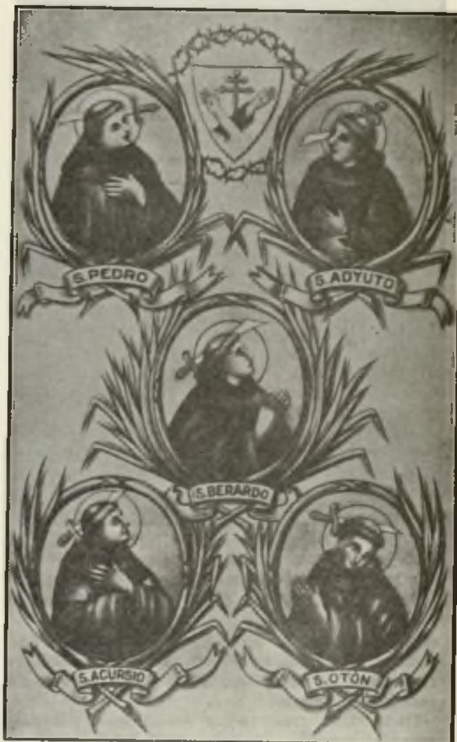
Los cinco protomártires franciscanos, martirizados en Marruecos, cuya sangre ha cuajado en frutos copiosísimos.

La evangelización de Marruecos data del tiempo de San Francisco. En el Capítulo de las Estrellas, celebrado en 1219, San Francisco se dispuso a repartir el mundo entre sus hijos para que lo evangelizaran. Para Marruecos —donde él soñó personalmente— envió a seis religiosos. Entraron por España y bajaron enseñando la doctrina hacia el sur de la península, teniendo que quedarse en el camino uno de ellos por causa de enfermedad. Los cinco restantes pasaron a Marruecos donde empezaron a propagar con in-