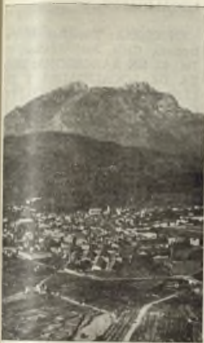
Olesa de Montserrat — Vista general

En toda Cataluña, la asistencia a «La Passió» de Olesa es una tradición desde hace más de tres siglos.