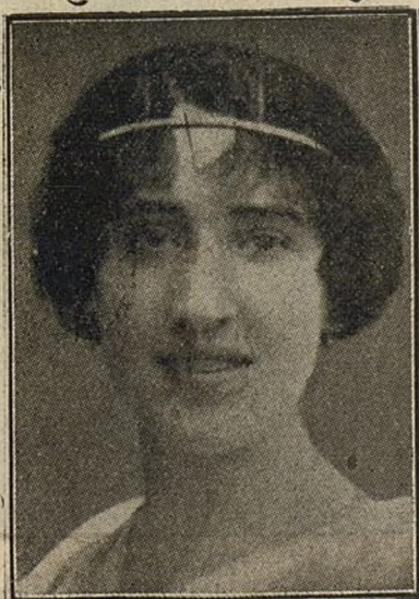
Señorita Rita Serrabona, notable tiple de zarzuela grande que ha debutado en Madrid con gran éxito.

L OS grandes y heroicos servicios que en todas partes realiza la benemérita, son ahora particularmente significativos en varias regiones de Galicia,