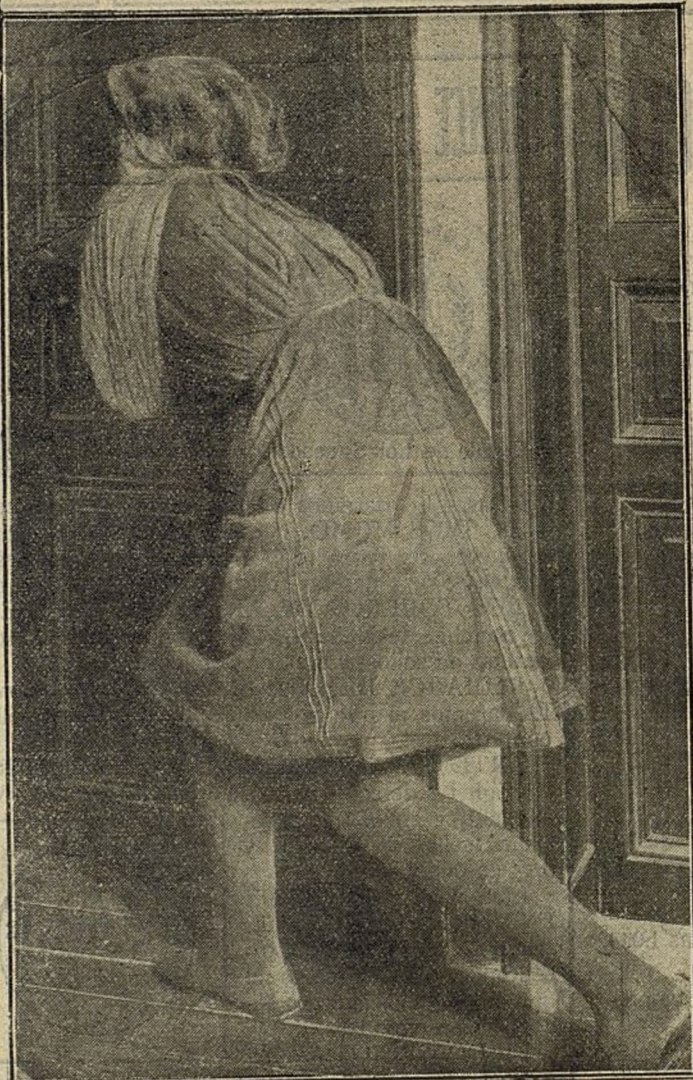
Una ladrona de hoteles, torzando la cerradura del cuarto de un viajero. Para no producir ruido van descalzas y con falda corta. Aplican cloroformo á la nariz del que duerme y luego efectúan el robo. (Véase la fotografía de nuestra portada.)

que se reclamaba la presencia en esta corte del distinguido cloroformista.