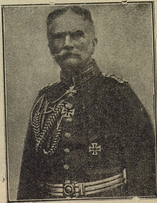
El general Mackensen, famoso militar alemán, que manda los ejércitos austro-alemanes, invasores de Servia.

infligió una tremenda derrota en diciembre del año último á los doscientos mil soldados austriacos que mandaba el ge-