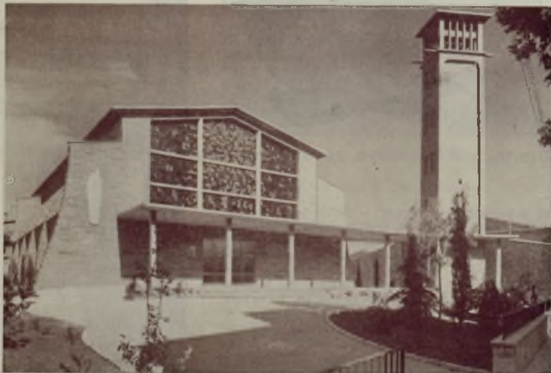
Fachada del Templo

La IGLESIA de líneas muy modernas está situada dando frente a la carretera, rodeada de espacios verdes y teniendo acceso al interior a través de un amplio