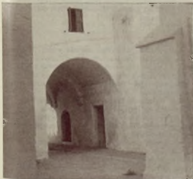
Visla interior del antiguo monasterio de Clarisas de Ciudadela; visitado por el Santo Arzobispo Claret en 1860. El convento fué demolido por los rojos.

En su brevísima vida sacerdotal sólo pudo celebrar 33 Misas. El día 23 de julio de 1936, después de salvar de la profanación al Santísimo Sacramento de la iglesia parroquial, fue detenido por los milicianos rojos en la Casa-Ayuntamiento de Ferrerías, donde el mismo jefe rojo de la isla, al ver que llevaba un pequeño crucifijo, le amenazó con su pistola diciéndole: «Escupe o te mato». El