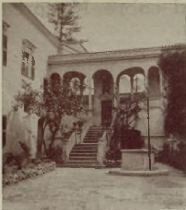
Patio del Palacio Episcopal de Ciudadela donde se hospedó en septiembre de 1860 S. Antonio M. a Claret.

aquella mesa, y en ella, adornada de flores, consumen su parco refección el día de la fiesta de San Antonio María.