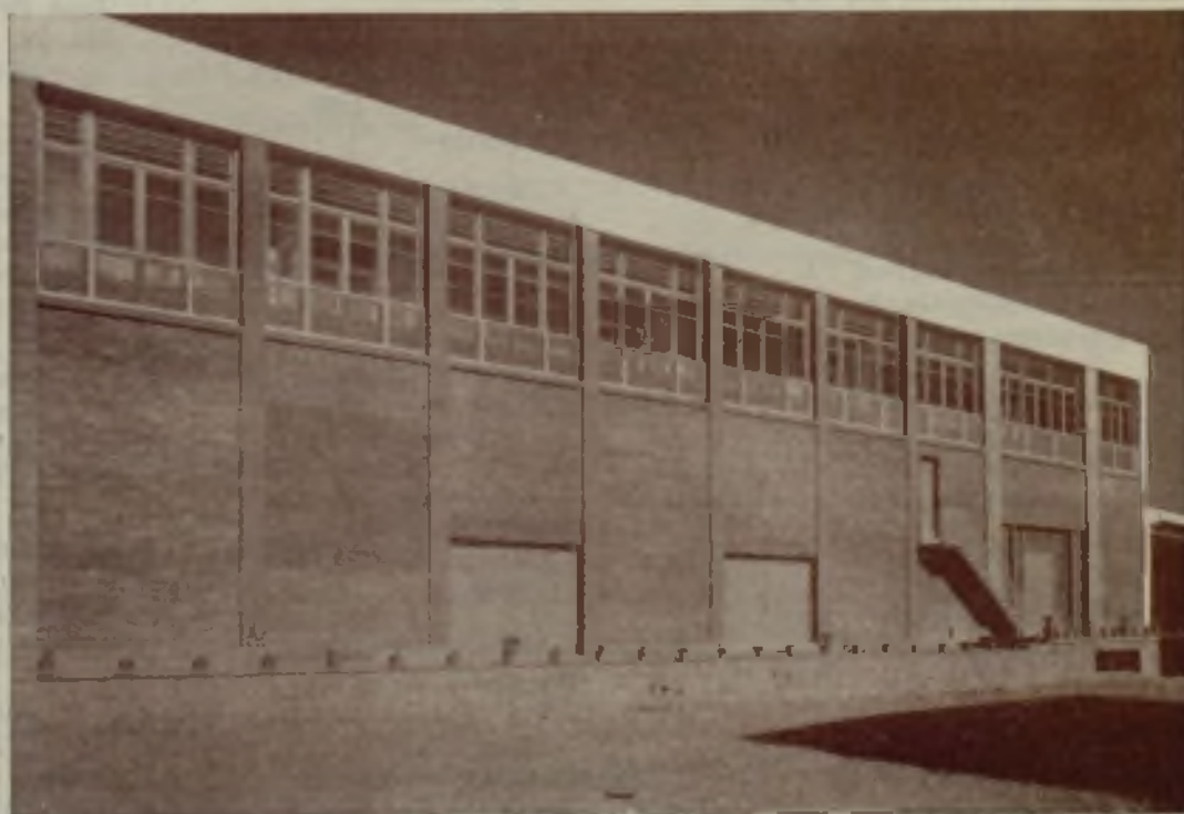
Grupo de Escuelas

del presbiterio y la gran vidriera que ocupa toda la fachada principal en la que en su lado izquierdo se halla un notable bajo relieve, imagen de Santa Elena, obra del escultor D. Fernando Bach-Esteve. Completan el edificio el amplio presbiterio con un muy simple altar totalmente de piedra, el baptisterio, el coro, la sacristía y una amplia capilla lateral.