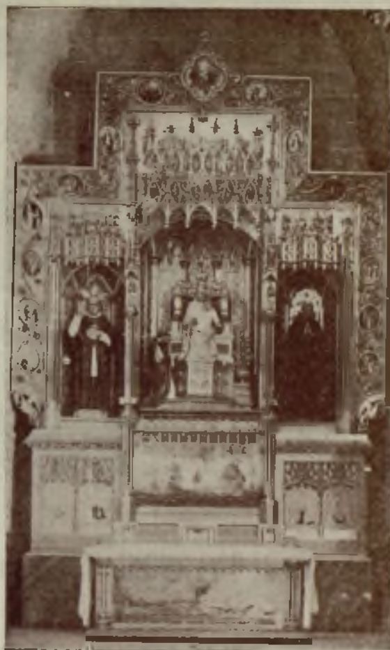
Retablo actual de Ntra. Sra. del Rosario, en una capilla de la Catedral Basílica de Menorca. En la parte del Evangelio aparece la imagen de S. Antonio M. Claret.