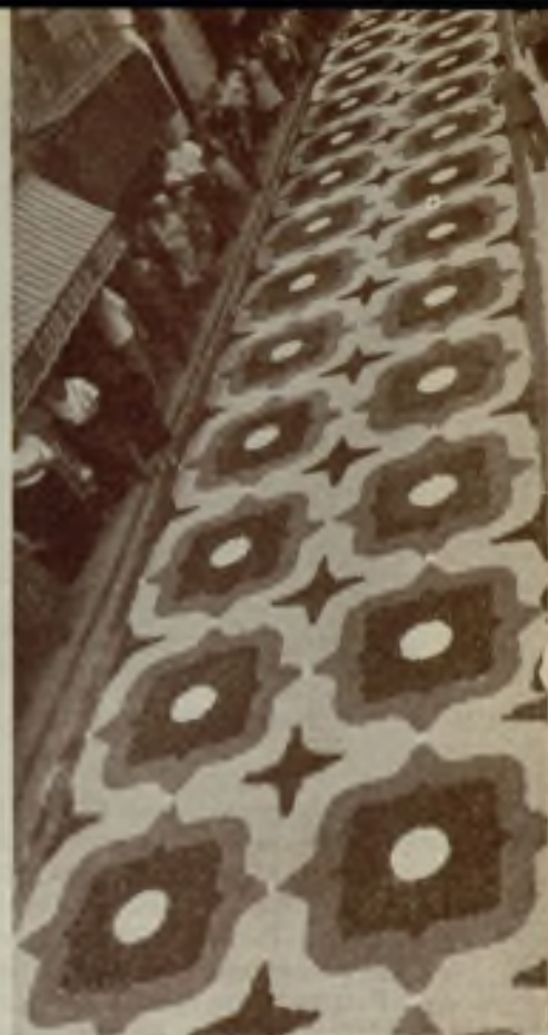
Mañana del Corpus

homenaje al Señor se ve, anualmente, correspondida y admirada por innumerables forasteros que de España entera y aun del extranjero coinciden en estos días en la Villa catalana del Mediterráneo, llevándose de la misma el más compungido recuerdo y convirtiéndose en propagandistas del noble afán religioso y artístico de ese pueblo. M. C.