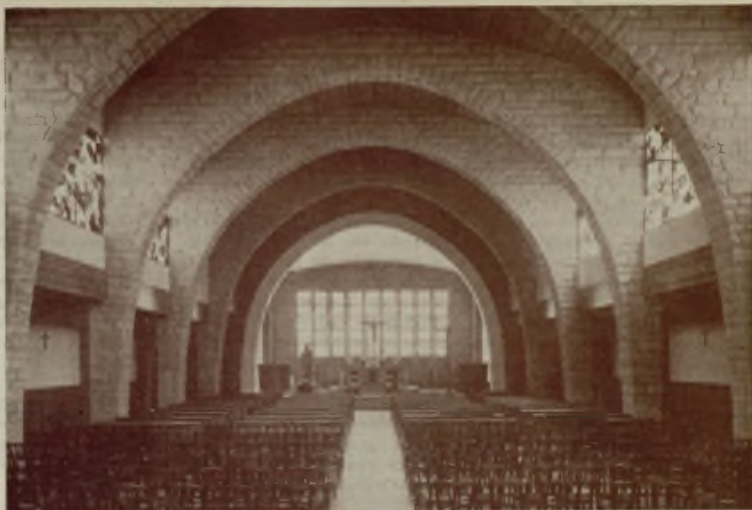
Interior de la Iglesia.

pórtico que la une a un esbelto campanario aislado de aquella, el cual tiene una altura de diecisiete metros, es de planta rectangular y formado por elementos a base de piedra, obra cocida y vidrio.