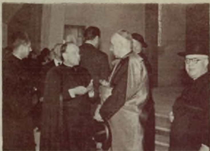
El Excmo. y Rdmo. Sr. Arzobispo-Obispo durante la bendición