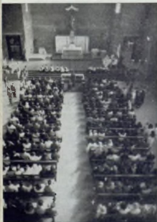
Interior del Templo.

la Iglesia Parroquial de Nuestra Sra. de la Salud se encuentra a unos cien metros de la carretera de Francia entre las calles de Cristo Rey, Manila y Navarra.