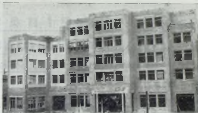
Las Escuelas en construcción.

templarse con las más optimistas esperanzas cuando es tan halagüeño el fruto de lo realizado hasta el presente.