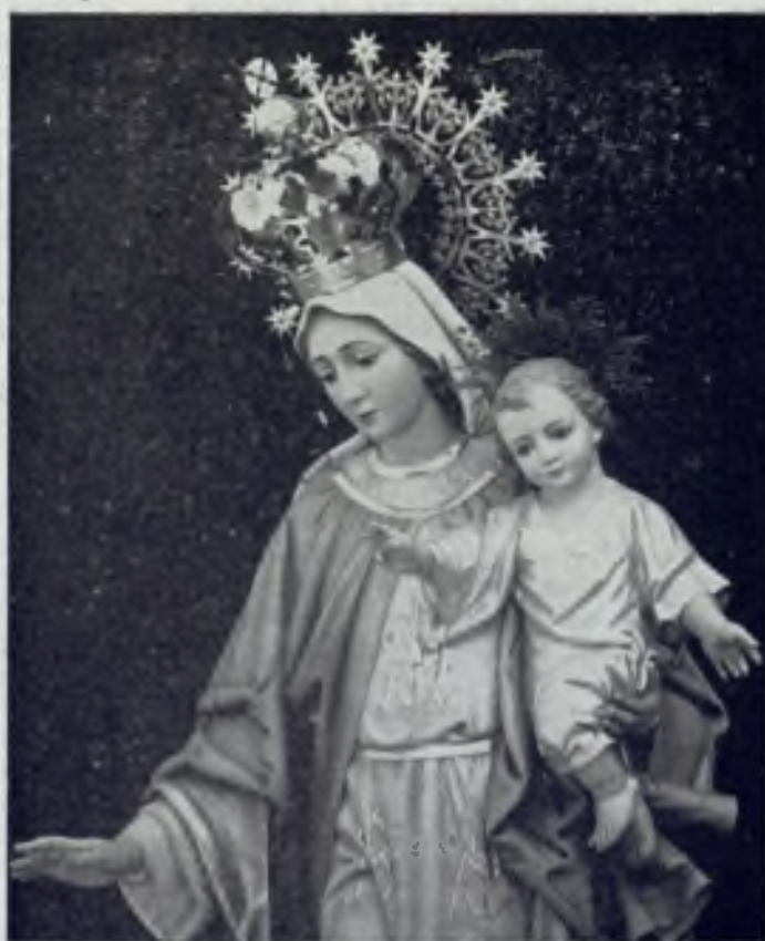
Nuestra Señora de la Salud.

Antes de llegar a Badalona, viniendo de Barcelona por la carretera de Francia, el viajero lee en la ruta la llamada de la Parroquia de Ntra. Sra. de la Salud; horario de Misas e indicación de donde se halla emplazado el gran Templo, que a pocos metros de la señal y a su izquierda contempla como signo de fe y protección a la barriada de su nombre. Concretamente, pues,