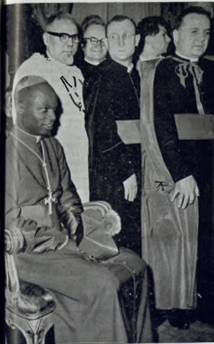
Mons. Laureano Rugambwa, Obispo de Rutabo, escucha el Breve de Juan XXIII que le nombra Cardenal de la Santa Iglesia Romana. Marzo 1960