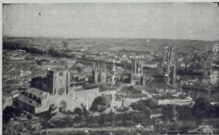
Vista panorámica de Burgos

XIII SEMANA MISIONAL DEDICADA AL II CONCILIO ECUMÉNICO VATICANO CON- VOCADO POR SU SANTIDAD JUAN XXIII.