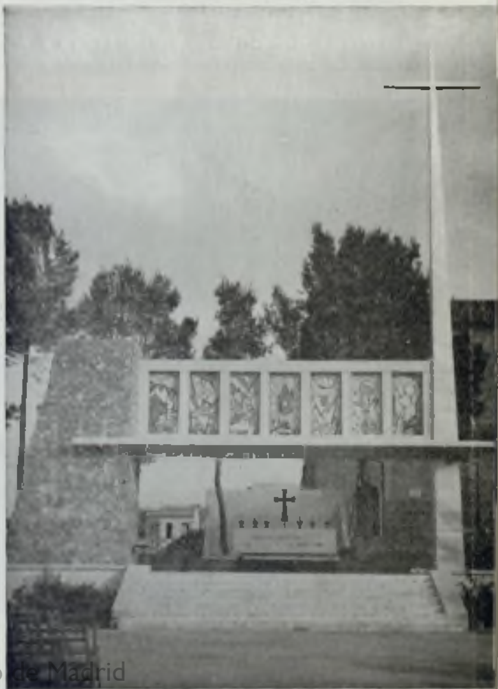
Altar del Congreso ➡➡

Por la tarde se trasladó la imagen de Sta. M. a la Mayor al Altar del Congreso. A continuación se celebró la Santa Misa, Comunión y conferencia. Terminado el acto, la barriada de San Jerónimo trasladó solemnemente la imagen al Convento de San Jerónimo. Las calles del trayecto aparecían adornadas con alfombras de flores y mirto dándoles un aspecto multicolor y festivo. Rendían homenaje a su Madre y Patrona.