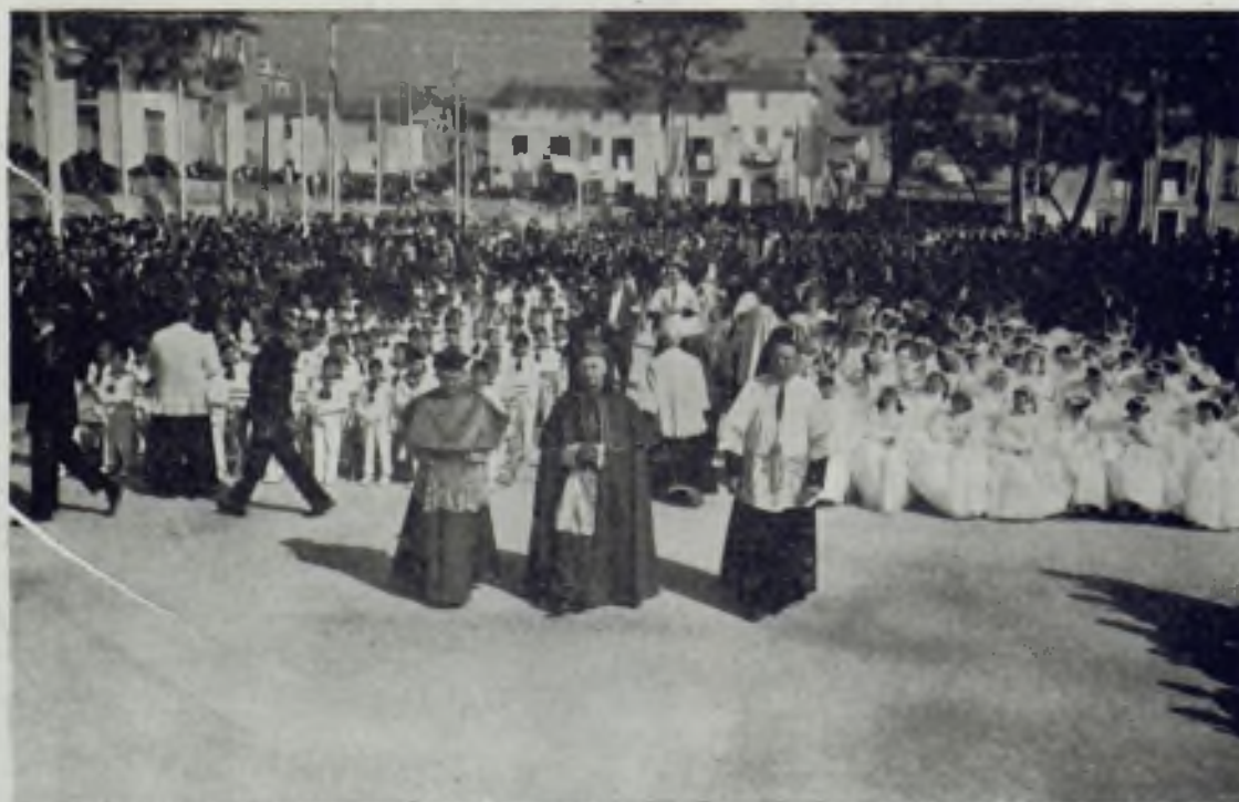
Primera Comuni- ción de los pi- ños,

fervor y la emoción con que asistieron a la Misa los enfermos congresistas de Inca y su Comarca. Pese al sol molesto y agobante un buen grupo de enfermos se asociaron a esta jornada emotiva. Después de la misa y comunión, el Sr. Arcipreste impuso la medalla conmemorativa a todos los enfermos congresistas, a todos los que habían ofrecido sus dolores y angustias por el éxito espiri-