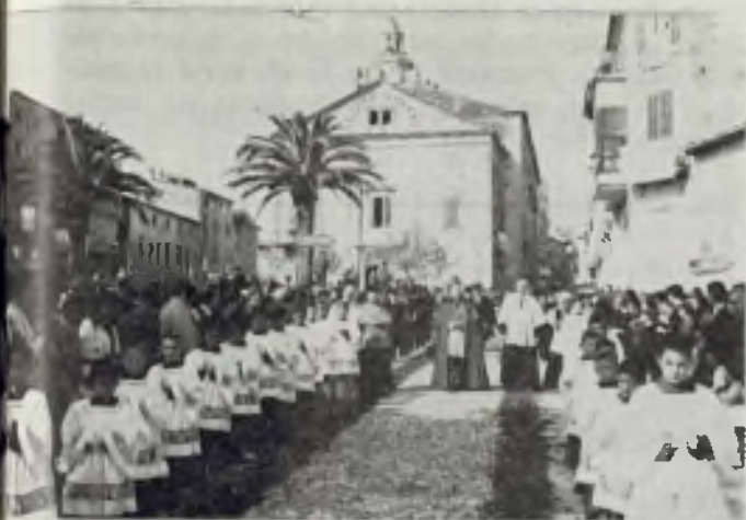
El Sr. Obispo presidiendo la procesión.

tuil del Congreso. El acto fué radiado por la emisora local para los imposibilitados de acudir a la plaza del Congreso.