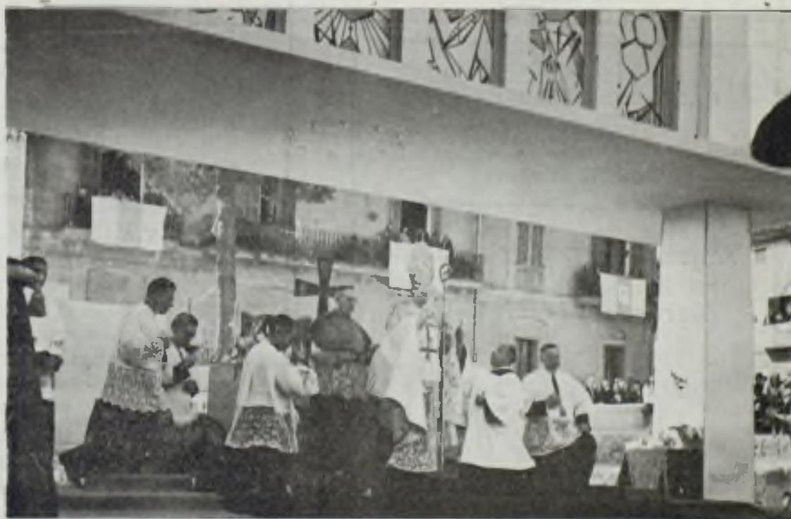
El Sr. Obispo dando la bendición desde el altar.

De inenarrable puede calificarse la imponente Procesión Eucarística. Con una precisión y orden extraordinario se organizó el último acto del Congreso. Un gran número de hombres y jóvenes mayores de 14 años iniciaron el grandioso cortejo eucarístico. Todos los pueblos de la Comarca en grupos compactos iniciaban la marcha. El Santísimo Sacramento era llevado sobre magnífica carroza adornada profusamente de cirios y flores. El paso del Señor en medio de un silencio y recogimiento extraordinario invitaba a la adoración y al fervor.