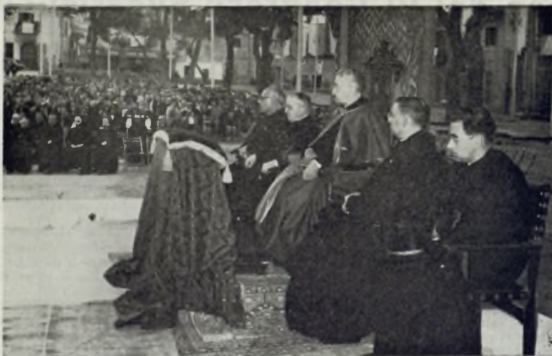
Acto inaugural del Congreso.

Por la noche en la misma iglesia se celebró una Hora Santa por cada.