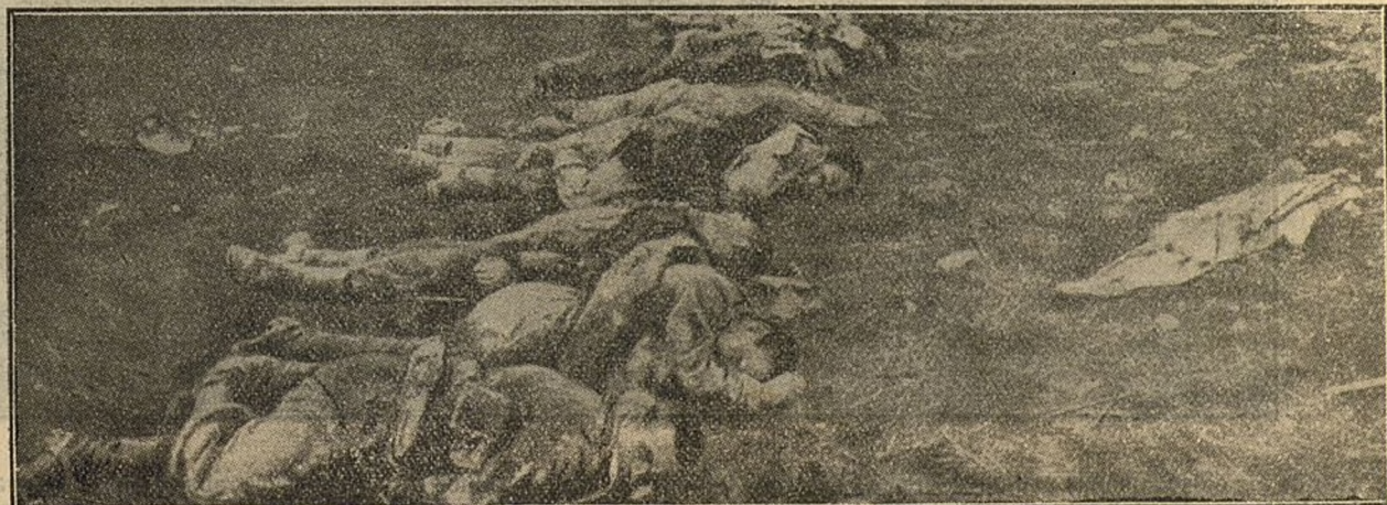
Una escena de horror.—Montones de cadáveres que no han podido enterrarse, y que durante la noche son despojados de todos los objetos de valor por los ladrones que siguen a los ejércitos.

Los merodeadores se ocultan en cuevas y barrancos donde esconden también sus latrocinios.