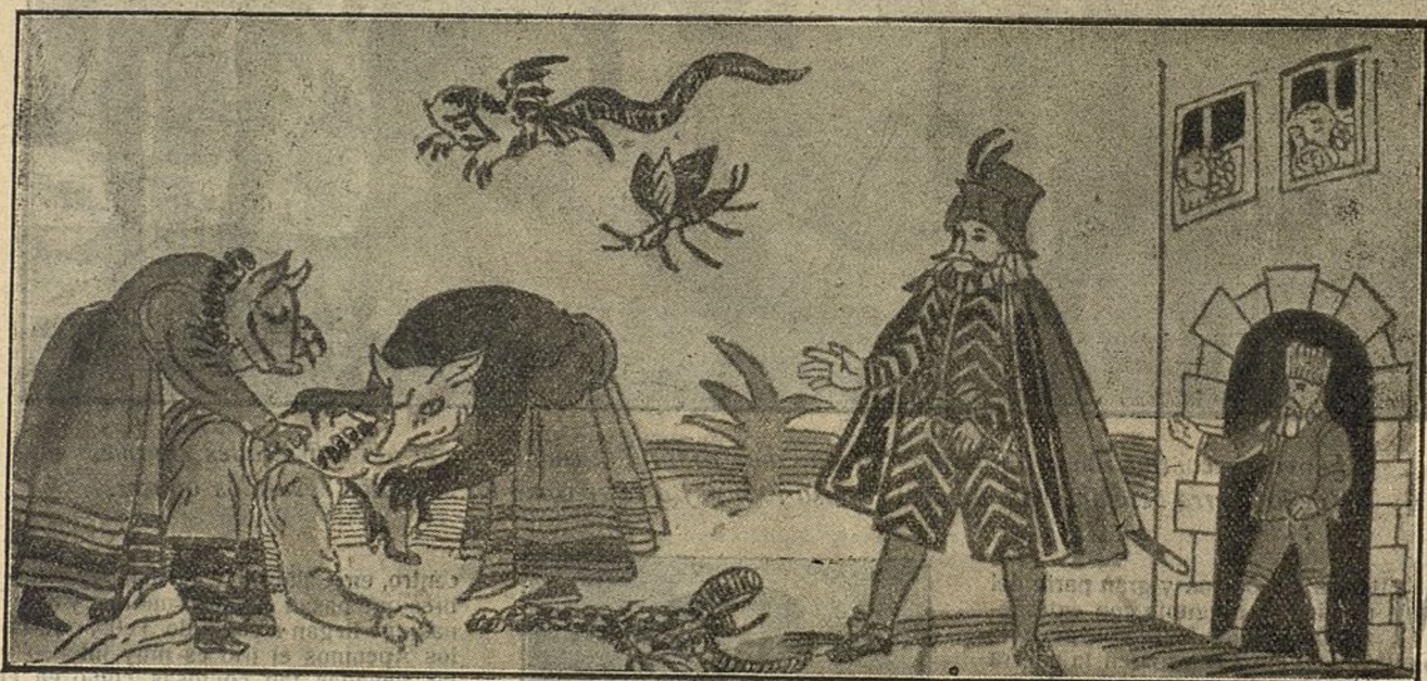
Mujeres lobas devorando á otra, según la imaginaban los pueblos antiguos. (Dibujo auténtico de la Edad Media en el que se figura una pasión horrible que ahora vuelve á aparecer con la guerra europea)

Los otros dos casos, los que ocurrieron en Rusia, son aún más típicos, más conformes con la leyenda. Los doctores Shalabutoff y Baklushinski dan cuenta de esos hechos, diciéndo, no obstante,