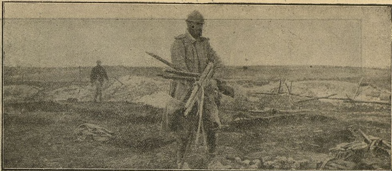
Soldado francés recogiendo las armas abandonadas en el campo de batalla, para evitar que las roben los merodeadores.

epidemia licantrópica, igual que en la edad de las leyendas. Dicese que en una aldea todos los habitantes han sufrido el ataque de locura, cometiendo actos de ferocidad inconcebibles. Quizás en los relatos haya exageración, dado que en esto juega mucho el poder sugestivo; pero no es difícil de creer en esos sucesos, teniendo en cuenta que el hambre y las angustias, unidas a las supersticiones, hacen posibles los hechos más horribles e insólitos.